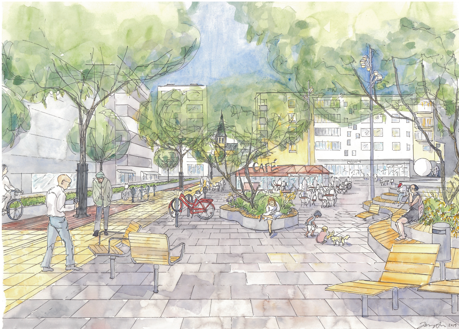
Illustration Johanna Almgren, COWI