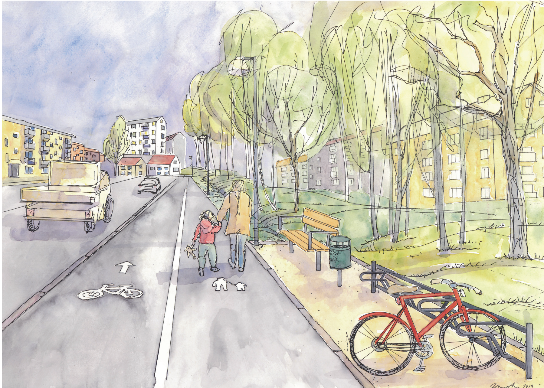
Illustration Johanna Almgren, COWI