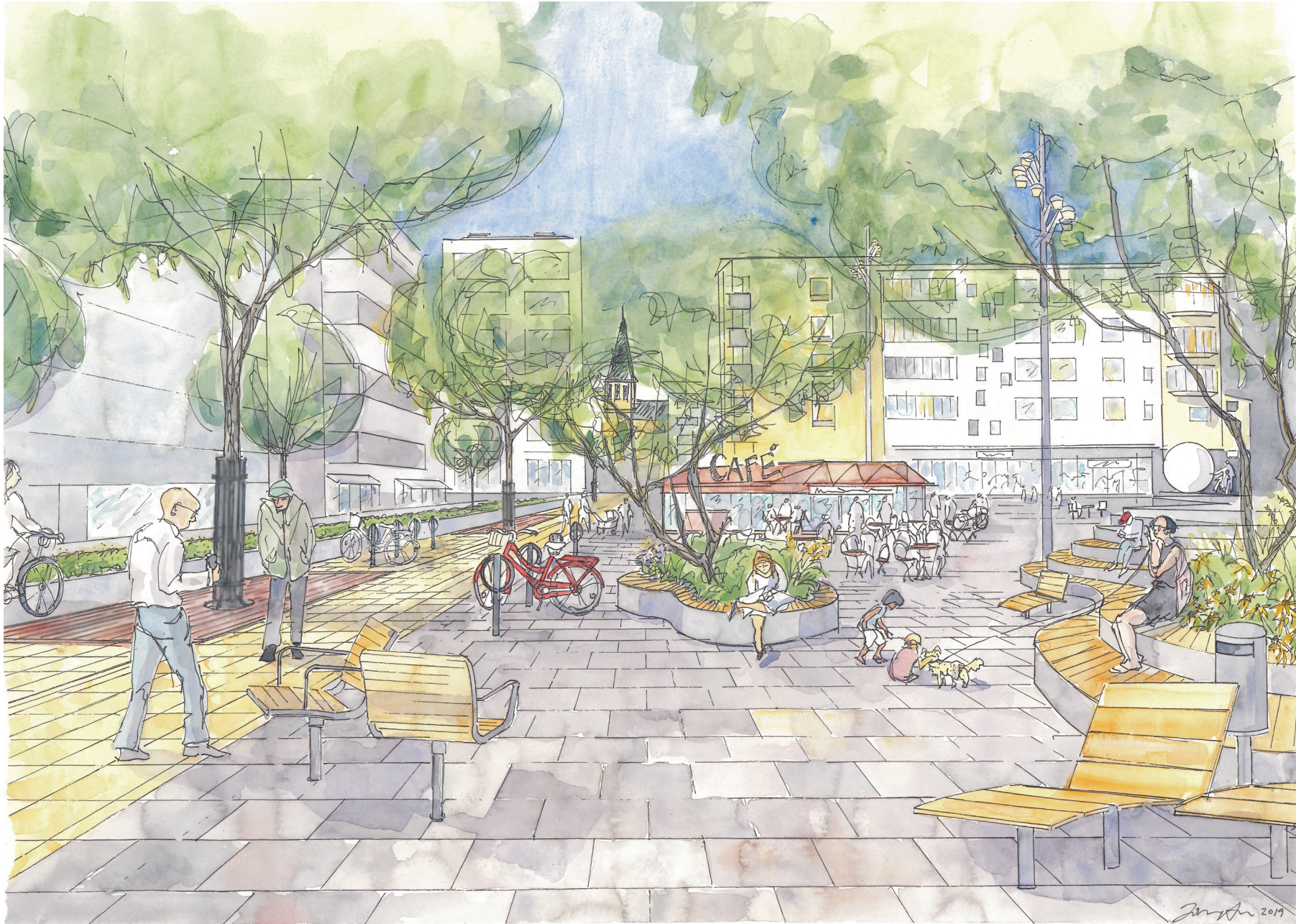
Illustration Johanna Almgren, COWI