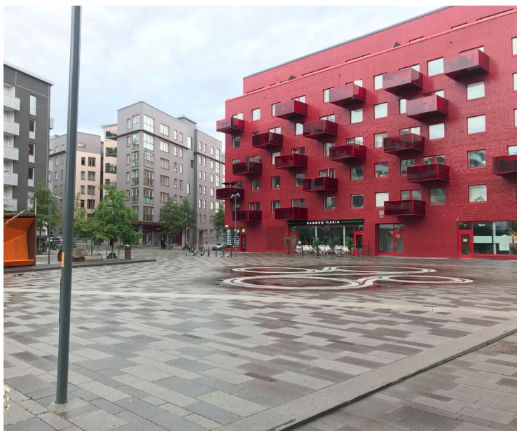
Exempel på torg med en nivå som motsvarar unik, Storängstorget, Norra Djurgårdsstaden.

Val av växter och material är väldigt fritt på en plats med unik nivå och begränsas enbart av projektets ekonomi, Nackas krav på miljö och hållbarhet samt att anläggning måste vara rimlig att drifva och underhålla. Gatuträd kan, precis som i utökad nivå, användas i den unika nivån. Utöver träd kan alla typer av perenner och/eller buskar användas. Markbeläggningen kan till exempel bestå av granithällar, tegel, skiffer, betongplattor, betongsten, grus, asfalt, trä osv. Kantsten utgörs av granit. Vid behov av murar kan blockstensmur av granit, platsgjutna betongmurar, beklädnadsmurar osv användas. Möbler kan till exempel vara platsbyggda, ha en speciell utformning eller bestå av dyrare material.