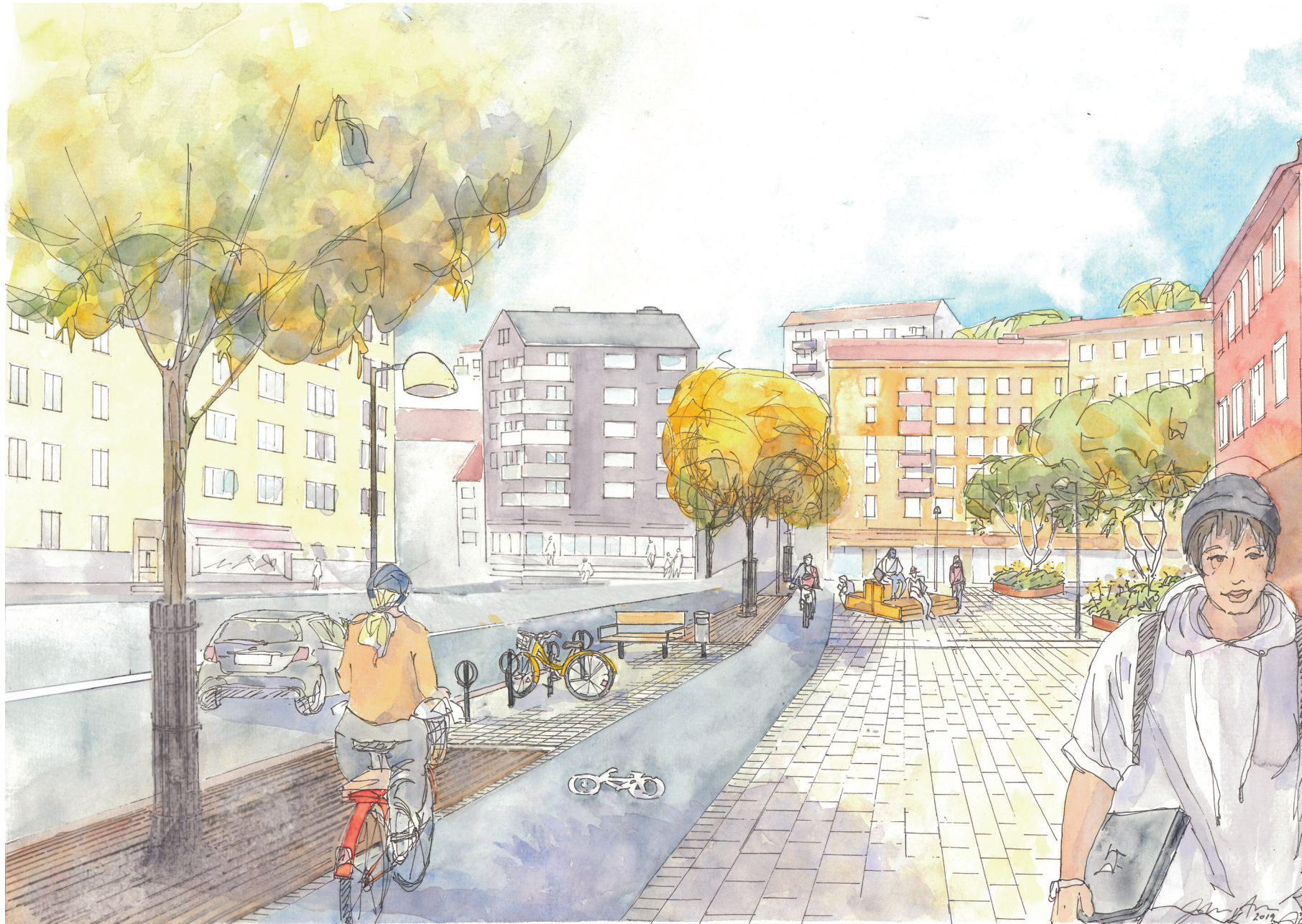
Illustration Johanna Almgren, COWI