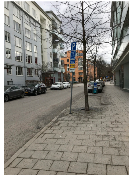
Exempel på gator med en nivå som motsvarar utökad, Rorgängargatan och Båtbyggargatan, Hammarby Sjöstad.