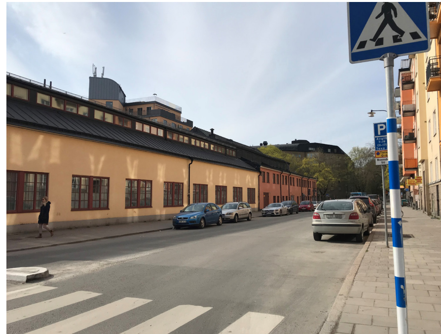
Exempel på gata med en nivå som motsvarar standard, Ljusterögatan, Stockholm.