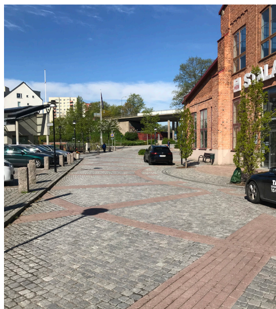
Exempel på torg med en nivå som motsvarar unik, Gustaf De Lavals torg, Nacka.