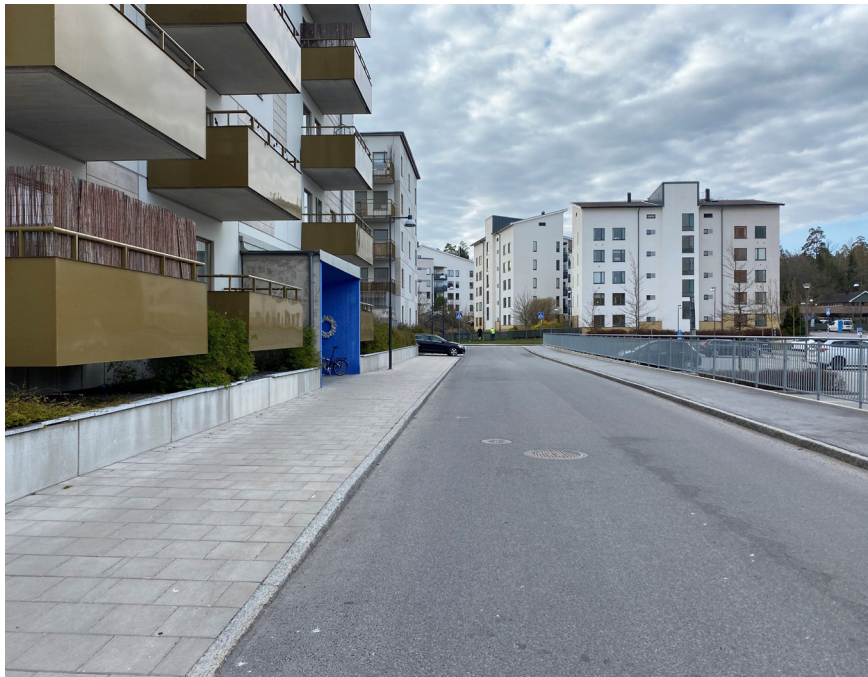
Exempel på gata med en nivå som motsvarar standard, Britt-Louise Sundells gata, Gustavsberg.

I denna nivå ingår generellt inga anlagda träd- eller buskplanteringar och den vegetation som finns med är befintlig. Gång- och cykelbanor kan vara belagda med asfalt. Gångbanan kan även vara belagd med betongplattor av standardtyp. Stenmjöl kan användas i exempelvis möbleringszoner. Separering av fotgängare och cyklister sker generellt genom målning och inte material. Kantsten utgörs av granit. Vid behov av murar kan I-stöd eller blockstensmur av betong användas.