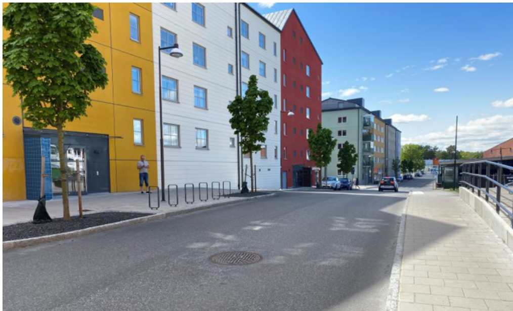
Exempel på gata med en nivå som motsvarar utökad, Chamottevägen, Gustavsberg.

En av de största skillnaderna från standardnivån är att gatuträd, buskar och/eller marktäckande perenner kan användas i utökad nivå. Gatuträd är kostsamma och påverkar därmed både utbyggnadskalkylen och drift- och underhållskostnader. Perenner av solitärtyp som kräver mer skötsel används inte i denna nivå. Generellt kan betongplattor användas på gångbanan och asfalt på cykelbanan. Betongsten kan markera exempelvis möbleringszoner och kantstensparkerings och galler kan täcka trädens planteringsytor. Kantsten utgörs av granit. Vid behov av murar kan platsgjutna eller prefabricerade varianter i betong användas, liksom blockstensmur av betong eller I-stöd. Om I-stöd ska användas är det lämpligt att dessa får någon form av beklädnad.