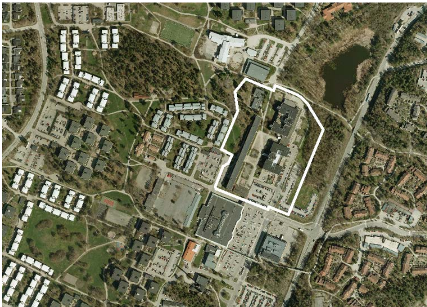
Ändringsområdets läge i Orminge centrum.

Antagen av miljö- och stadsbyggnadsnämnden 2011-10-19 § 308