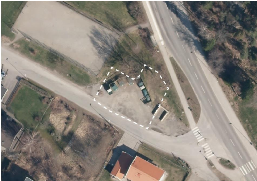
Kartan visar ett flygfoto över området.

Den befintliga återvinningsstationen är belägen i korsningen Ulvsjövägen/Ältavägen. Marken ägs av Nacka kommun.