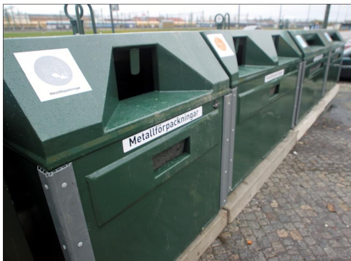
Exempel på krantömmande behållare.

Redan idag har nya behållare placerats ut på återvinningsstationen. Alla behållare är nu krantömmande och därmed i ett mer enhetligt utförande. Vissa behållare byts ut successivt beroende på gällande avtal. En ny typ av ljuddämpande glasbehållare finns framtagen och kan komma att placeras ut. Dessa behållare dämpar ljudet som uppstår när förpackningar lämnas i behållaren. Behållarnas placering i förhållande till planket har också en viss ljuddämpande verkan.