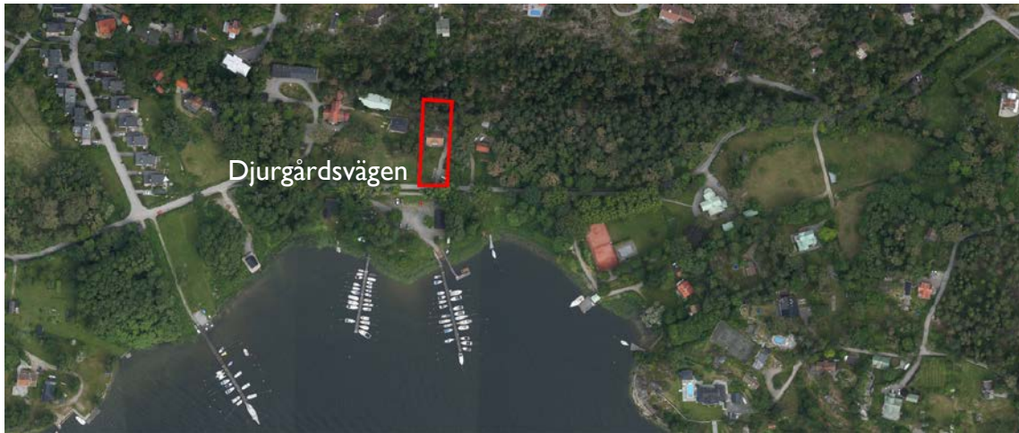
Kartan visar ett flygfoto över området

Planområdet utgörs av fastigheten Lännersta 1:1244, avstyckad från intilliggande fastighet Lännersta 1:907 den 21 januari 2012. Fastigheten ligger invid Djurgårdsvägen i kommundelen Boo, är cirka 2 550 kvadratmeter till ytan och ägs av privatperson.