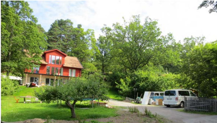
Fastigheten sett från söder. Foto: Emilie Larsen, 2015