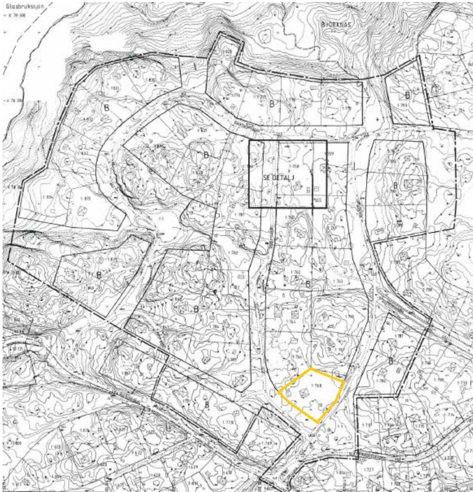
Del av gällande Dp 66 som berörs av ändringen (markerat med gul linje)

Dp 66 och Dp 499. De gällande planernas bestämmelser gäller alltså tillsammans med denna ändring.