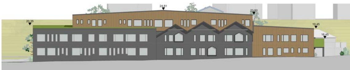
Fasad mot norr, med höjder. Bild: Scharc Arkitekter 2017