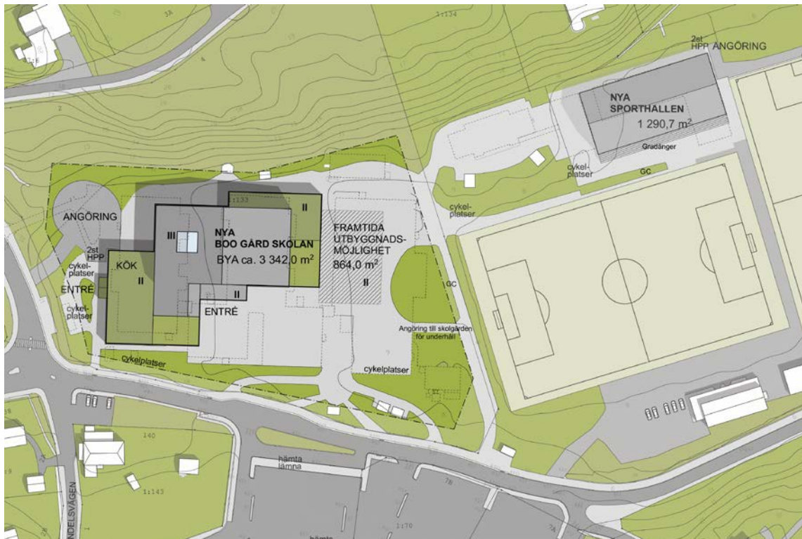
Situationsplan skola. Bild: Scharc Arkitekter 2017