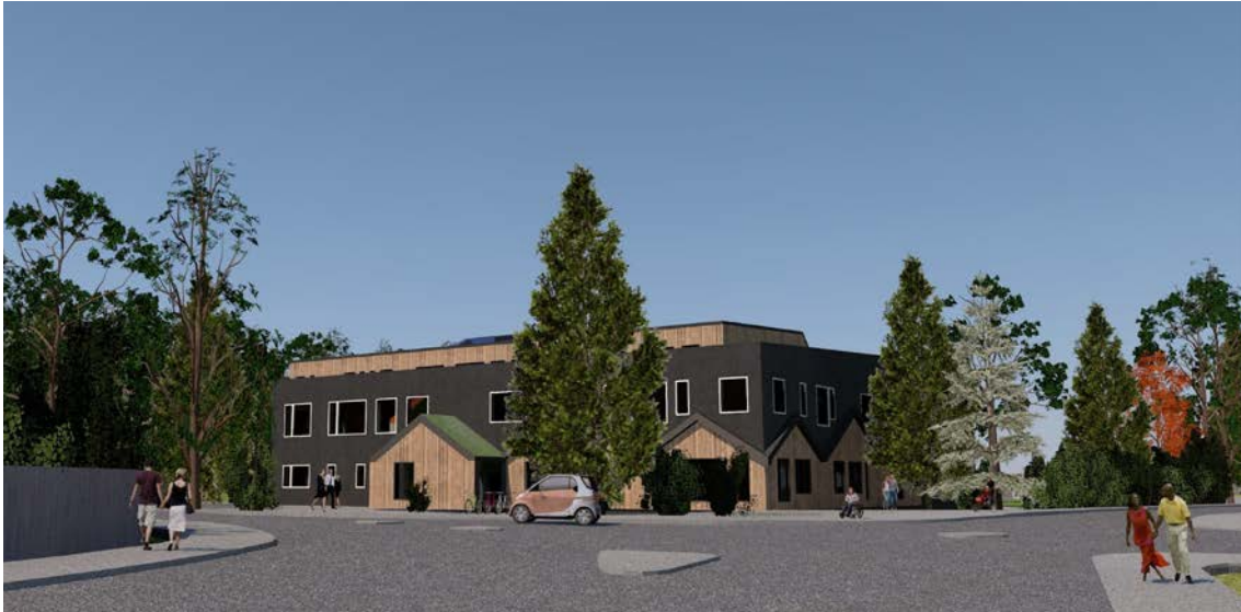
Perspektiv från Boovägen. Bild: Scharc Arkitekter 2017

De högre delarna av skolan föreslås utföras med träfasader. Delar av taken föreslås vara växtklädda med exempelvis sedumväxter, ”gröna tak”. Gröna tak har de fördelarna att de hjälper till att fördröja regnvatten samt att de ser vackra ut. Huvudentrén mot skolgården skall vara tydlig och välkomnande med stora ljusinsläpp. De mindre entréerna ska också vara tydligt markerade.