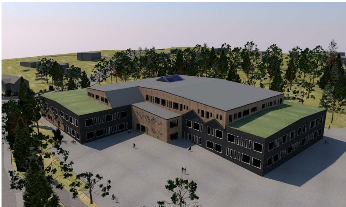
Översiktsbild planerad skola, från sydost. Bild: Scharc Arkitekter 2017