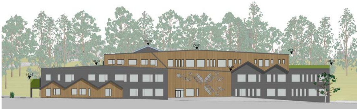
Fasad mot söder, med höjder. Bild: Scharc Arkitekter 2017

Skolans lokalyta kommer att kunna utökas väsentligt gentemot de lokaler Boo gårds skola har idag. För att inte den nya skolan skall kännas för stor föreslås att volymen bryts ned i flera volymer och skalan tas ytterligare ned genom ett varierat fasaduttryck inspirerat av Boo Gård och den omgivande villabebyggelsen. Illustrationerna visar en möjlig utformning av skolan och sporthallen.