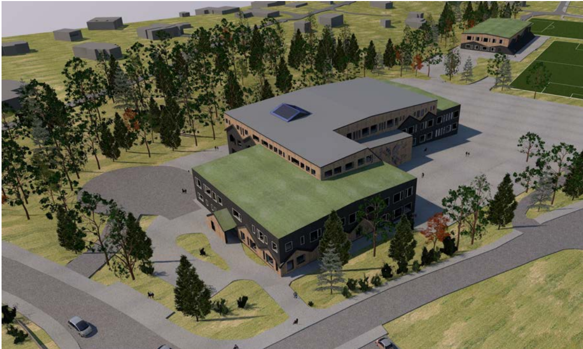
Översiktsbild planerad skola, från sydväst. Bild: Scharc Arkitekter 2017

Skolans lokalyta kommer att kunna utökas väsentligt gentemot de lokaler Boo gårds skola har idag. För att inte den nya skolan skall kännas för stor föreslås att volymen bryts ned i flera volymer och skalan tas ytterligare ned genom ett varierat fasaduttryck inspirerat av Boo Gård och den omgivande villabebyggelsen. Illustrationerna visar en möjlig utformning av skolan och sporthallen.