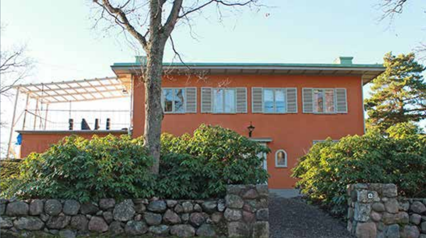
Solsidan 21:2 - Strandvägen 4