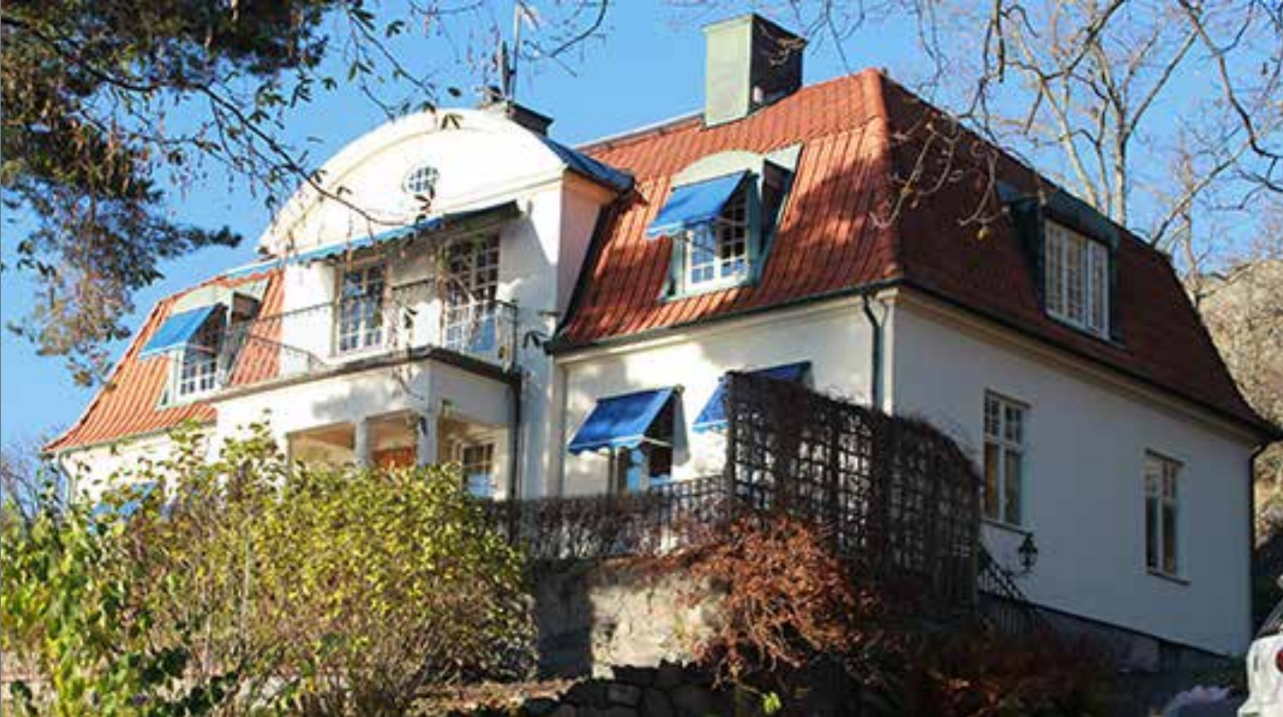
Solsidan 19:21 - Ravinvägen 18