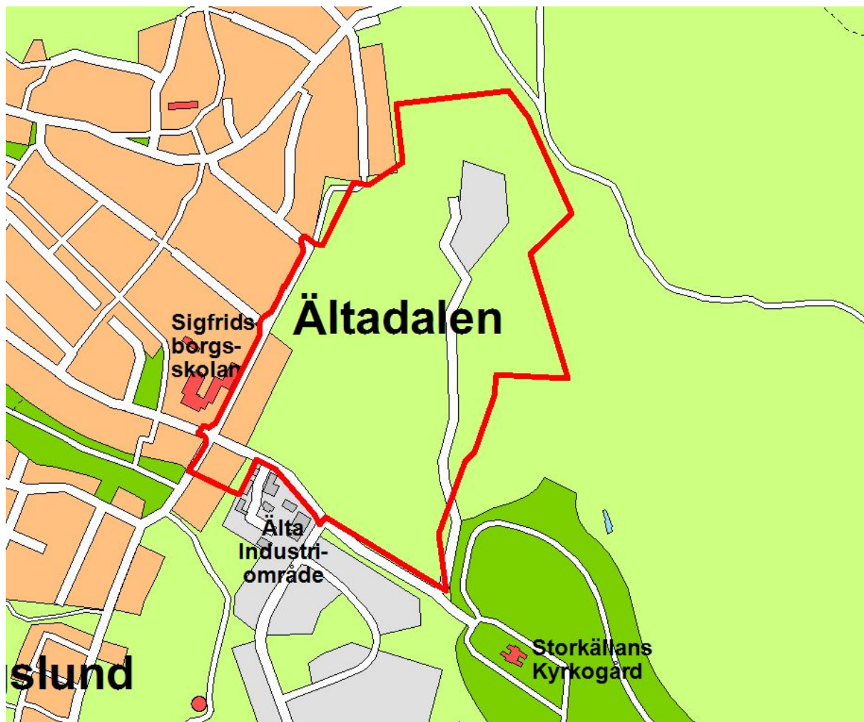
Bild 1. Planområdet

Planområdet ligger i östra delen av Älta och omfattar en areal om drygt 33,6 ha. Området begränsas i öster av Storkällans kyrkogård och naturmark som hör till Erstavik – i norr av resterande del av Erstavik 25:32, i väster av bebyggelsen på Åsvägen och Lovisedalsvägen, samt i söder av Storkällans väg. Områdets avgränsning framgår av bifogad karta (bild 1).