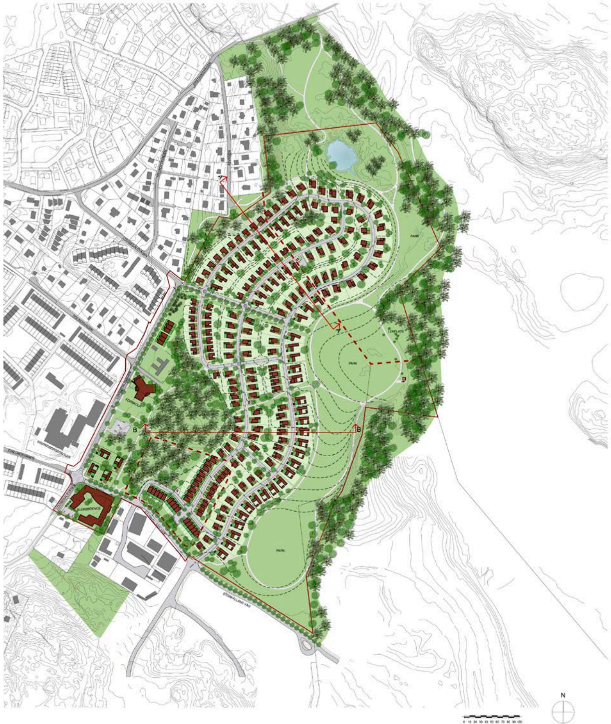
Bild 2. Illustration till detaljplan för Ältadalen, ÅWL arkitekter

I en illustration till detaljplanen som har tagits fram av ÅWL arkitekter redovisas tänkbar bebyggelse. Bebyggelsen föreslås huvudsakligen bestå av friliggande småhus (villor och radhus), samt förskola och äldreboende. De östra och norra delarna lämnas obebyggda som en del av ett större parkstråk genom Älta och vidare ut mot Erstavik (bild 2).