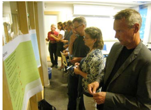
Figur 4. Bilder från workshop

Efter en inledande beskrivning av Ältaområdet delades deltagarna in i fyra grupper utifrån de olika hållbarhetsområdena ekologisk, ekonomisk, strukturell och social hållbarhet. En tabell på exempel på aspekter att beakta för respektive område delades ut. Efter redovisning av respektive grupp genomfördes en omröstning bland samtliga angående de viktigaste frågorna att fokusera på inom respektive område. Ett andra grupparbetesmoment syftade till att formulera de tre viktigaste målsättningar för vardera av de fyra aspekterna. Detta gav ett resultat på tolv prioriterade hållbarhetsmålsättningar som redovisas nedan under punkt 4.3. Målen färgkodades i enlighet med de olika hållbarhetsaspekterna: