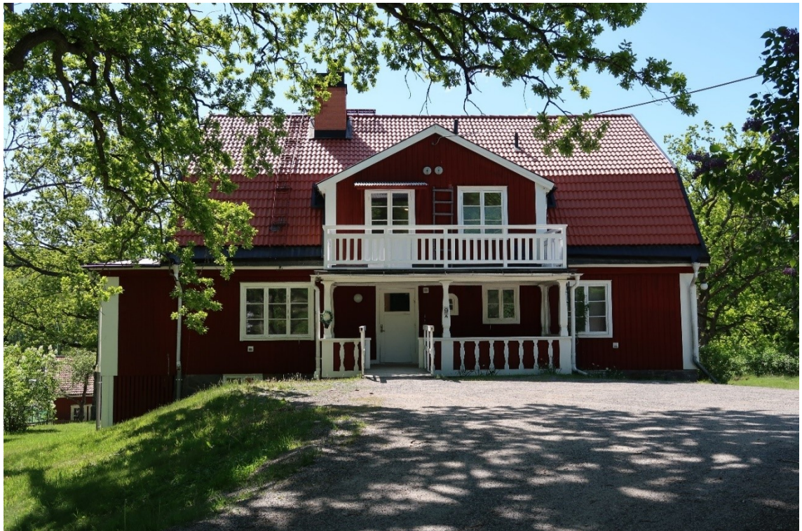
Entréfasaden mot Boo Kyrkväg i norr.