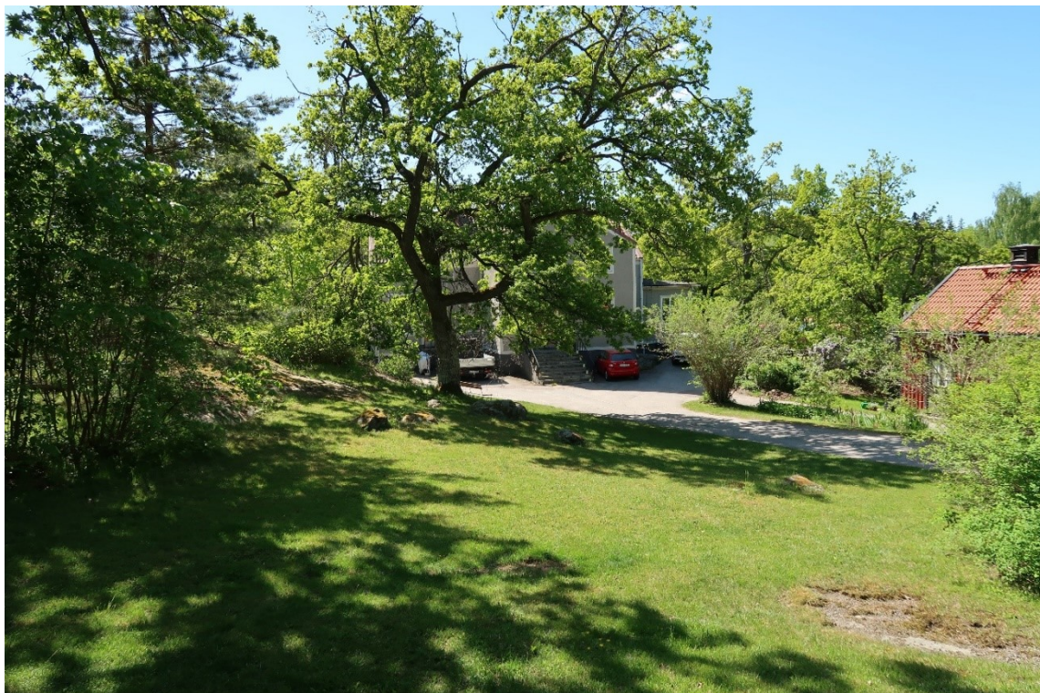
Tomterna är naturpräglade med gamla träd och bevarade hällmarkspartier. Huvudbyggnaderna ligger i södra delen av tomtarna, uthus och annex i vinkel och närmare vägen.