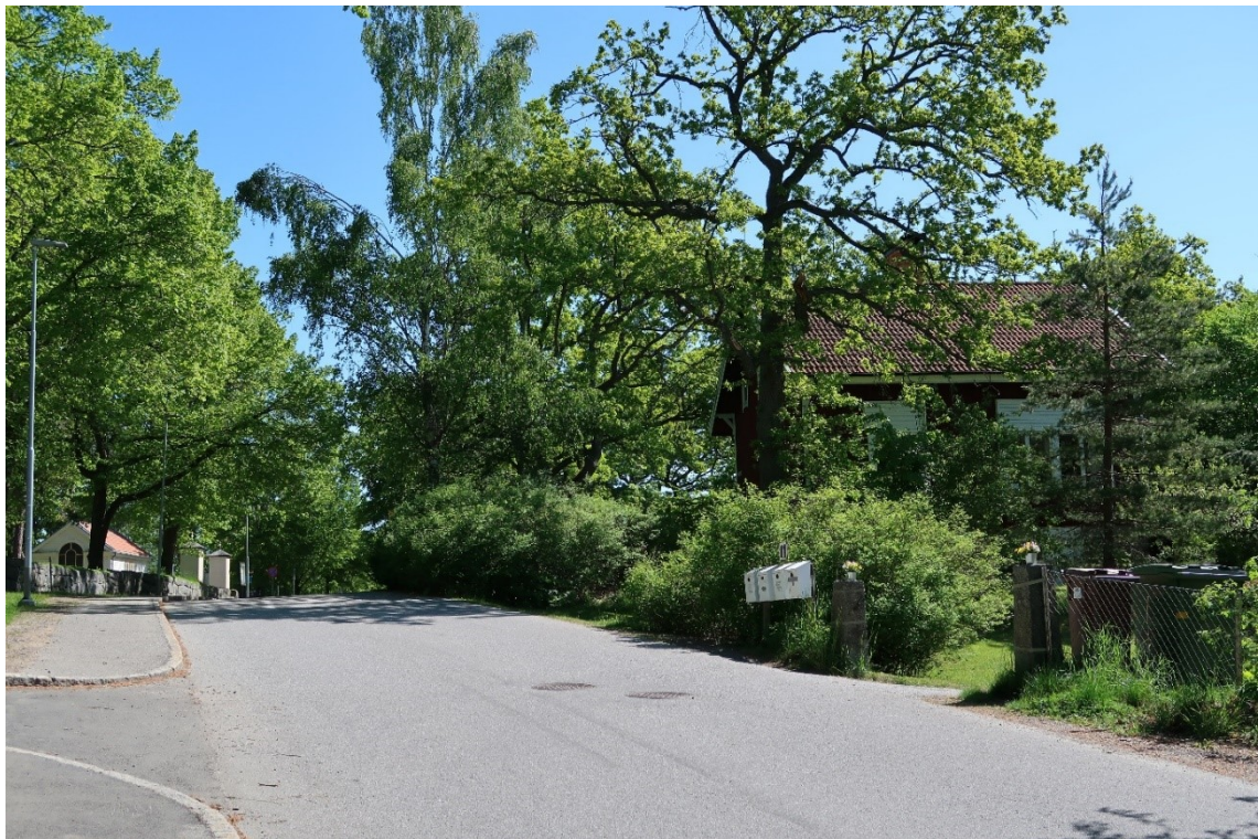
Vy längs Boo kyrkväg mot planområdet med flera stora träd och hög grad av lummighet.