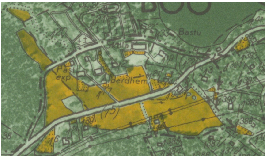
Området kring Boo kyrkväg på 1950-talets ekonomiska karta med Värmdövägen i nuvarande sträckning (kartan tryckt 1967).

Landskapet med Mensättra gårds odlingsmarker nedanför sockencentrat behöll sin agrara prägel fram till 1900-talets mitt. På 1950-talet anlades en idrottsplats på den tidigare åkermarken, men redan 1931 hade den gamla landsvägen som slingrade sig genom landskapet ersatts med en rakare och för bilismen anpassad väg rakt över den tidigare odlingsmarken.