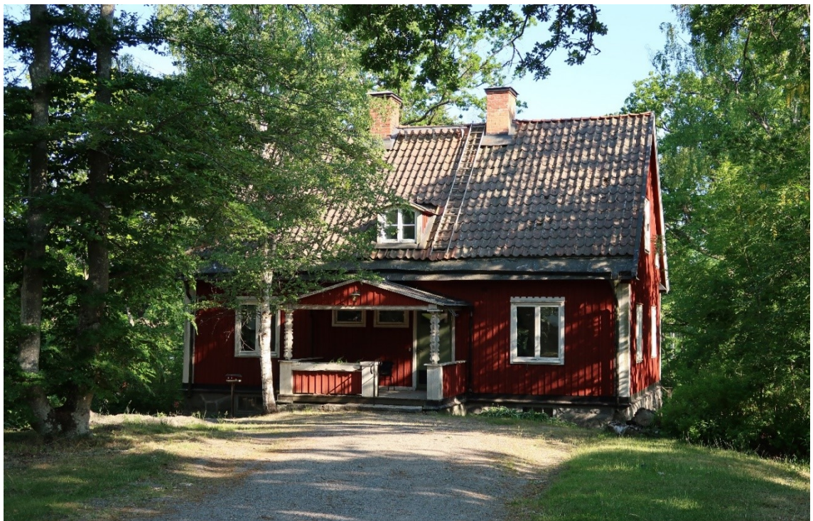
Fasaden mot norr.