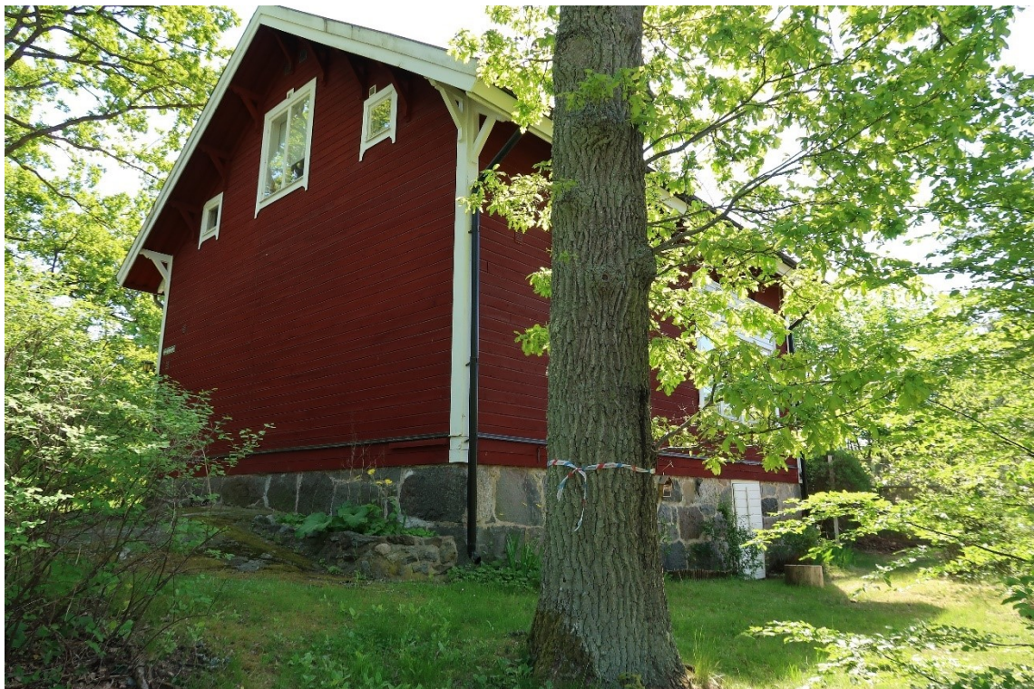
Byggnadens trädgårdsida sedd från Boo kyrkväg.