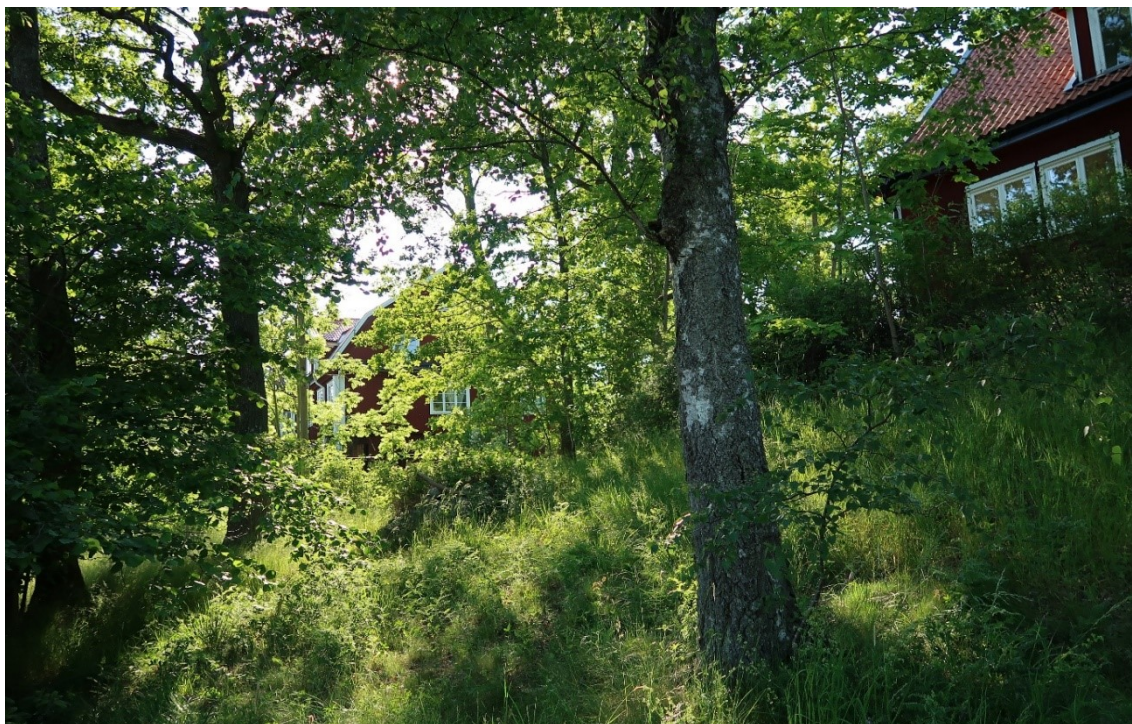
Södra delen av området, mot idrottsplatsen, har ängskaraktär med gräs, buskar och stora träd i mötet med den tidigare åkermarken. De i sen tid bildade fastigheterna saknar avgränsningar med staket och plank mellan varandra. Centralt i bild kan man se ett gammalt odlingsröse i rektorsvillans trädgård.