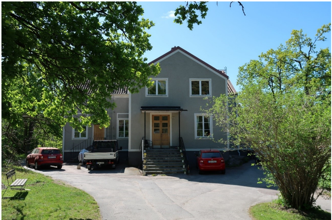
Entréfasaden mot norr.