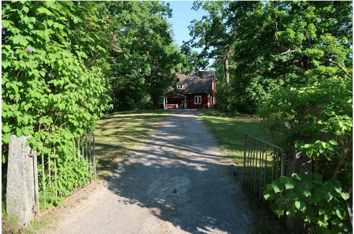
Fd rektorsbostaden sedd från Boo kyrkväg.