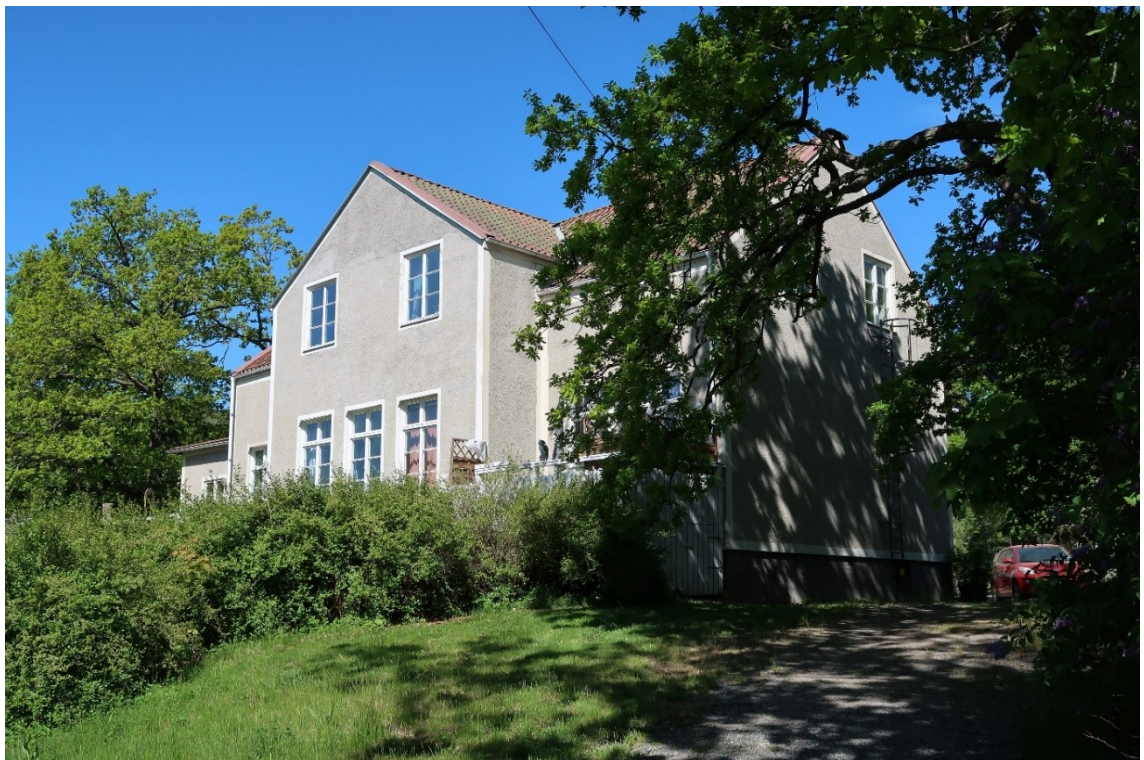
Fasaden mot söder visar tydligt den tidigare funktionen med församlingsal i bottenvåningen.