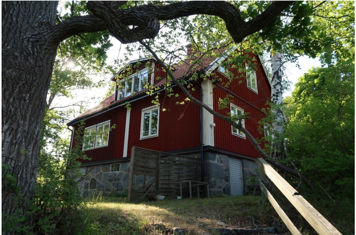
Fd rektorsvillan sedd från fastighetens sydöstra del.