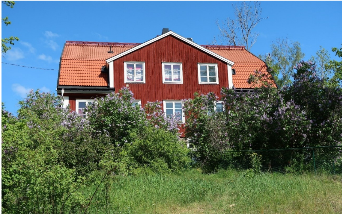
Byggnaden sedd från gång- och cykelvägen i söder.