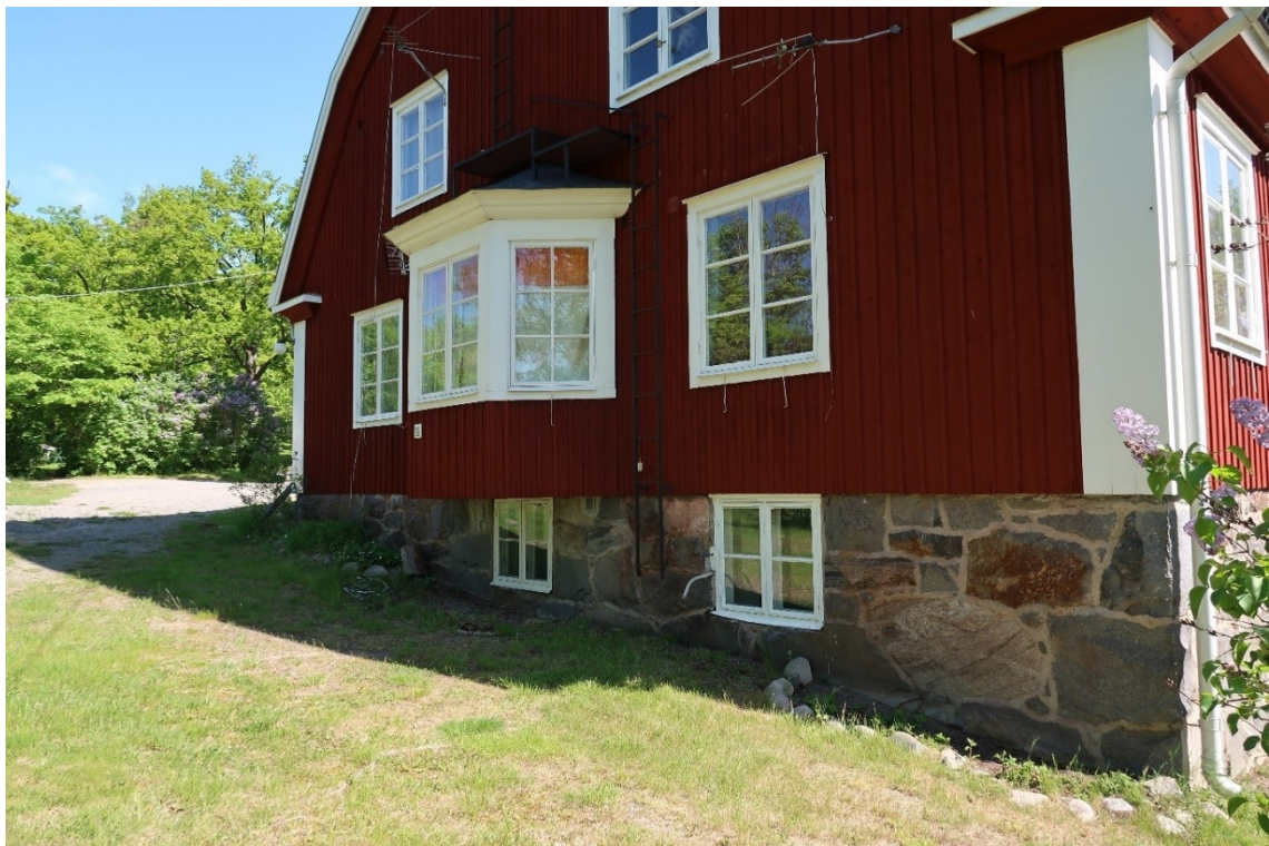
Burspråk vid västra gaveln.