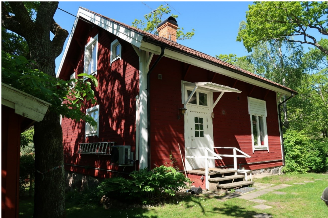
Byggnadens entréfasad mot öster.