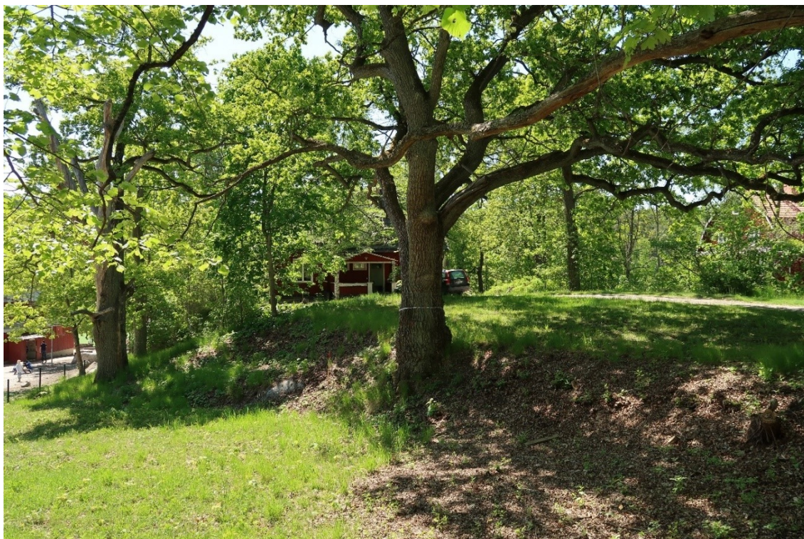
Stora ekar mellan fd lärarbostaden och skolgården.