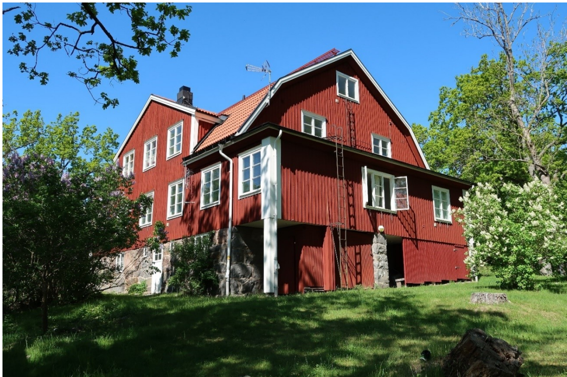
Mot söder har byggnaden en hög och välbyggd sockel med källarvåning, vy från sydost.