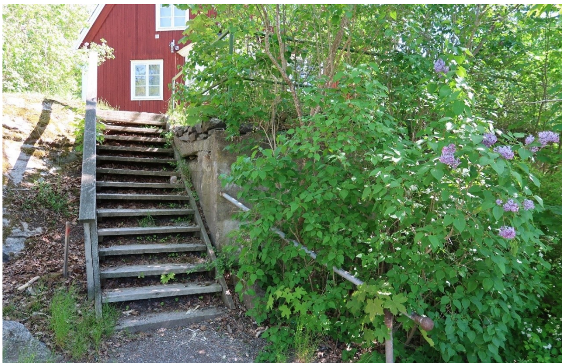
Att bebyggelsen har ett historiskt och funktionellt sammanhang visas bland annat av kopplingar mellan byggnaderna som här mellan fd församlingshemmet och ålderdomshemmet.