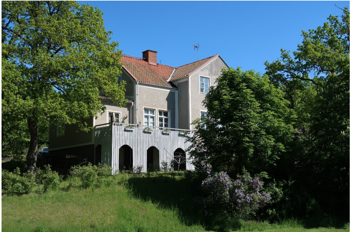
Fd församlingshemmet sett från gång- och cykelvägen i sydväst.