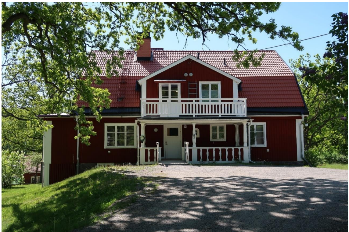
Entréfasaden mot Boo Kyrkväg i norr.