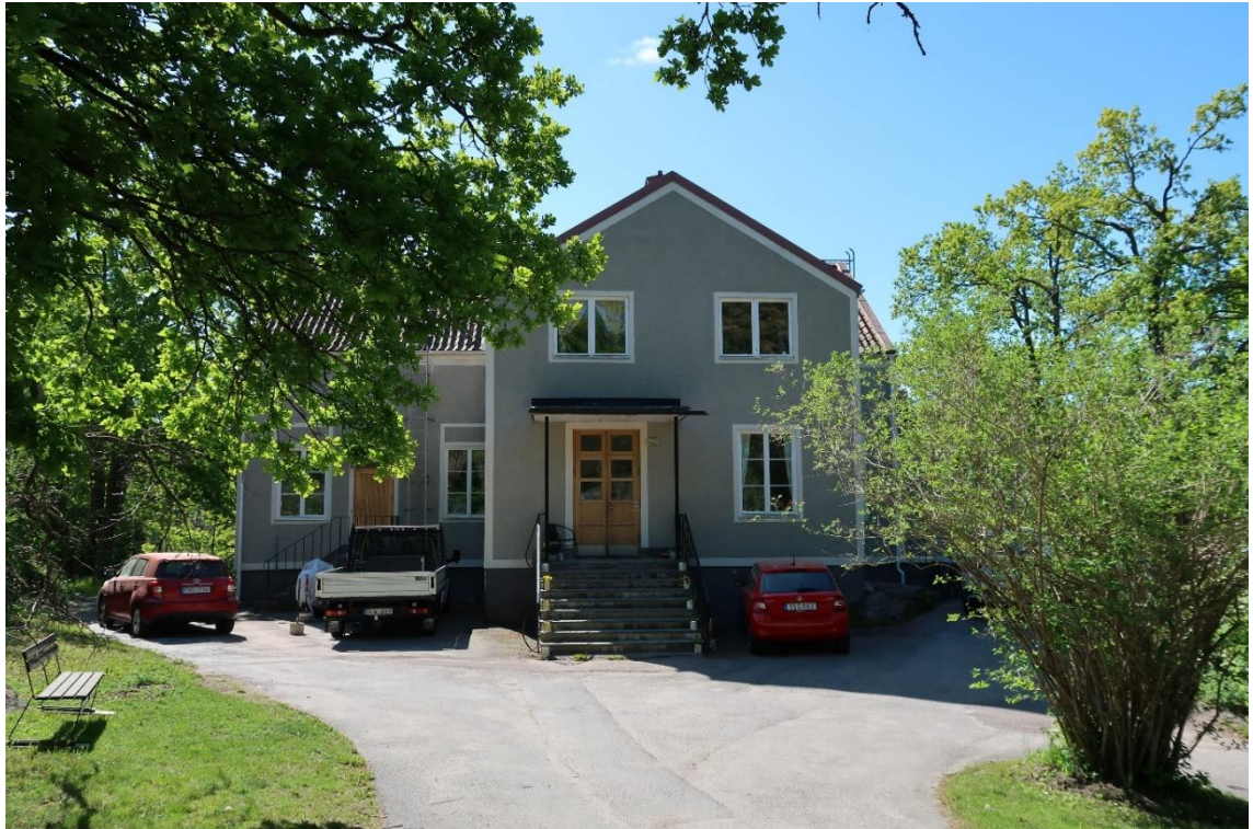
Entréfasaden mot norr.