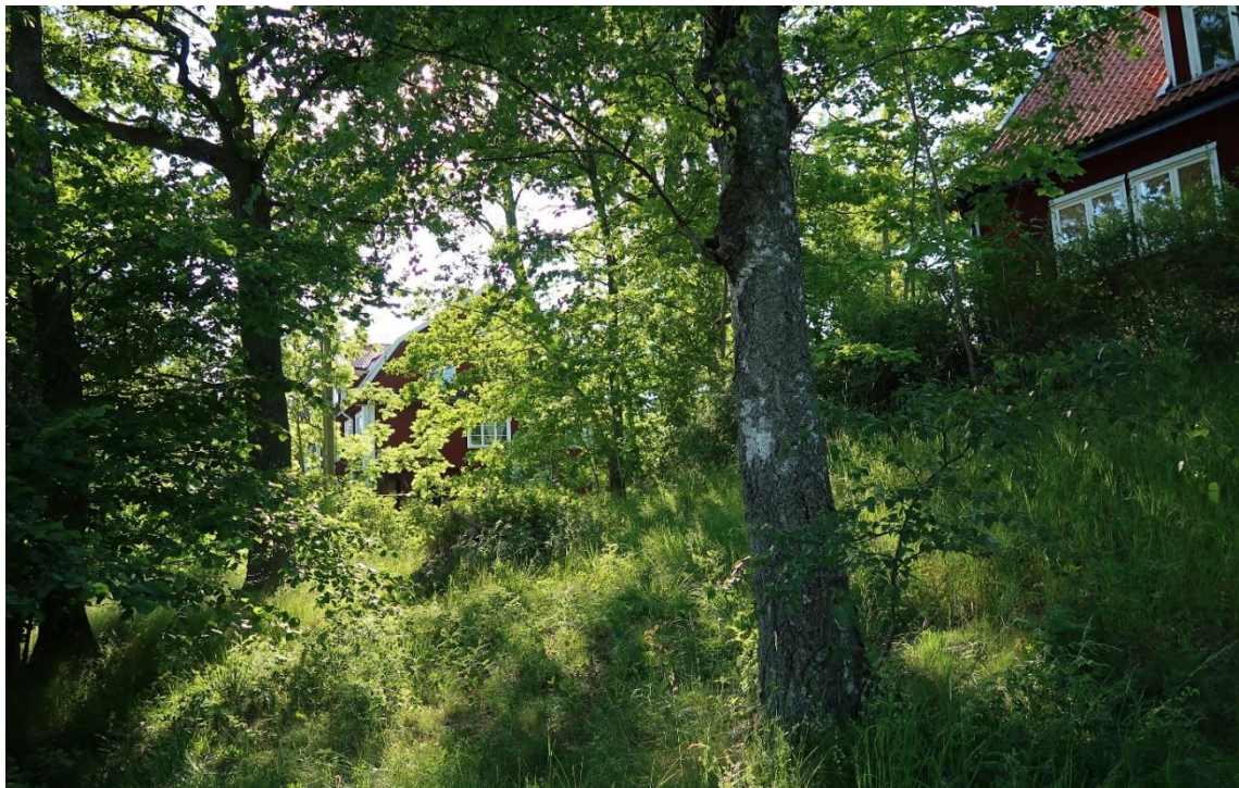
Södra delen av området, mot idrottsplatsen, har ängskaraktär med gräs, buskar och stora träd i mötet med den tidigare åkermarken. De i sen tid bildade fastigheterna saknar avgränsningar med staket och plank mellan varandra. Centralt i bild kan man se ett gammalt odlingsröse i rektorsvillans trädgård.