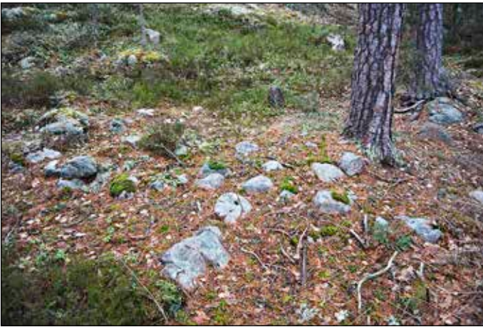
Fig 4. Objekt 2 - husgrundens kan skönjas i mossan, foto Arkeologistik.