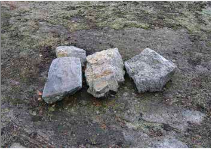
Fig 3. Objekt 1 - stenar på rad på berg tolkade som en skåre.