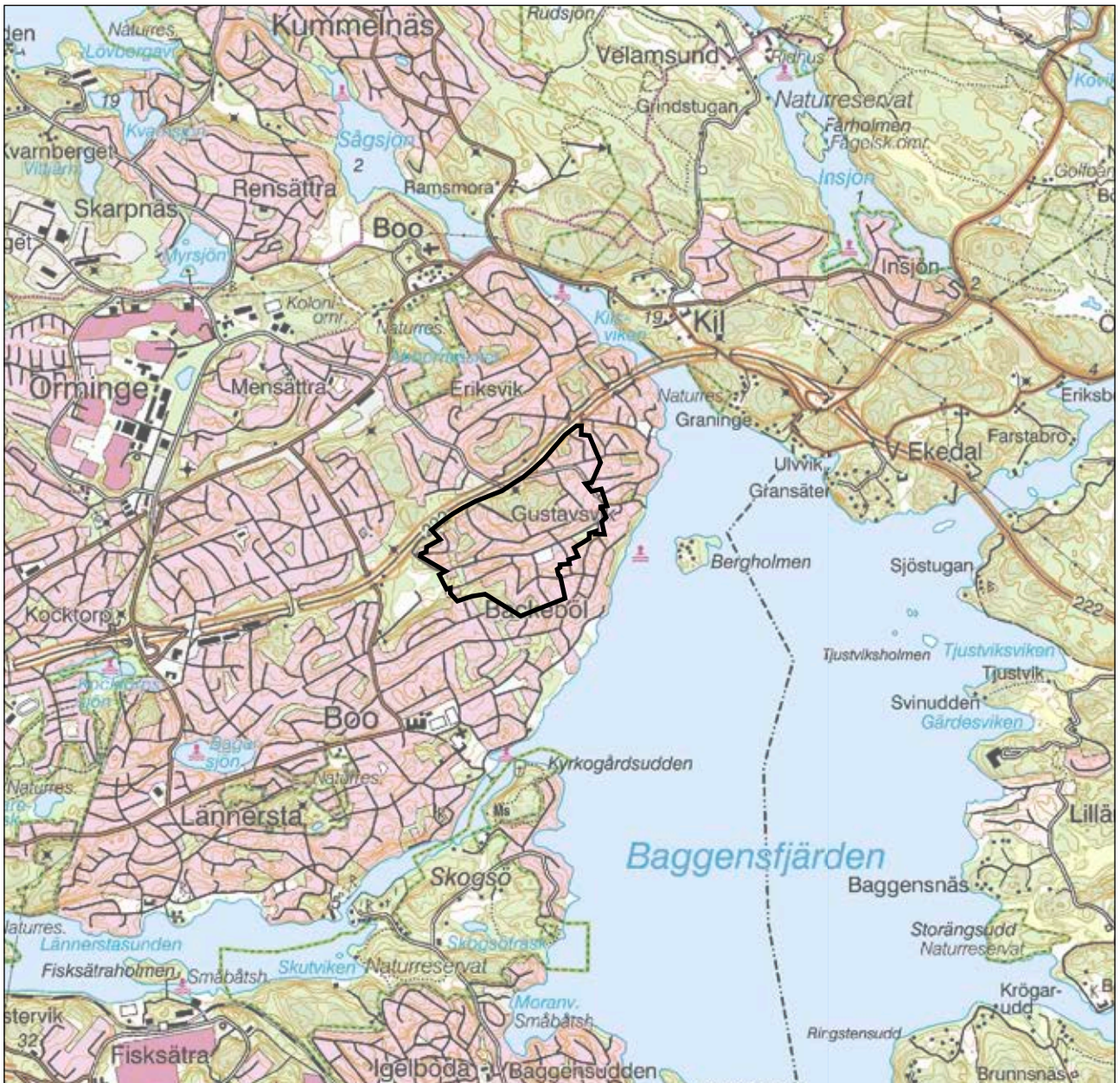
Fig 1. Läget för utredningsområdet markerat med svart linje på Terrängkartan, skala 1:40 000.