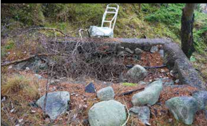
Fig 5. Objekt 4 - husgrundens uppbyggda grund och källaren/svalen, foto Arkeologistik.