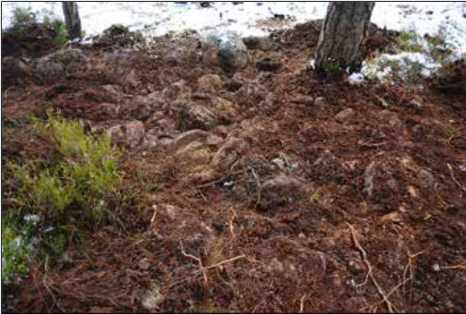
Fig 6. Objekt 3 - kraftigt stenig morän.

om (0,15 - 0,2 meter stora) vilka blandas med stenar i klapperstensfältet.