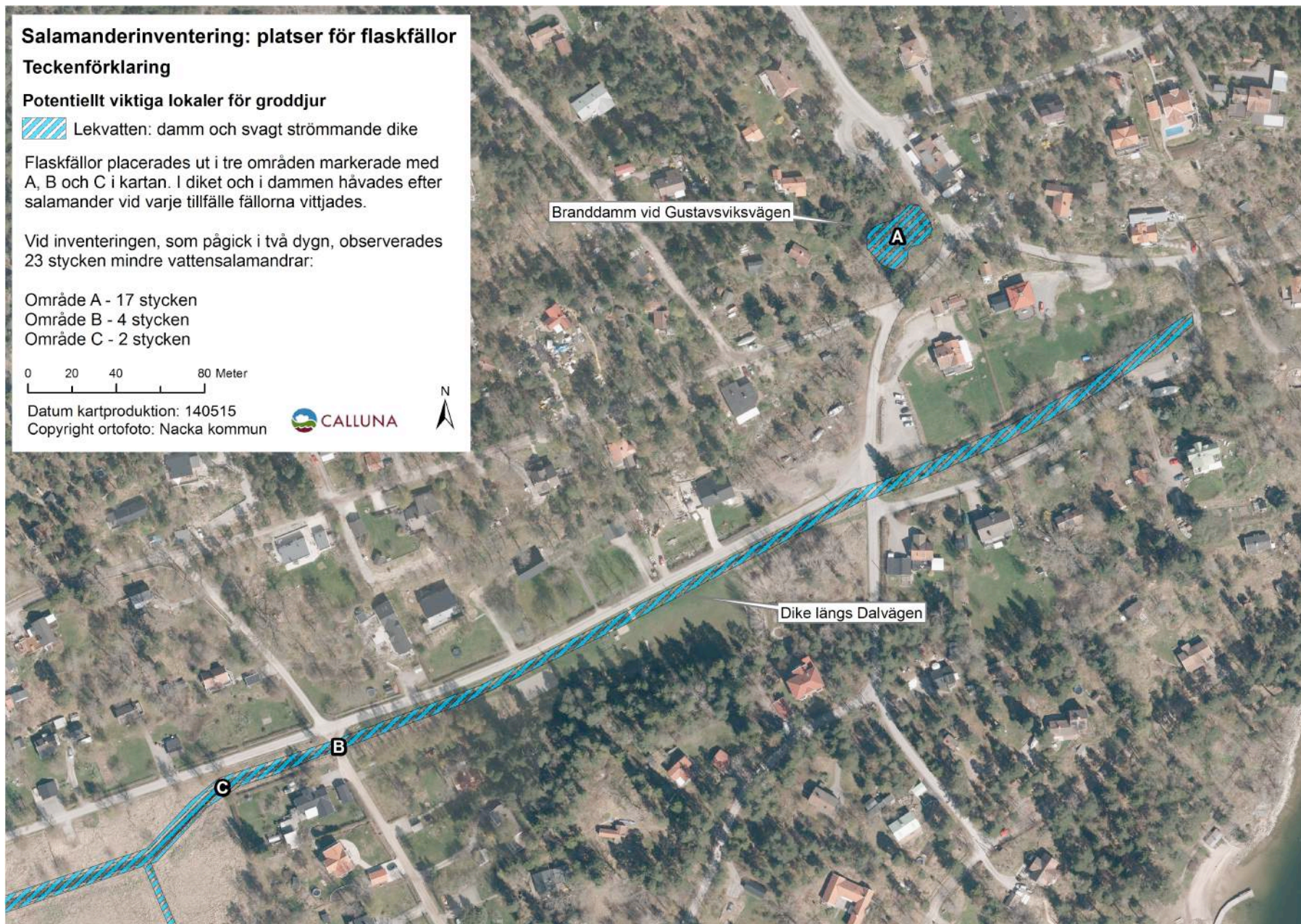
Karta 3. Kartan visar de tre områden (A-C) där flaskfällor fanns utplacerade och där det hävdades vid flaskinventeringen efter salamander.