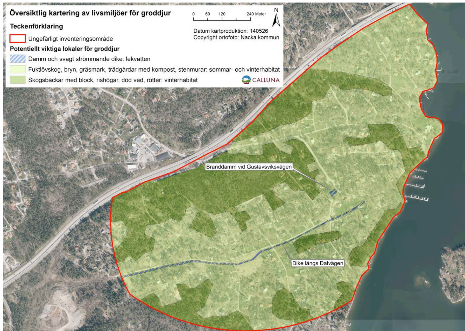
Karta 1. Kartan visar resultatet från den översiktliga karteringen av livsmiljöer för groddjur vid Dalvägen och Gustavsviksvägen. I området finns rikligt med potentiella sommar- och vinterhabitat.