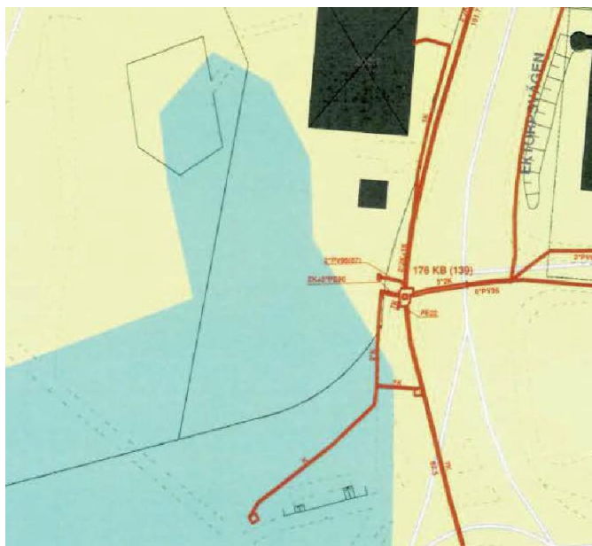
Bilaga tillhörande yttrande från Skanova

även bekostar den. Skanova utgår från att nödvändiga åtgärder i telenät till följd av planförslaget kommer att framgå av planhandlingarna.