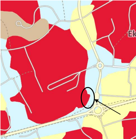
Figur 1: En översikt av geologin kring utredningsområdet

Figur 1 är ett utsnitt ur SGU:s kartmaterial. Figuren visar även utredningsområdets lokalisering (se pil). Denna figur visar att geologin kring utredningsområdet består av berg (rött) och morän (blått).