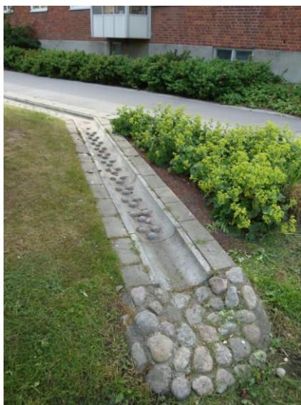
Figur 5: Exempel på ett avskärande avrinningsstråk med diffust utsläpp. Detta kan även utföras som ett dike.

Det avskärande vattenstråket ledar dagvattnet söder om det planerade flerbostadshuset med diffust utsläpp. I så fall bibehålls vattenförsörjningen till den skyddade eken. Eventuellt kan en kupolbrunn planeras för anslutning av större dagvattenflöden till befintligt dagvattensystem. Se även Bilagorna.