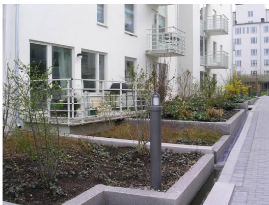
Figur 4: Exempel på växtbäddar.