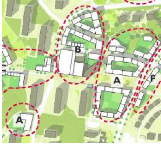
Stadsbyggnadsprojektet innefattar detaljplane-läggning och genomförande av etapp A och B.