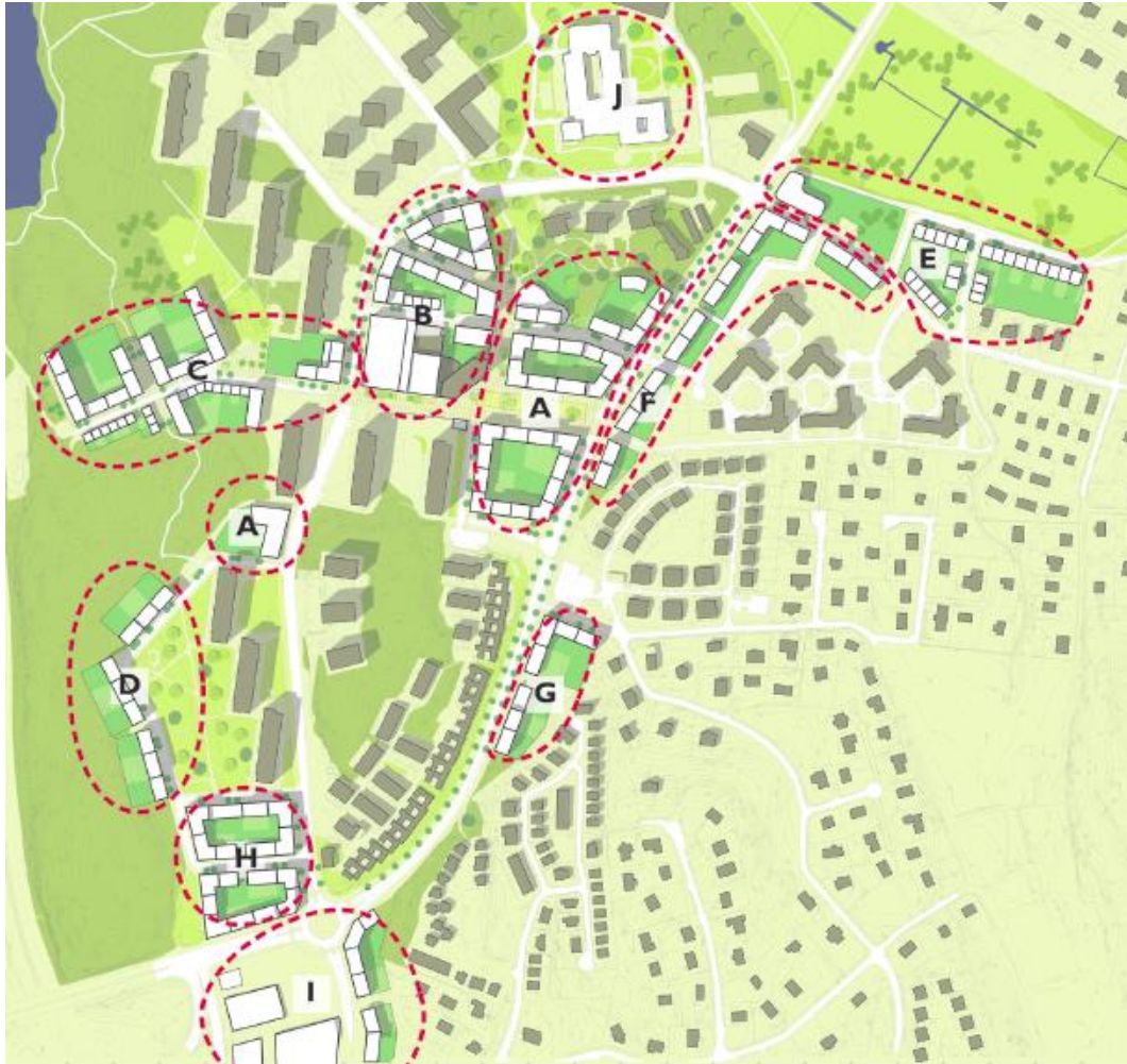
Etappkarta för Älta centrum från detaljplaneprogrammet. Vitmarkerad bebyggelse är tillkommande, gråmarkerad bebyggelse är befintlig. Detta stadsbyggnadsprojekt omfattar etapp A och etapp B.