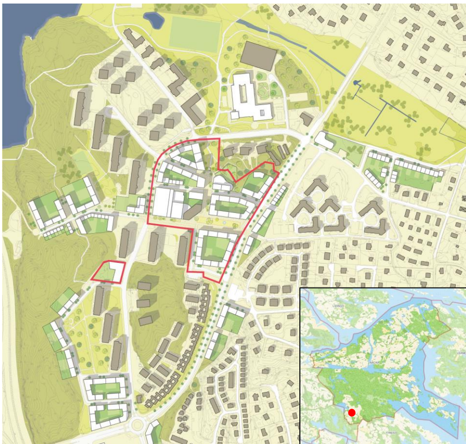
Kartan visar projektområdets avgränsning. Den lilla kartan visar var i Nacka kommun området ligger.

Förutsatt att kommande detaljplan/-planer för etapp A och B inte överklagas planeras utbyggnad av allmänna anläggningar och ny bebyggelse att påbörjas år 2018.