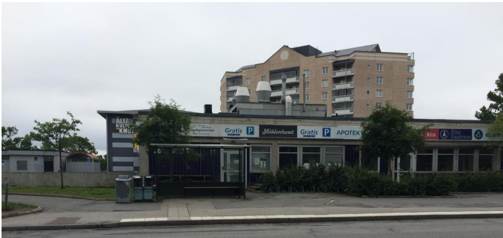
Del av nuvarande centrumbebyggelse vid Oxelvägen, Kulturknuten skymtar t.v. i bakgrunden