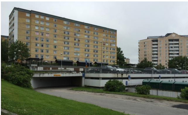
Vy mot Älta centrum och en av de parkeringsytor som planeras att bebyggas.