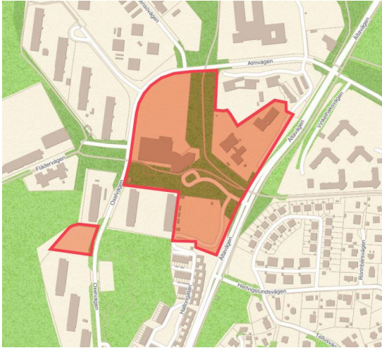
Preliminärt projektområde inom orange yta inrymmer etapp A och B.

projektområdet. Skrafferad yta väster om Oxelvägen utgör område där en ny fristående förskola skall provas.