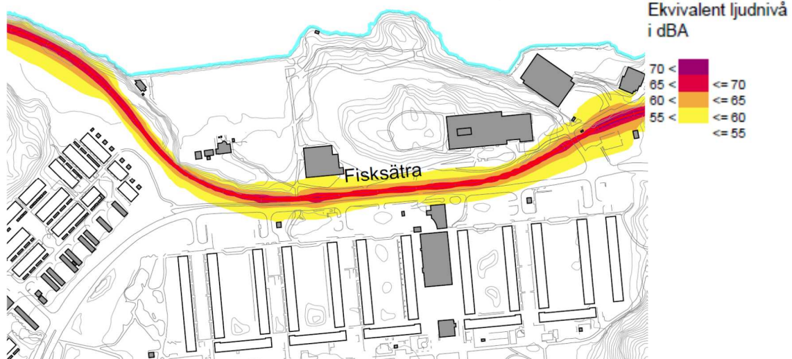
Ekvivalent ljudnivå med dubbelspår.