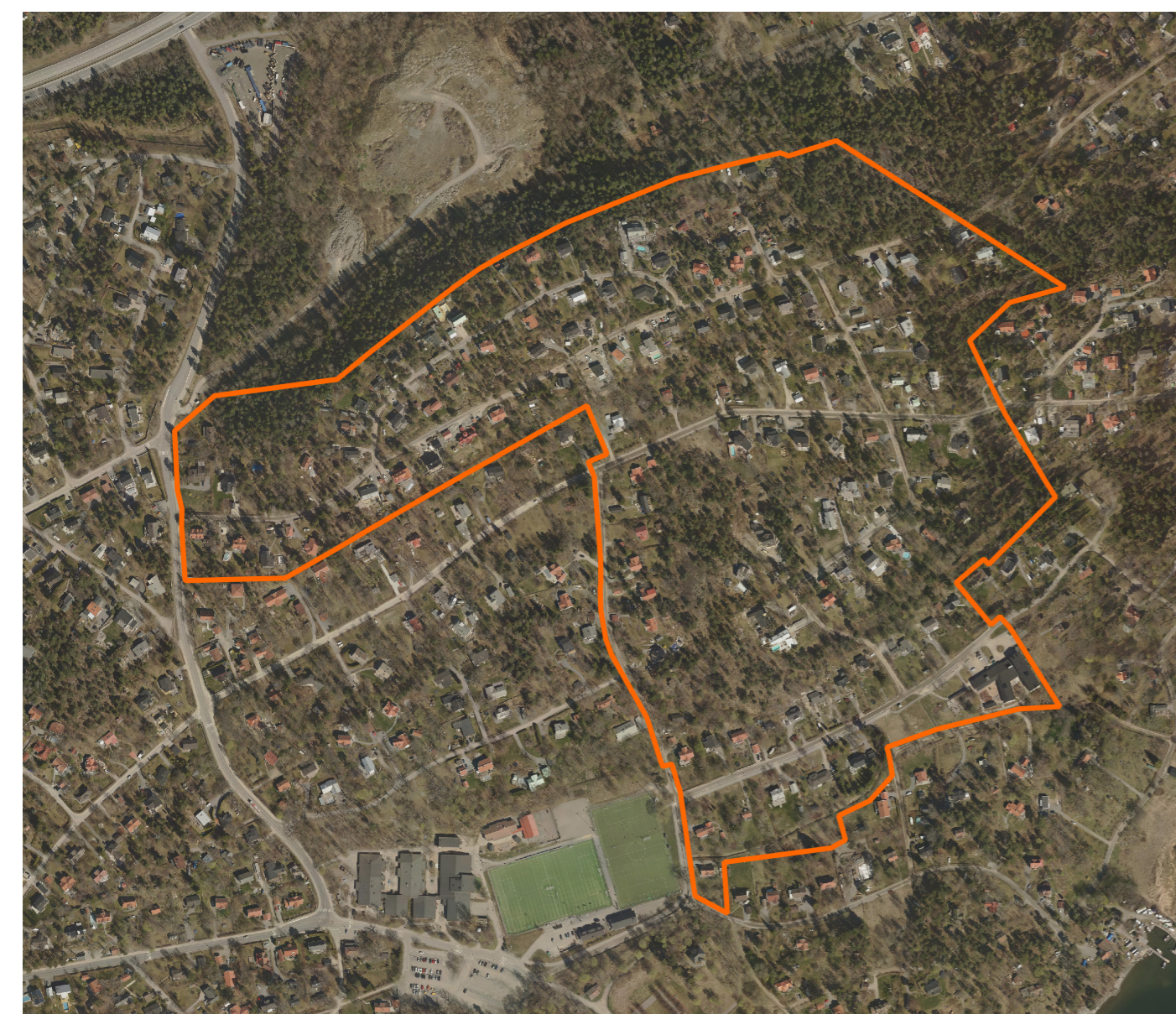
Flygfoto som visar området med plangräns.

Galärvägen-Kornettvägen är en del av planerna i Sydöstra Boo. Sydöstra Boo planerades som ett fritidshusområde. Allt fler har valt att bosätta sig permanent vilket bland annat innebär att behovet av goda kommunikationer och service ökar. Detaljplanläggning pågår i fem olika områden. Det övergripande planprogrammet, som antogs våren 2012, ligger till grund för detaljplanerna. Kommunen samordnar de olika detaljplanerna för att möjliggöra och underlätta genomförandet av utbyggnad av vägar, vatten och avlopp. Läs mer på www.nacka.se/sydostra-boo