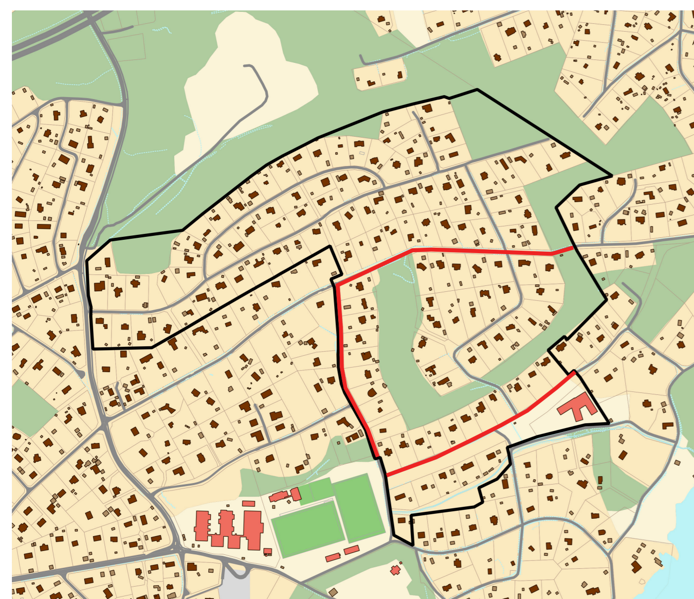
Området idag med befintliga och föreslagna gångbanor.