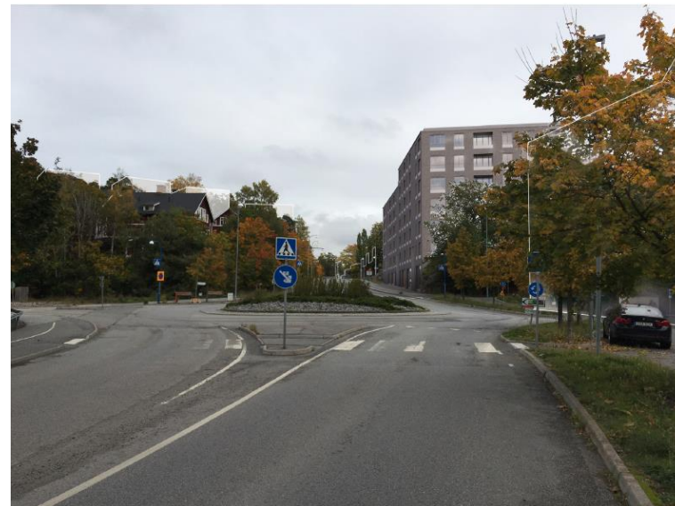
Figur 12. Vy längs Kvarnholmsvägen mot öster med bebyggelse i enlighet med planförslaget. Bebyggelsestruktur i andra pågående planer visas med vita konturer.