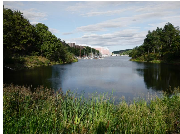
Figur 8 Vy längs med Svindersviken mot öster med bebyggelse i enlighet med planförslaget. Bebyggelsestruktur i andra pågående planer visas med vita konturer.