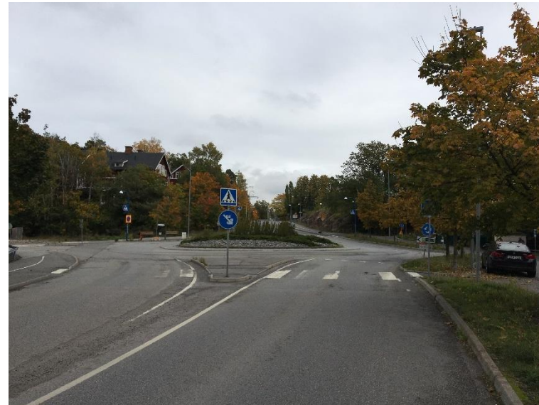
Figur 11. Vy längs Kvarnholmsvägen mot öster idag.

Planförslaget bedöms ha en måttlig negativ påverkan på uttrycken som hör samman med industrimiljön och inte innebära risk för påtaglig skada. Bedömningen är även att planförslaget inte bidrar till de kumulativa effekterna i en sådan utsträckning att den skulle hindra en framtida utveckling inom stadsbyggnadsprojekten intill.