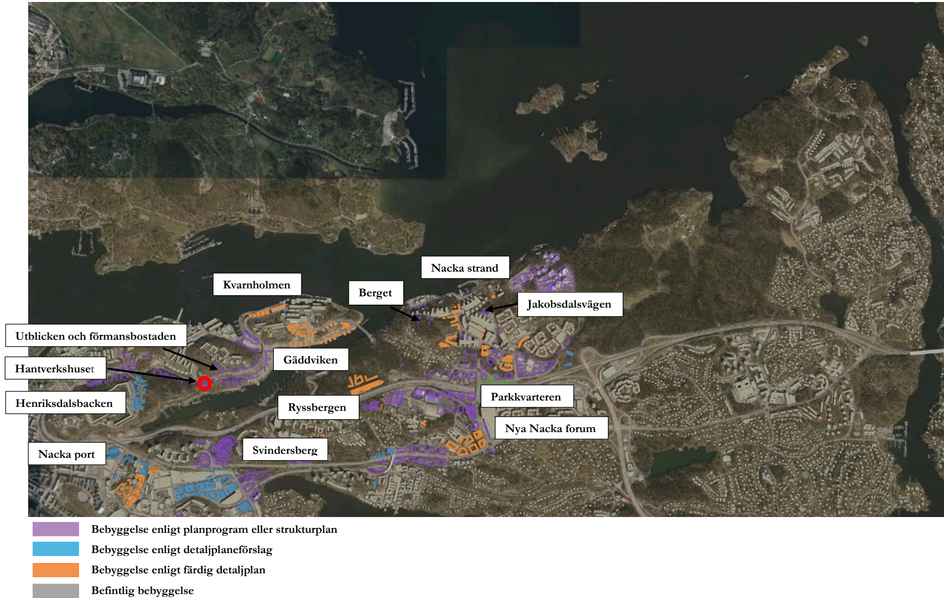
Figur 3. Utsnitt ur Cityplaner med befintlig och planerad bebyggelse. Den ungefärliga utbredningen av planområdet för Hantverkshuset markerad med en röd ring