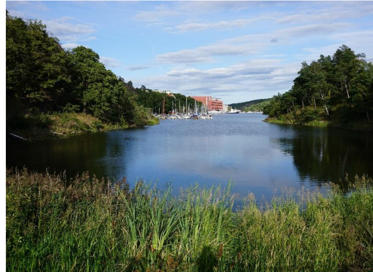
Figur 7. Vy längs med Svindersviken mot öster idag.