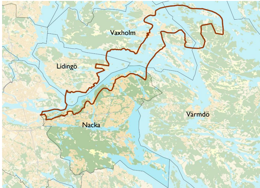
Figur 1. Översiktskarta över riksintresseområdet. Röd linje visar riksintressets avgränsning.