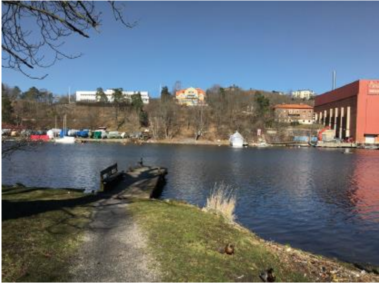
Figur 5. Vy mot planområdet från kajen vid Svindersviks gård idag.