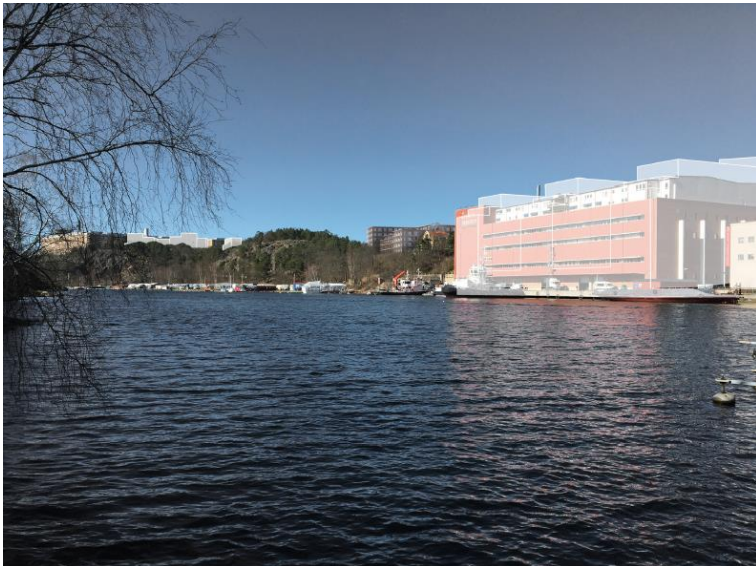
Figur 10. Vy längs med Svindersviken mot väster med bebyggelse i enlighet med planförslaget. Bebyggelsestruktur i andra pågående planer visas med vita konturer.