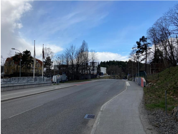
Figur 13. Vy längs med Kvarnholmsvägen mot väster idag.