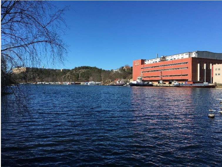
Figur 9. Vy längs med Svindersviken mot väster idag.