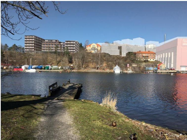
Figur 6. Vy mot planområdet med bebyggelse i enlighet med planförslaget. Bebyggelsestruktur i andra pågående planer visas med vita konturer.