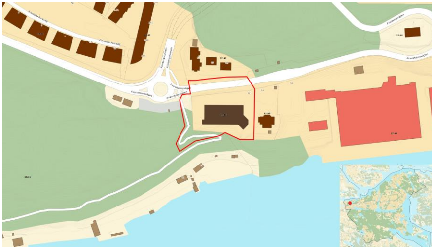
Figur 4. Planområdets avgränsning och läge i kommunen.

Samma miljötyper är värdebärande för hela riksintresseområdet mellan Danvikstull och Skurusundet. Alla detaljplaner påverkar dock inte alla miljötyper eller alla värdebärande uttryck.