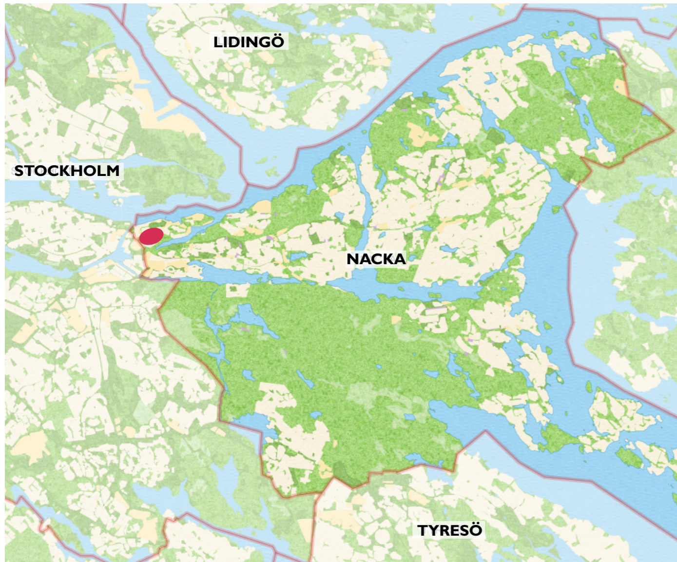
Översikt kommunen. Röd markering visar Henriksdals lokalisering.