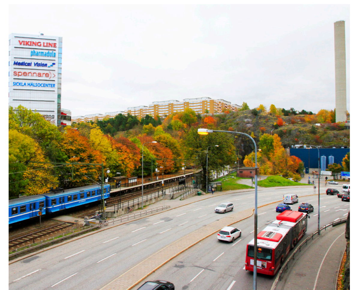
Henriksdals station, Värmdövägen, vy från nordväst.