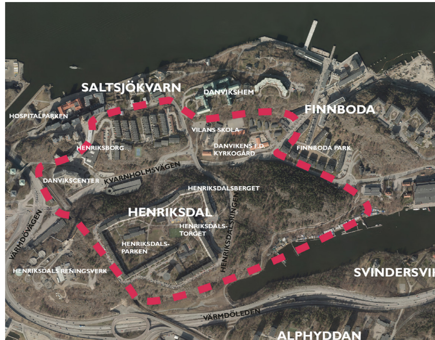
Flygfoto, programområde för Henriksdal markerat i rött.