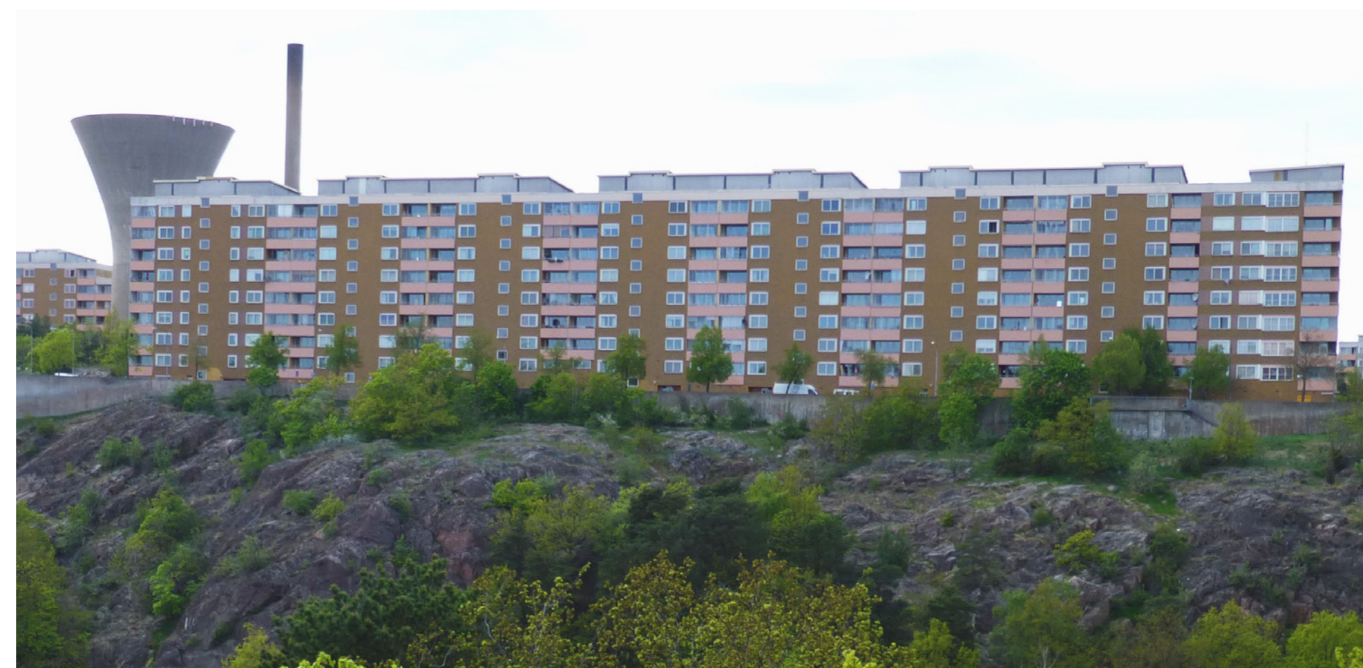
Henriksdalsberget, vy från söder.