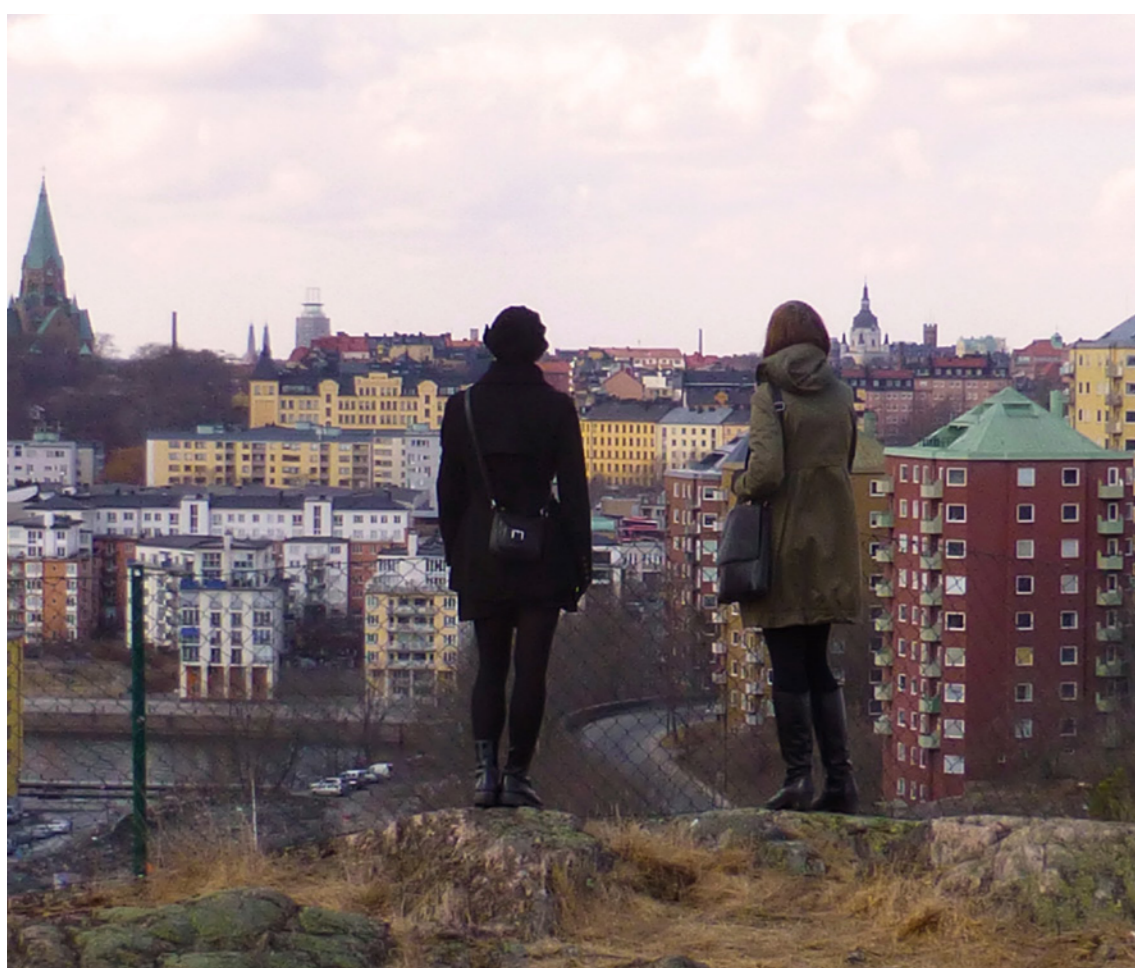
Stockholms innerstad, vy från söder uppe på Henriksdalsberget.