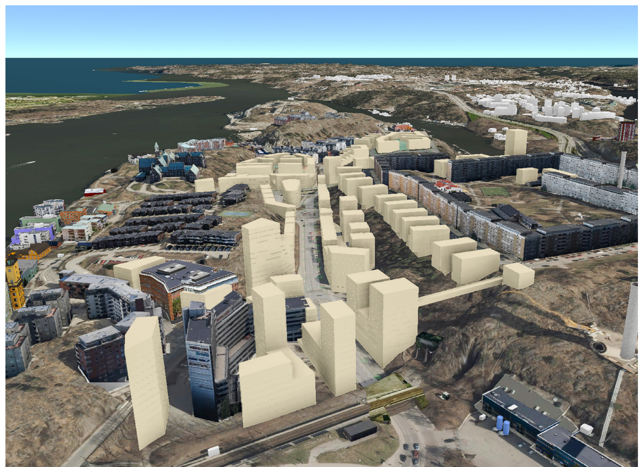
Illustration ur 3D-modellen. Förslag till ny bebyggelse i vitt.