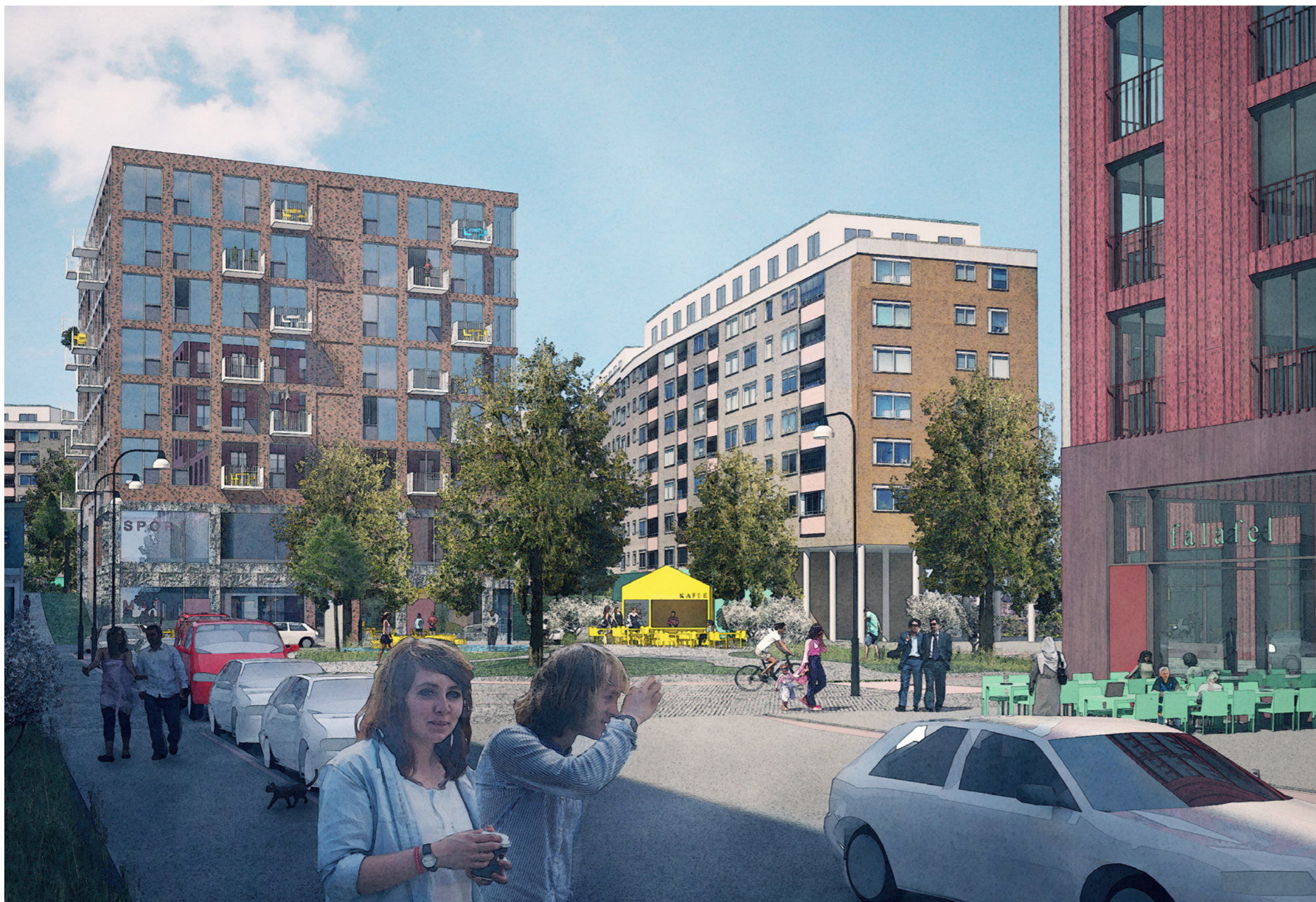
Henriksdalstorget, en ny mötesplats i Henriksdal, vy från söder.