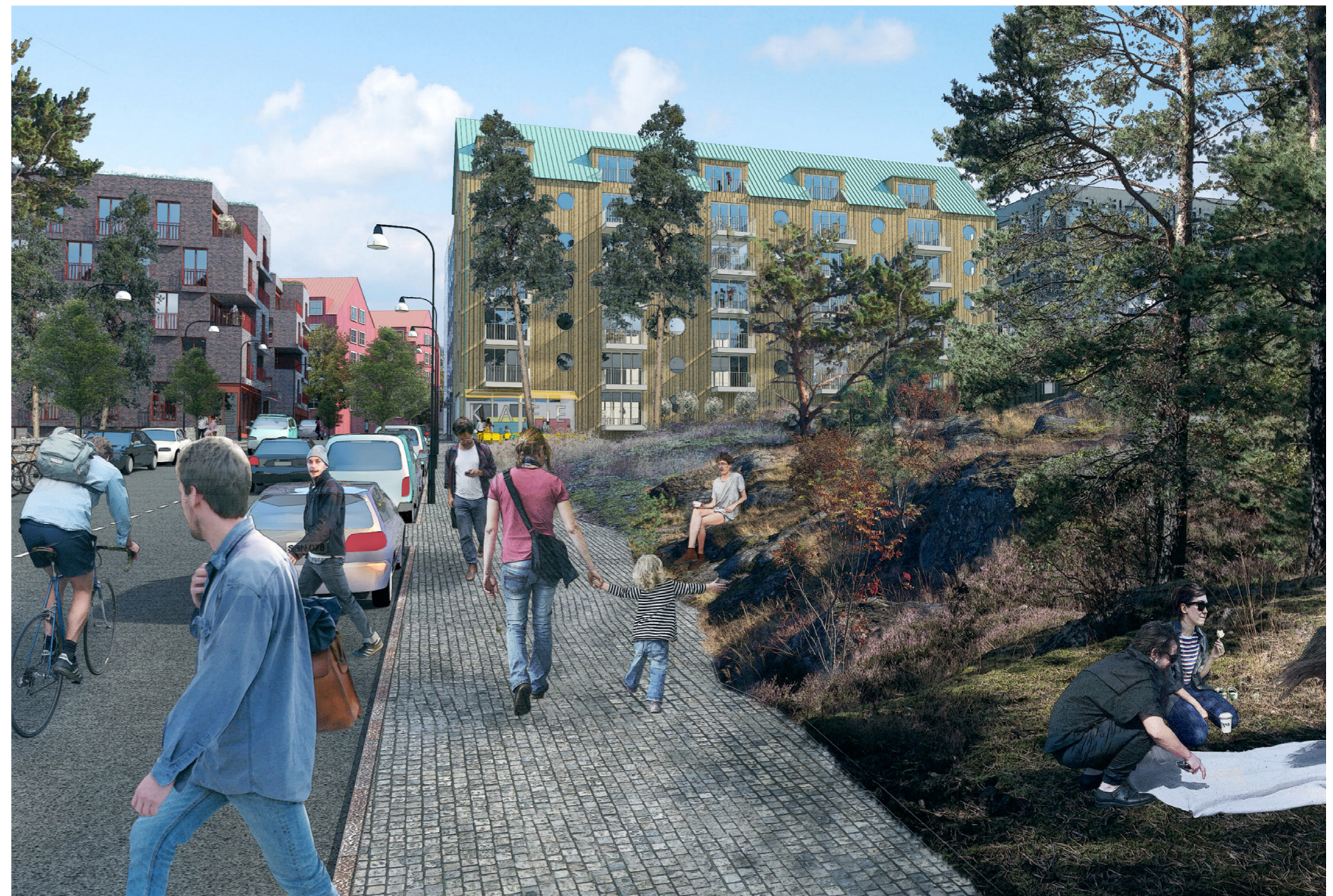
Tillkommande bebyggelse öster om Danvikens före detta kyrkogård, vy från sydost.