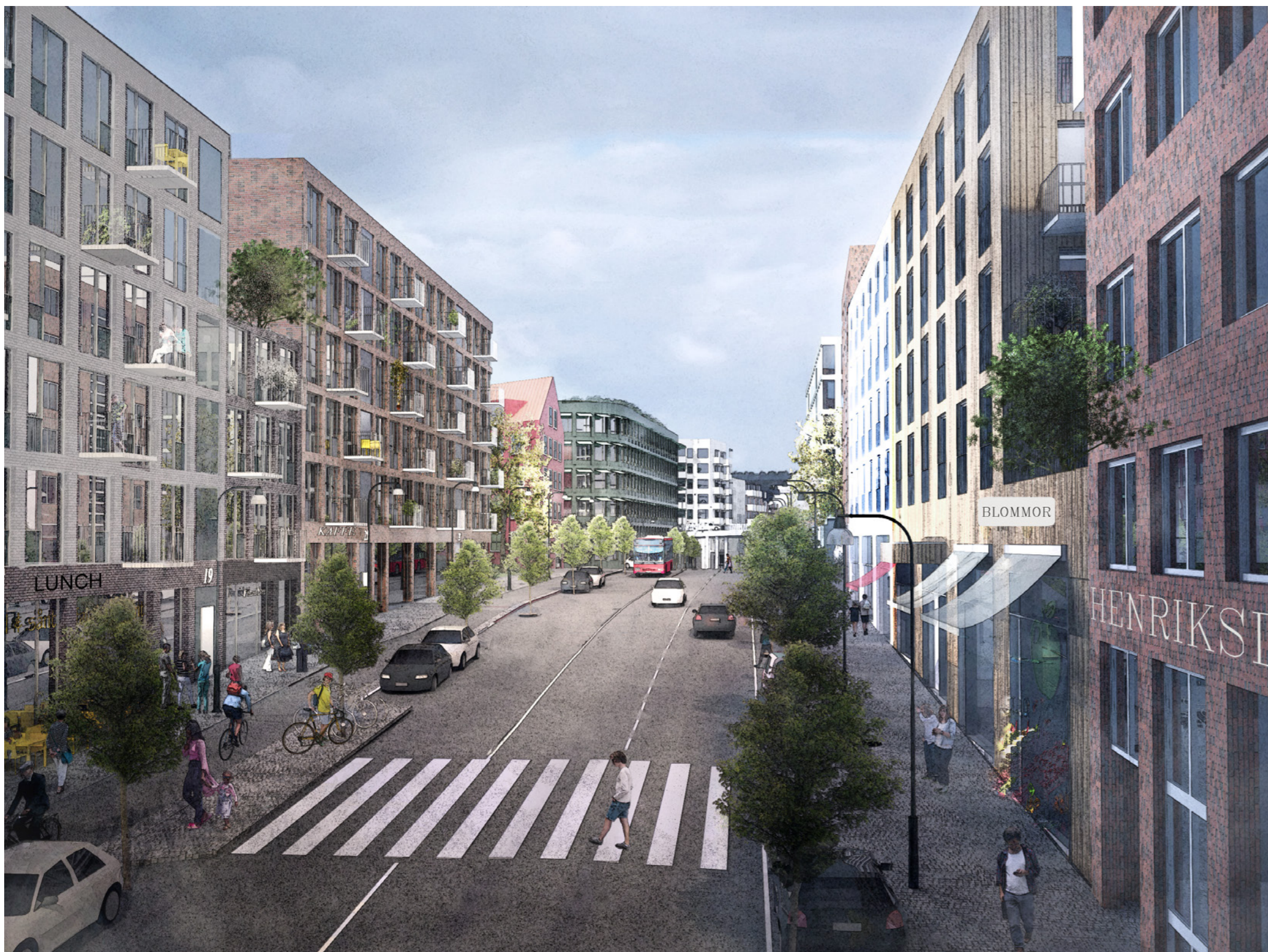
Karta över programförslaget illustrerar föreslagen markanvändning.

Programmet anger kommunens viljeinriktning för utveckling av området och föreslår ny bebyggelse som inrymmer bostäder, skolor, förskolor, handel, kontor, fritid och kultur. En förtätad stadsdel med blandade funktioner och bättre samband skapar förutsättningar för en stadsdel som i högre utsträckning är befolkad dygnet runt. Ett utvecklat innehåll med fler målpunkter och en medveten gestaltning skapar förutsättningar för trivsel och för att attrahera fler besökare. Förnyelse som bygger vidare på områdets karaktär och lyfter fram befintliga värden skapar förutsättningar för kompletteringar som bildar nya årsringar med förstärkt identitet. Planprogrammet ska vara vägledande inför bebyggelseutveckling i kommande detaljplaneetapper. Kommunens bedömning är att programförslaget inte innebär en betydande miljöpåverkan.