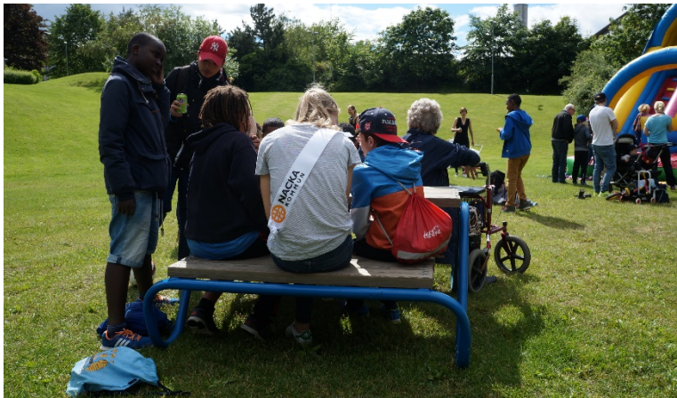
Engagerade ungdomar fyller i enkät