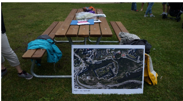
Kartor som användes under dialogprojektet