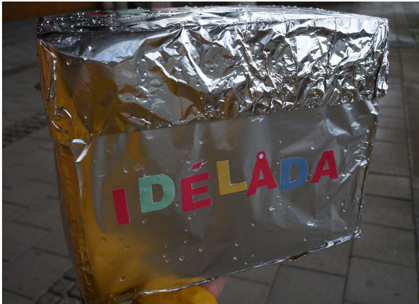
Idélåda som barnen kunde lägga sina idéer i