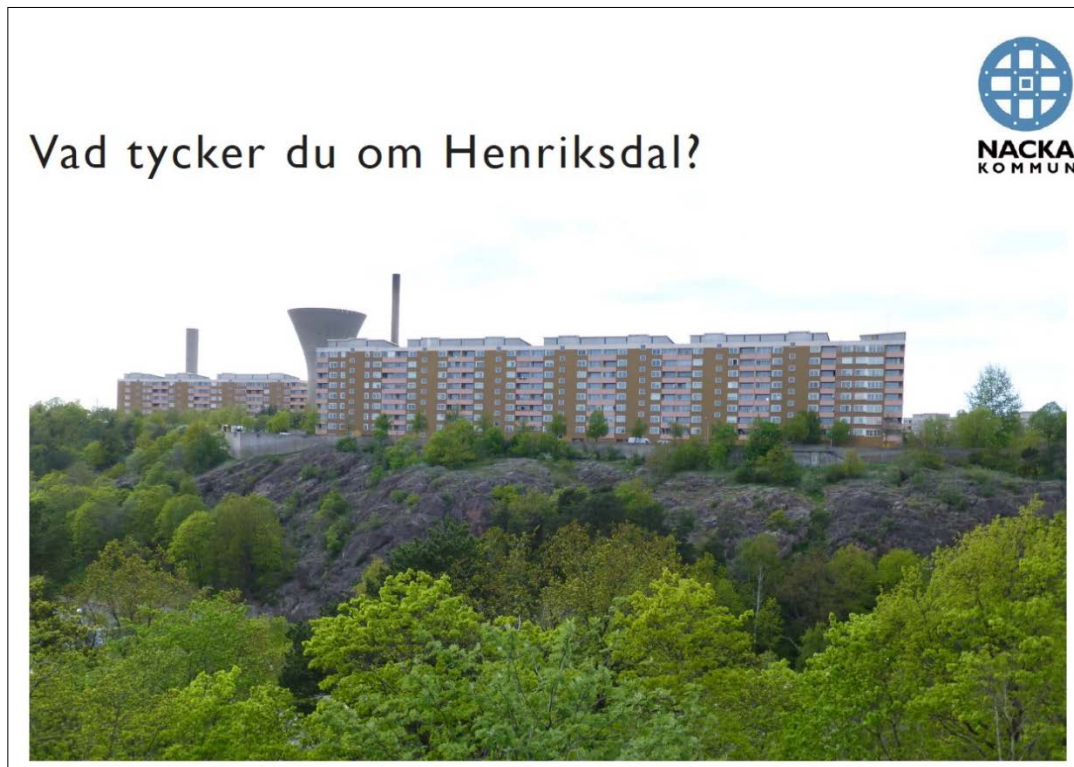
Framsidan på enkäten