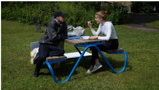
Dialog mellan kommunen och boende i området