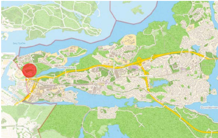
Röd markering visar Glada Henkans placering i förhållande till Sickla ön som visas i kartan