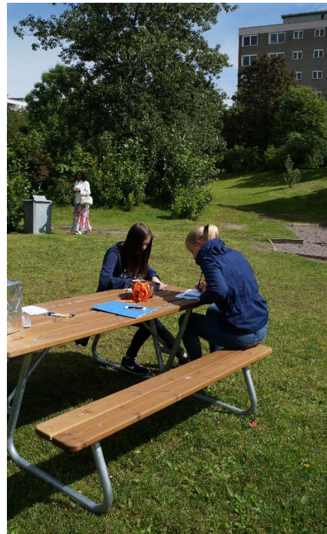
Besökare till karnevalen svarar på enkät