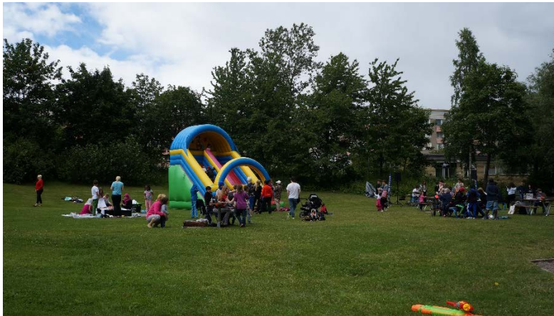
Hoppborg på karnevalområdet