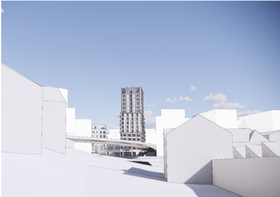
Högdelen sedd från Järsla sjö bostadsområde. Bild: Semrén Månsson, 2021

förmiddagen vår, höst och vinter. Delar av fastigheten Sicklaön 137:14 skuggas mitt på dagen vår, höst och vinter. Fastigheten Sicklaön 137:13 skuggas inte nämnvärt av högdelen.