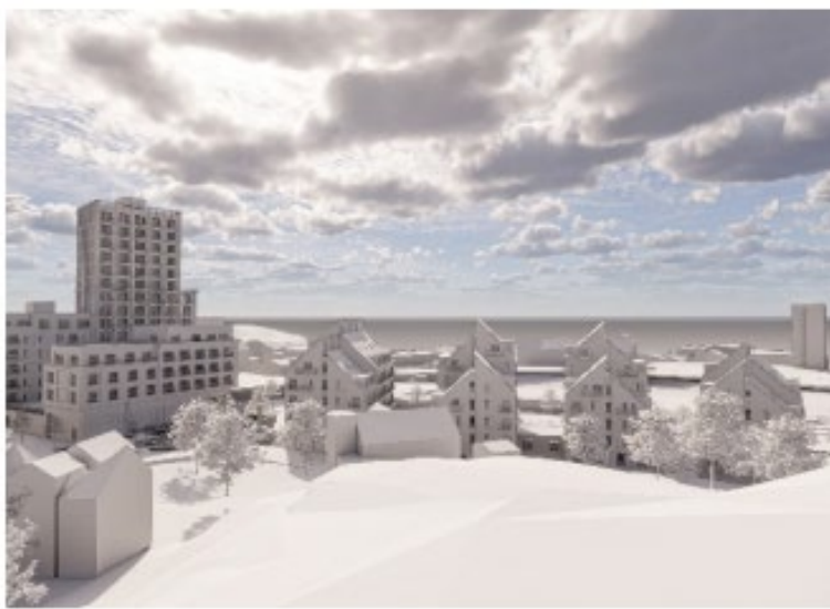
Utsikten från Birkaberget över Järlasjön och Nackareservatet vid genomfört planförslag. Utsikten över Järlasjön blir förändrad men sjön är fortfarande synlig. Bild: Semrén & Månsson

Planförslaget innebär en negativ påverkan på möjligheten att avläsa områdets topografiska variationer samt en skalförskjutning i förhållande till den befintliga småskaliga bebyggelsen i Birkaområdet, detta gäller framförallt mot Kyrkstigen. Dock innebär den uppbrutna strukturen i det aktuella förslaget att topografin och områdets siluett synliggörs i öppningar mot Värmdövägen och fortfarande kommer att vara avläsbar söderifrån, även om den till viss del skymms. Bland de närboende är Birkabergets södervända slänt en omtyckt utsiktsplats över Järlasjön. Bergets höjd är +51 meter över havet. Det västra kvarteret kommer ha taknockshöjder på +51 vilket precis motsvarar höjden på berget. Det östra kvarterets högsta höjd har angivits till +81. Det västra kvarterets gårdar liksom det övre torget ligger på omkring +26 och +27 respektive +28 vilket är väl under bergets höjd. Tack vare dessa släpp i bebyggelsen kommer utsikt ut över Järlasjön från Birkaberget fortfarande kunna upplevas genom de uppbrutna volymerna. Den föreslagna bebyggelsen innebär ingen påtaglig skugga på utsiktsplatsen under de tider den förmodas användas som mest det vill säga under vår, sommar och höst. Planenheten bedömer att påverkan på utsiktsplatsen inte blir större än vad som kan anses rimligt i ett centralt läge. Påverkan minskas genom att utblickar söderut bevaras genom öppningarna mellan de föreslagna volymerna.