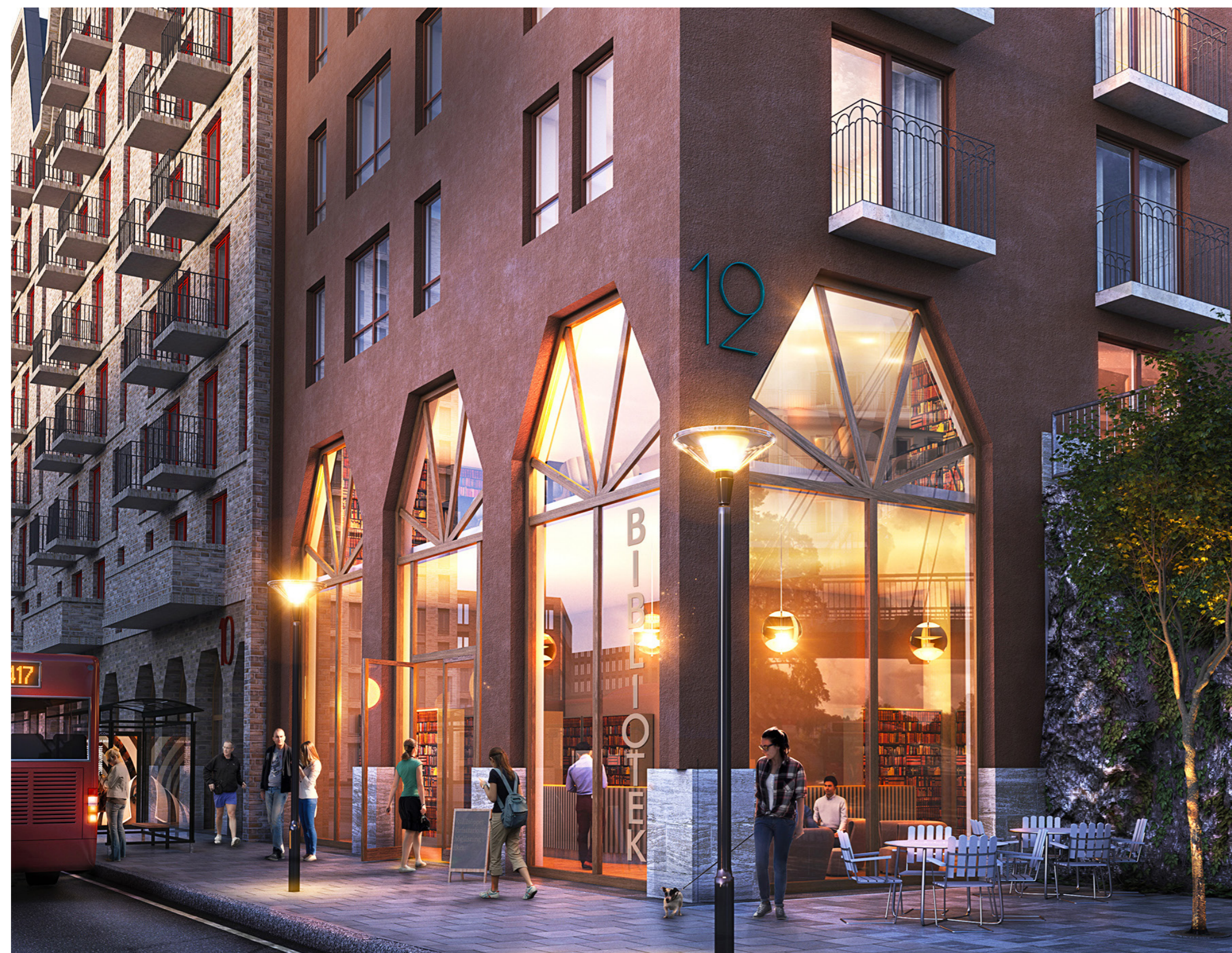
Exempel på hur bottenvåning kan utformas, kvarter Hantverkshuset, vy från Kanholmsvägen.