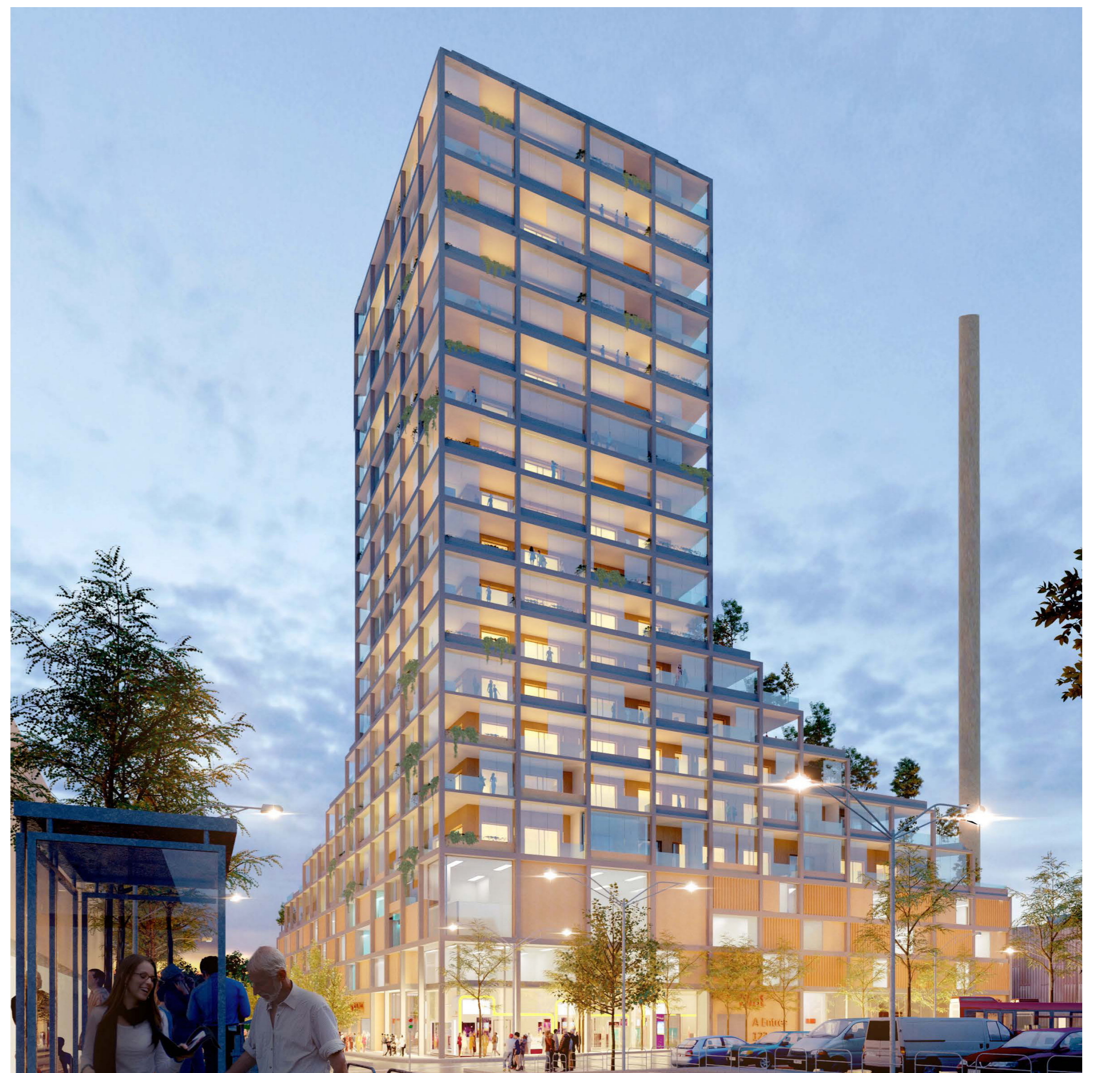
Exempel på hur byggnad kan utformas och gestaltas, kvarter Parkeringshuset med handel och bostäder, vy från nordöst vid Kanholmsvägen.