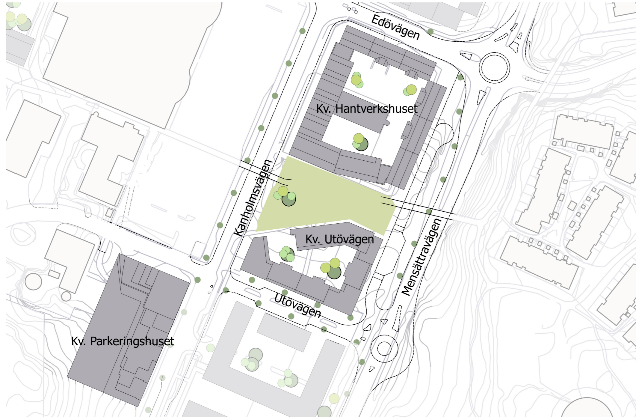
Övergripande illustrationsplan för planområdet. Nya byggnader i mörkgrått, nytt vägnät i svart. Ljusnä bebyggelse illustrerar bebyggelse utanför planområdet som planeras i enlighet med planprogram för Orminge centrum.

I ett av de nya bostadskvarteren planeras en yteffektiv infartsparkering för 400 parkeringsplatser.