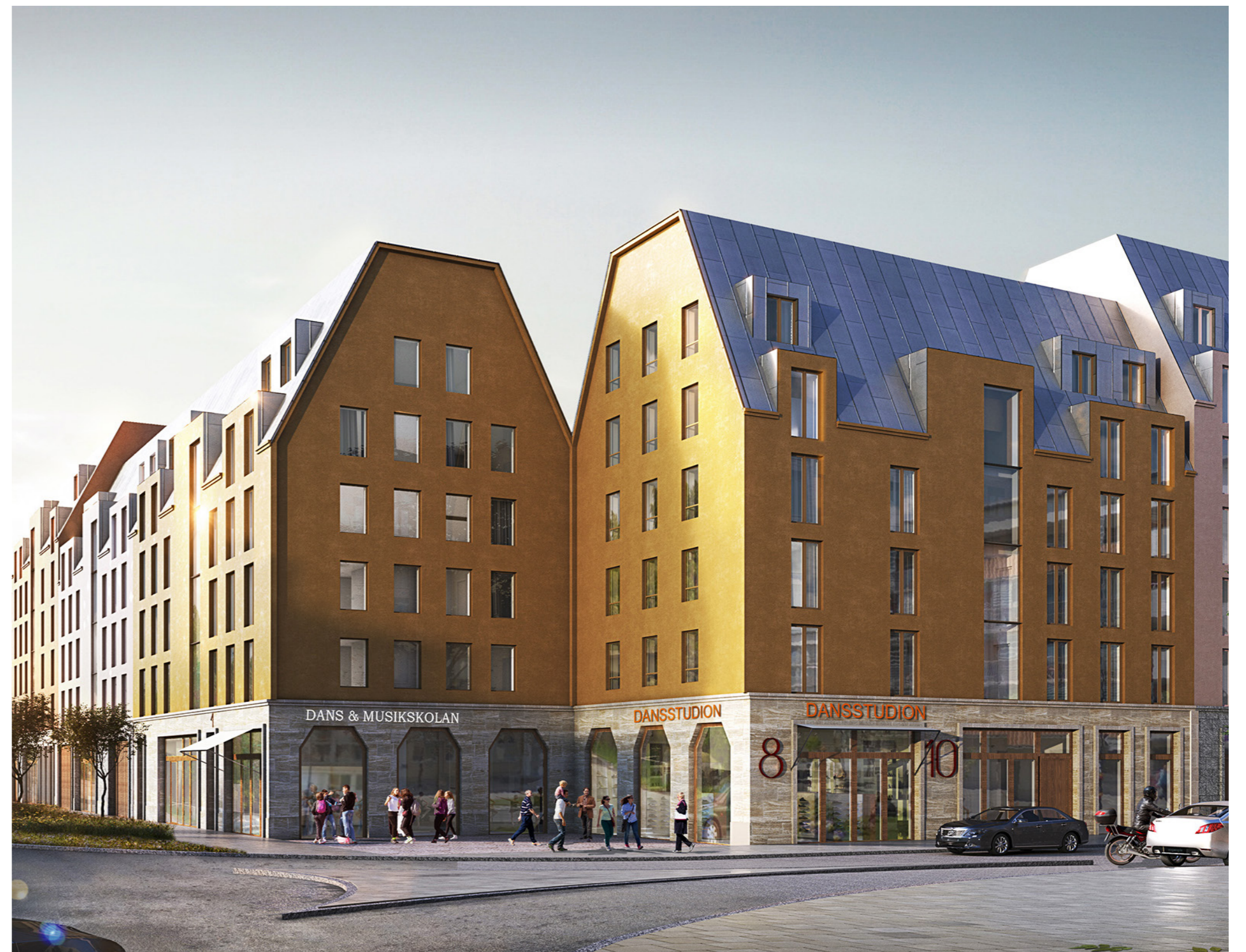
Exempel på hur byggnad kan utformas, kvarter Hantverkshuset, vy från nordöst.