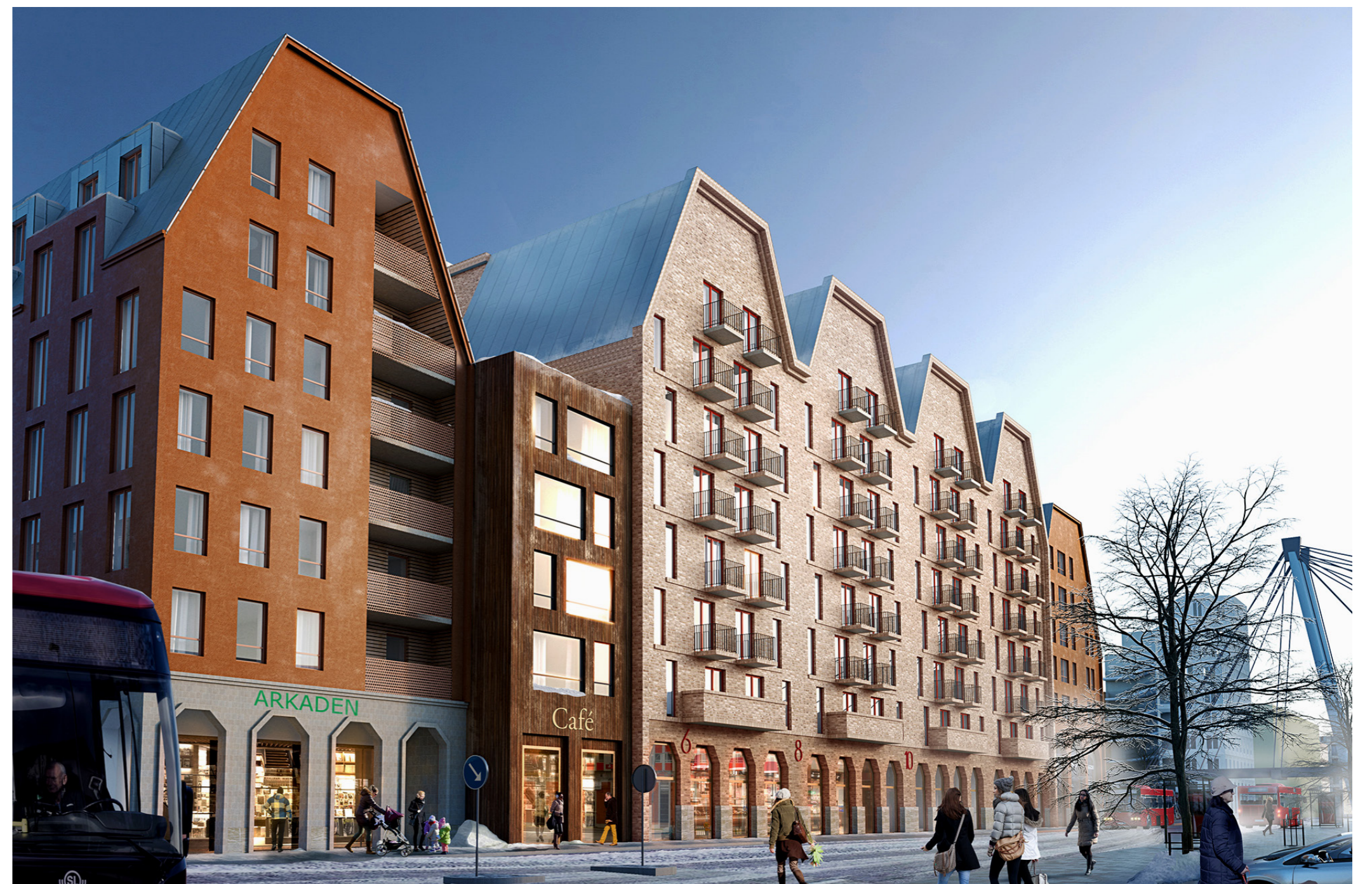
Exempel på hur byggnad kan utformas, kvarter Hantverkshuset, vy från nordväst.