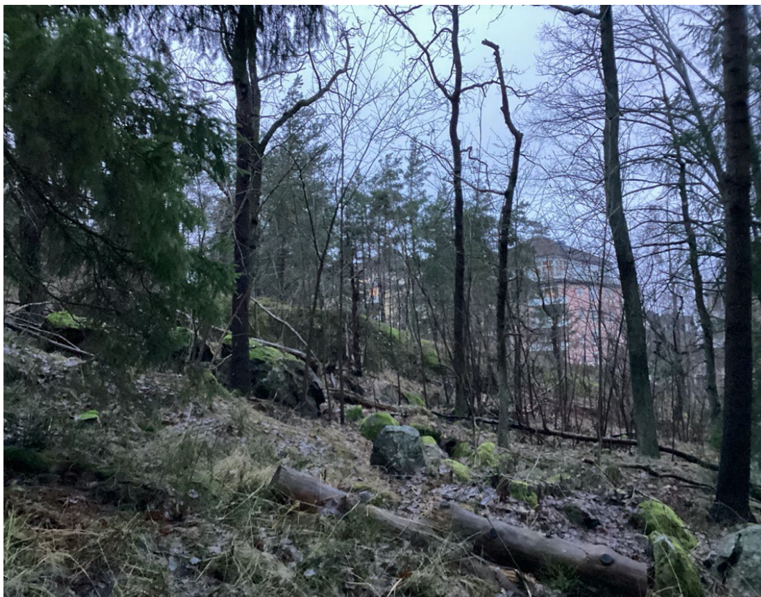
Figur 2. Blandskogen med stort lövinslag och förekomst av död ved nedanför branten i detaljplaneområdet.

Revirkarteringen har viss grad av osäkerhet, särskilt vad gäller geografisk avgränsning av fortplantningsområden/revir. Ju färre observationer som revirkarteringen bygger på desto större osäkerhet finns vad gäller den geografiska avgränsningen av fortplantningsområdet/reviret. För arter med stora revir som exempelvis många hackspettar kan det trots flera observationer ibland vara svårt att exakt avgränsa reviret. För vissa arter saknas också information om storlek på artens revir varför det är svårt att avgränsa reviren. Det finns i flera fall en viss osäkerhet avseende fynd från databasen Artportalen eftersom de ofta har en låg lägesnoggrannhet. Det kan leda till att arter som är registrerade utanför inventeringsområdet ändå hör hemma där. Vi bedömer dock att inventeringen har så god säkerhet att kunskapskravet i miljöbalken uppfylls.