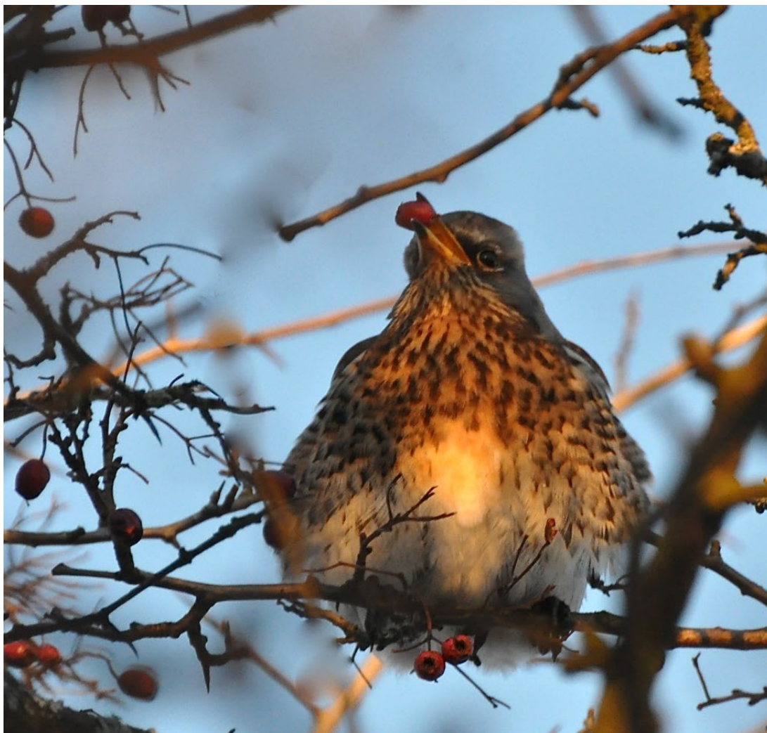
Figur 5. Björkrast, rödlistad i kategori NT-nära hotad. Totalt två par bedömdes häcka i detaljplaneområdet.