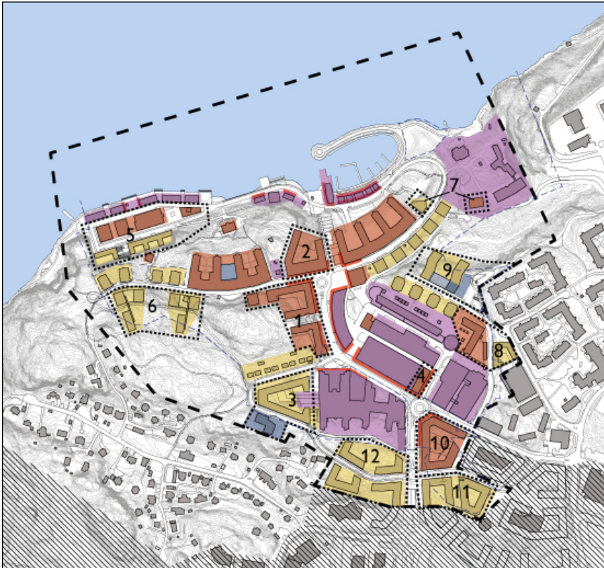
Bebyggelsekarta för hela Nacka strand från detaljplaneprogrammet, siffrorna anger delområden för bebyggelse. Delområde 8 och 9 finns i den östra delen närmast Jarlaberg.