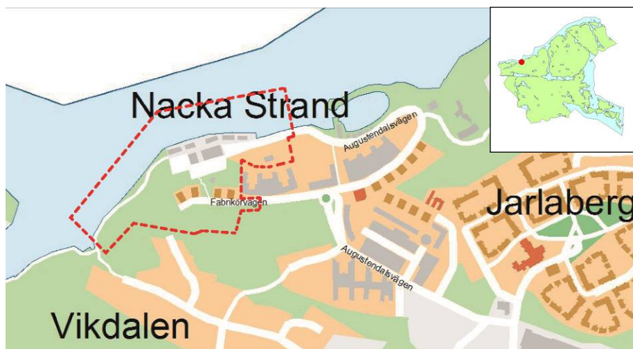
Projektområdets preliminära avgränsning samt läge i kommunen.