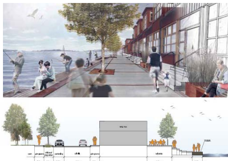
Programkarta för offentliga rum samt illustrationer av kajplanet.