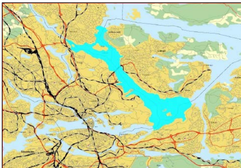
Vattenförekomsten Lilla Värtan

Den ekologiska potentialen är måttlig och den kemiska statusen till uppnår ej god kemisk ytvattenstatus .