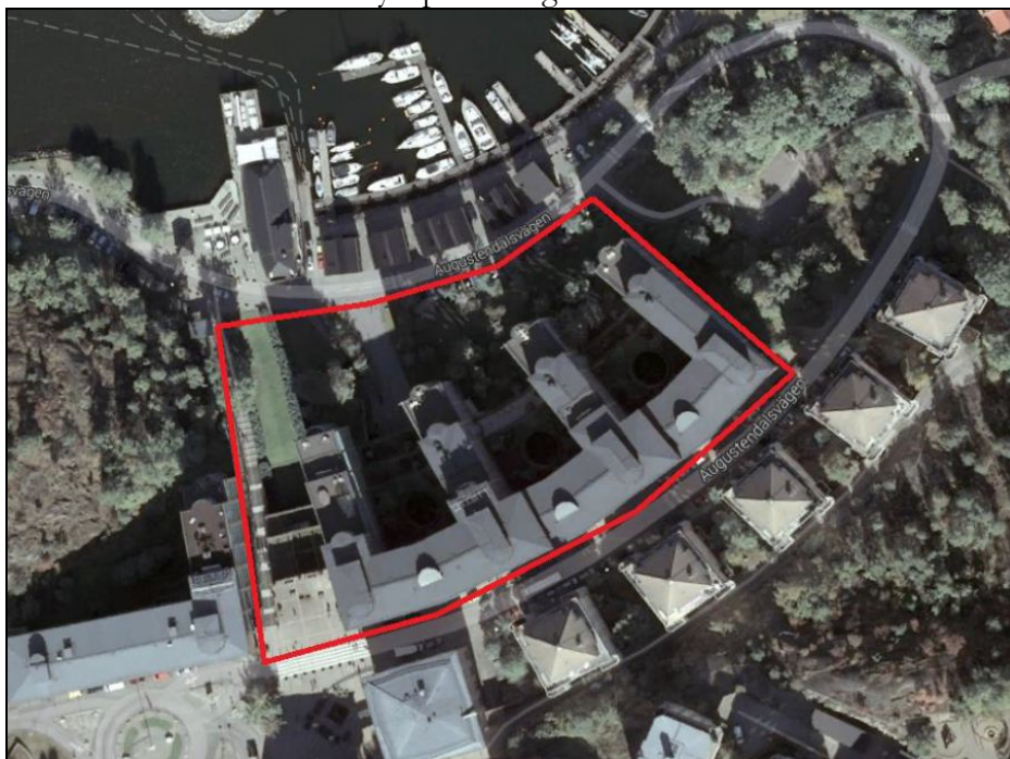
Tolkad detaljplanegräns (Översiktlig dagvattenutredning för hus 13, Sweco 2014-06-04)

I dagsläget avvattnas hela området utan rening direkt ut i Saltsjön. Planförslaget innebär att kontorshus förändras till bostadshus. Andelen hårdgjord yta inom området förblir dock densamma före som efter nyexploateringen.