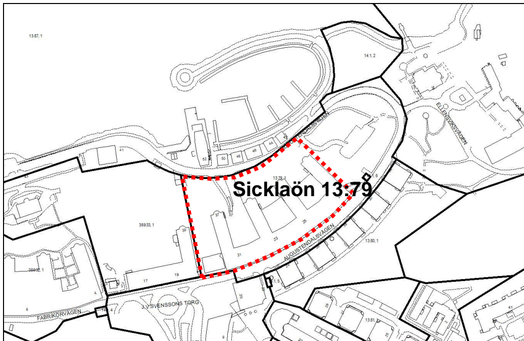
Preliminär avgränsning för detaljplan för Sicklaön 13:79, de svarta linjerna visar gällande fastighetsgränser