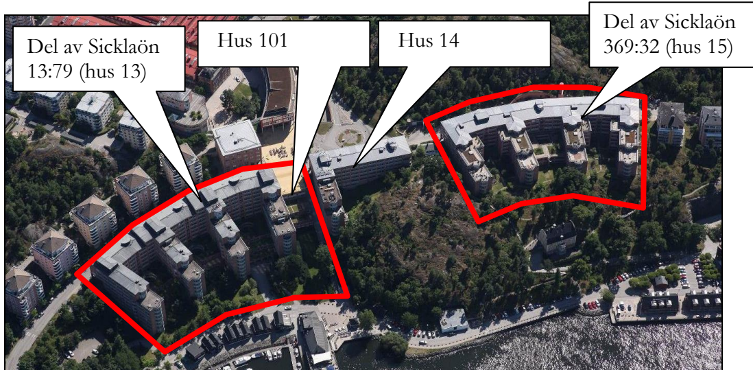
De röda linjerna visar ungefärlig avgränsning av projektområdet