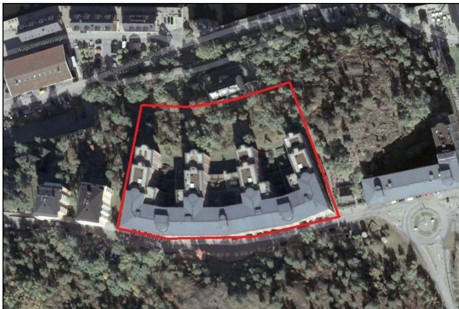
Tolkad detaljplanegräns (Översiktlig dagvattenutredning för hus 13, Sweco 2014-06-04)

Planområdet är till stor del bebyggt med det som idag är en stor kontorsbyggnad. I och med denna detaljplan tillåts bostäder där det tidigare inte funnits planstöd för detta. Planområdet ligger relativt långt från större vägar varför föroreningsbelastningen på hustaket främst har sitt ursprung i atmosfärisk deposition vilket utgör låga föroreningshalter. Enligt kommunens dagvattenstrategi kan rent dagvatten avledas direkt till recipienten. Då plangränsen går i husliv utanför hus 15 görs bedömningen enligt Sweco ( Översiktlig dagvattenutredning för hus 15, Sweco 2014-06-04 ) att dagvattnet kan ledas till Saltsjön via befintliga ledningsnät utan föregående rening. Planen genomförande innebär därmed endast marginella förändringar på dagvattensammansättningen.