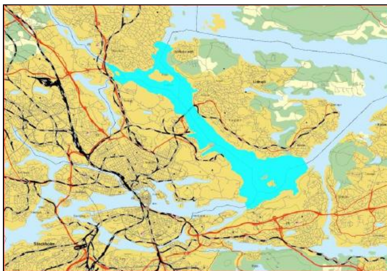
Vattenförekomsten Lilla Värtan

Den ekologiska potentialen är måttlig och den kemiska statusen till uppnår ej god kemisk ytvattenstatus .