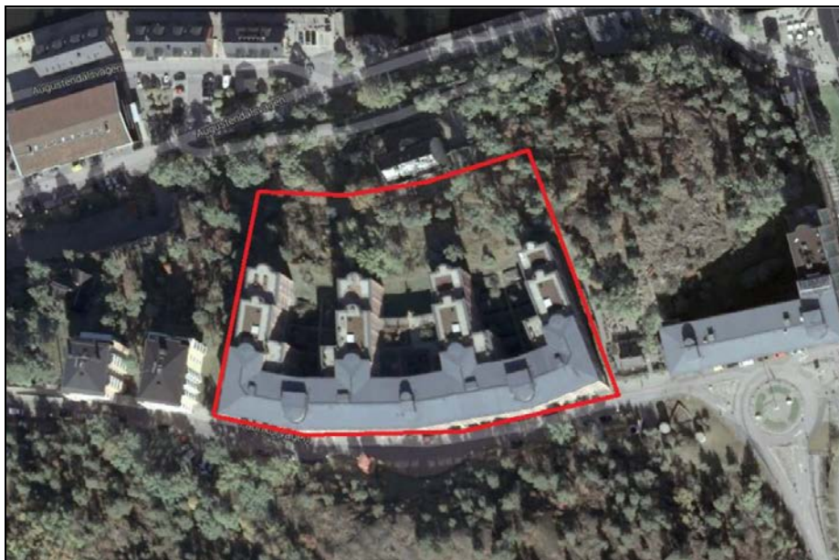
Tolkad detaljplanegräns (Översiktlig dagvattenutredning för hus 13, Sweco 2014-06-04)

Planområdet är till stor del bebyggt med det som idag är en stor kontorsbyggnad. I och med denna detaljplan tillåts bostäder där det tidigare inte funnits planstöd för detta. Planområdet ligger relativt långt från större vägar varför föroreningsbelastningen på hustaket främst har sitt ursprung i atmosfärisk deposition vilket utgör låga föroreningshalter. Enligt kommunens dagvattenstrategi kan rent dagvatten avledas direkt till recipienten. Då plangränsen går i husliv utanför hus 15 görs bedömningen enligt Sweco ( Översiktlig dagvattenutredning för hus 15, Sweco 2014-06-04 ) att dagvattnet kan ledas till Saltsjön via befintliga ledningsnät utan föregående rening. Planen genomförande innebär därmed endast marginella förändringar på dagvattensammansättningen.