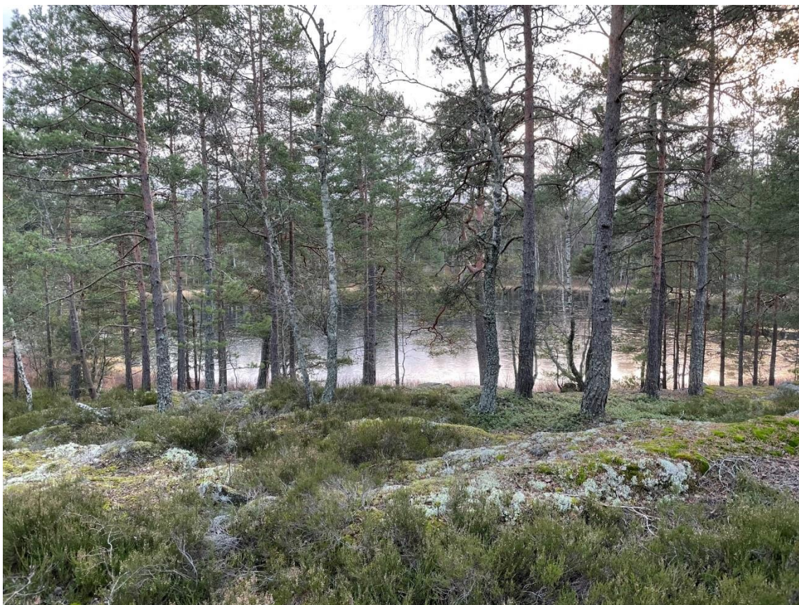
Bild 1. Hällmarker vid Krokträskan

På sluttningar och i dalar finns såväl äldre blandskog med inslag av ek, lind och andra lövträd, som lövriska bryn och sumpskogar. I buskskiktet finner man hasselbuketter och skogsolvon. Danmarks ängar slås varje år. Där finns även noteringar om förekomst av smalvingad blomböck, en rödlistad skalbagge som är beroende av fuktig ängsmark. 2008 brann ett område mellan Krokträskan och Danmarks ängar. Det har gjort området till en värdefull miljö för arter som bara lever i bränd och död ved eller blottad jord eller sand.