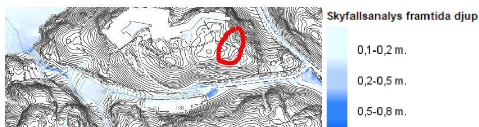
Figur 3 Skyfallsanalys, framtida djup. Röd markering är ungefärligt läge för Norges hus

Ytan där byggnaden planeras är inte utsatt för översvämningsrisk, Hamndalsvägen är sannolikt ett naturligt stråk för dagvatten om stora nederbörds mängder kommer och om diken utmed vägen inte räcker till. Det är viktigt att det i och med den nya byggnaden anläggs tillräckliga fördröjningsmagasin som klarar den normala nederbördssituationen. Dagvattnet får inte bli en störningskälla utanför fastigheten.