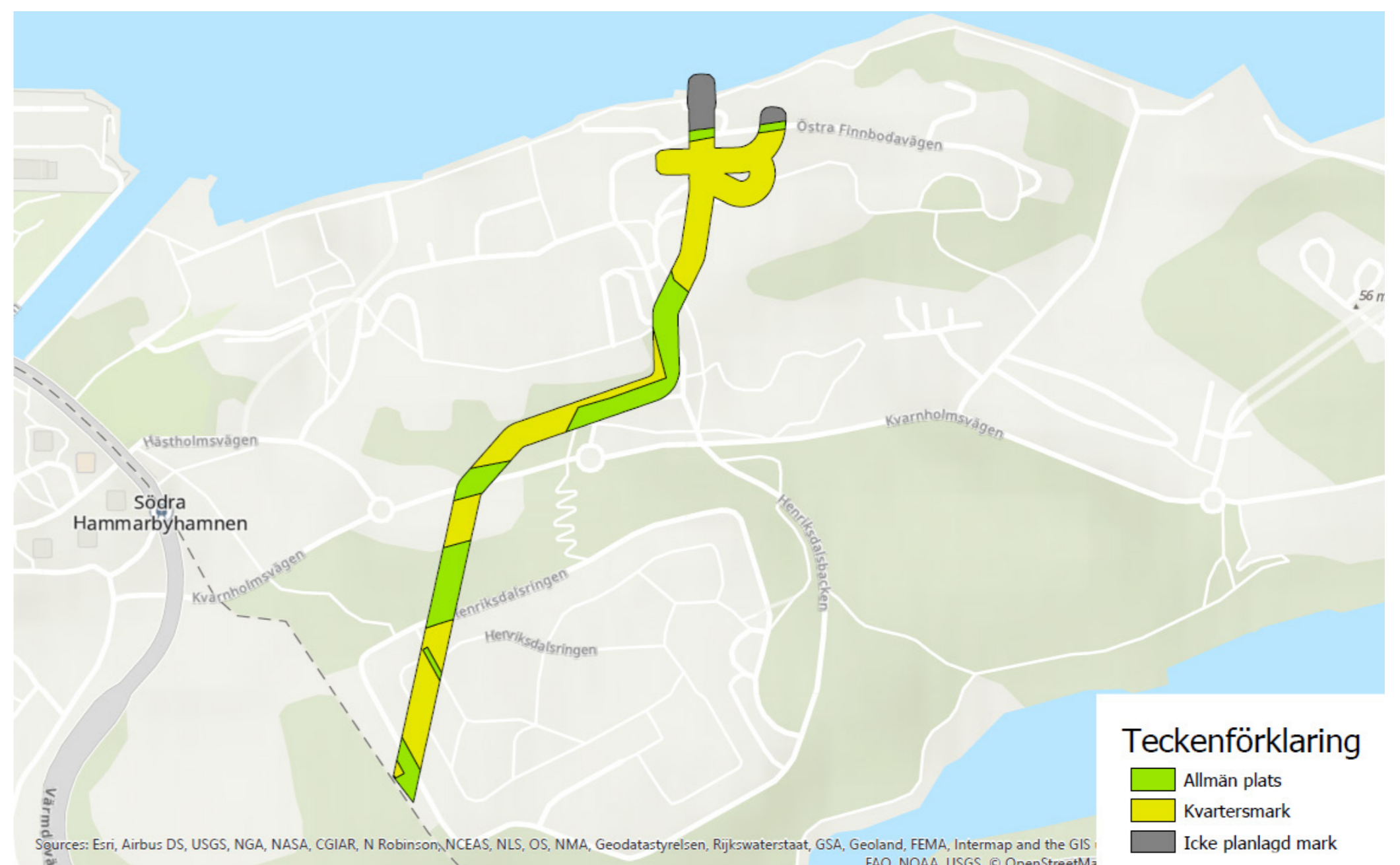
Dagvattentunnelns sträckning inom Nacka kommun, kartbild från Stockholm Vatten och Avfall AB. I gällande planer är gula områden kvartersmark och gröna är allmän plats. Grå områden är inte planlagda.

Kartbilden nedan visar tunnelns sträckning i Nacka. Gula områden är kvartersmark och gröna är allmän plats. Grå områden är inte planlagda. Bild från Svefa AB.