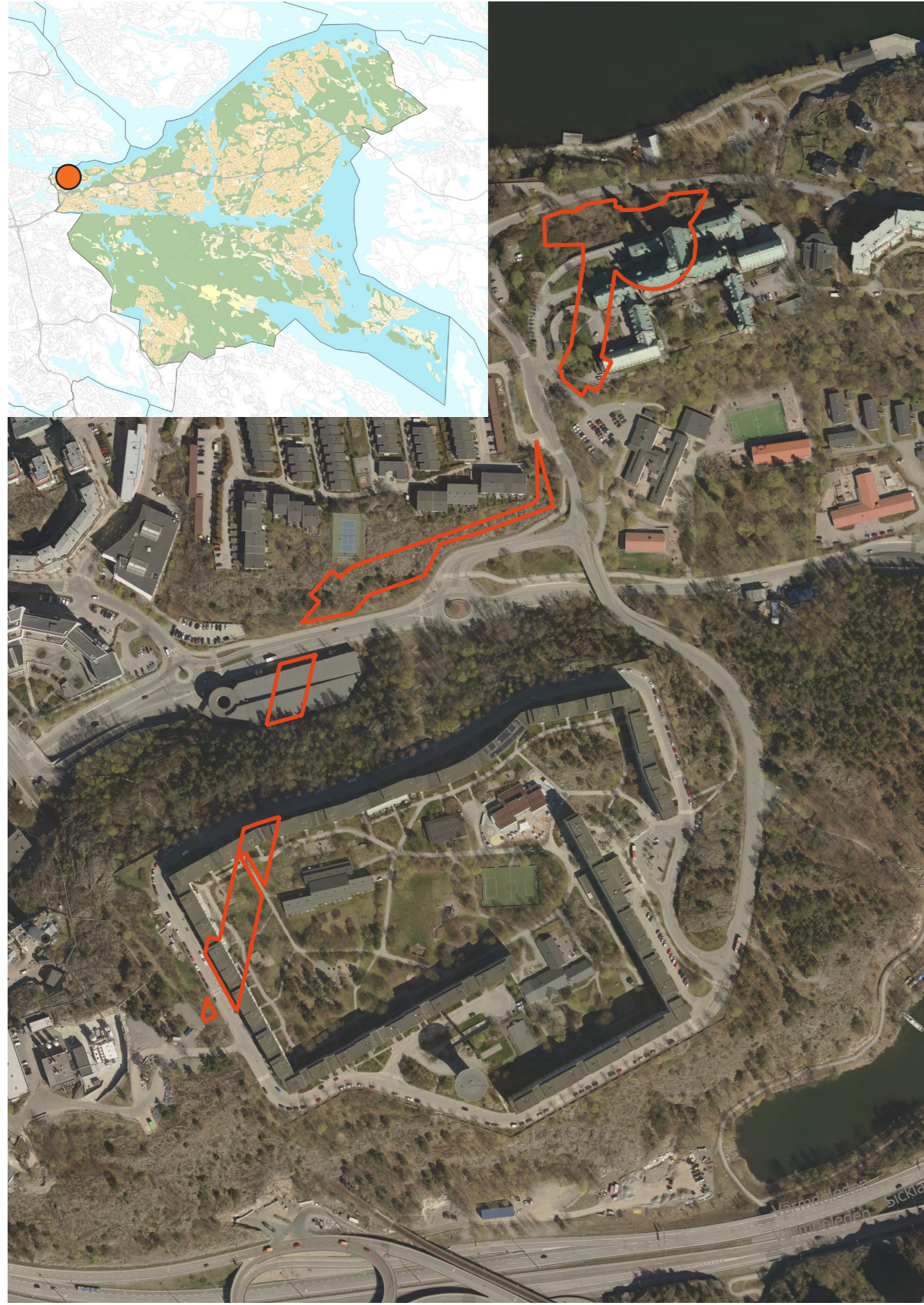
Planområdets läge i Nacka kommun samt planområdets utformning