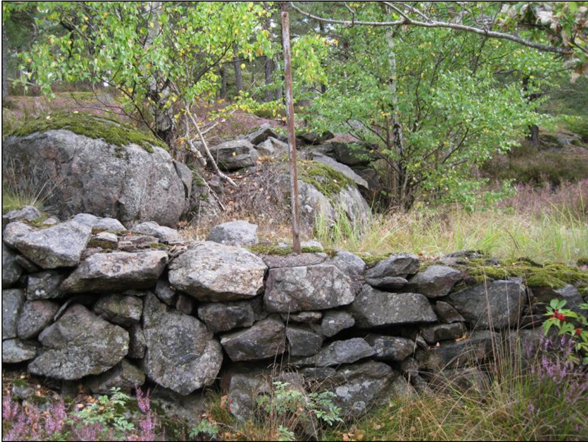
Stenmuren (Boo 120) med stenugnen (Boo 121) i bakgrunden.