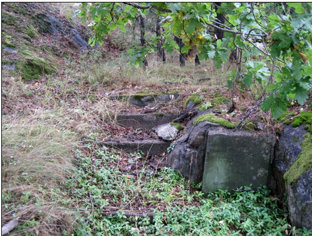
Trappa i f.d. trädgård.