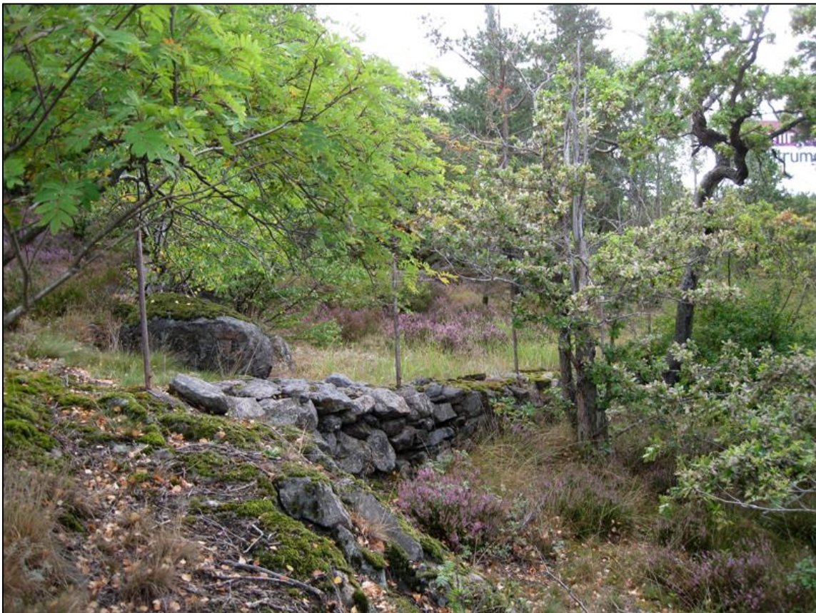
Stenmuren Boo 120