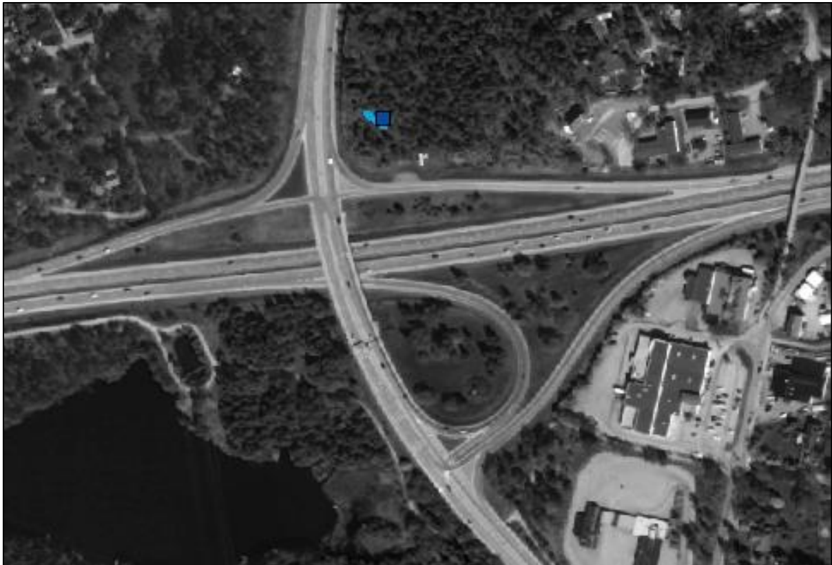
Blå kvadraten, stenugnen Boo 121, turkosa sträcket, stenvuren Boo 120.