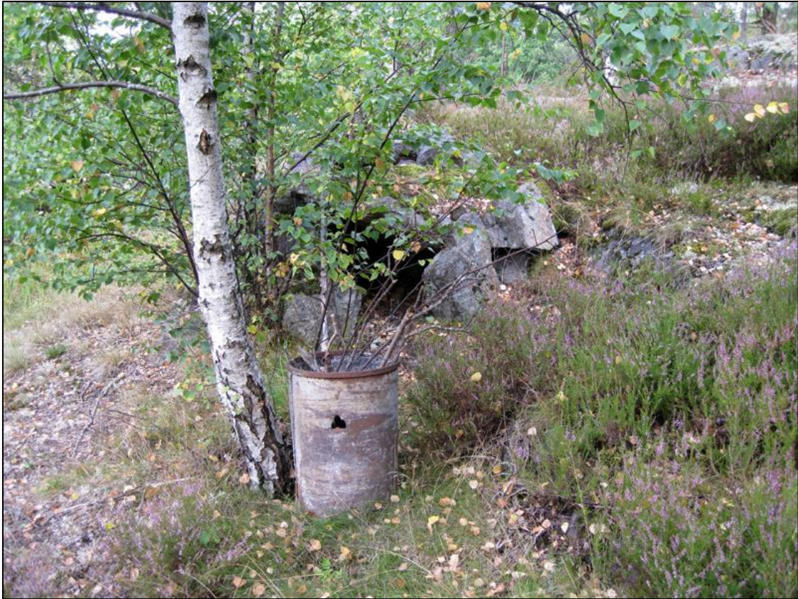
Stenugnen Boo 121