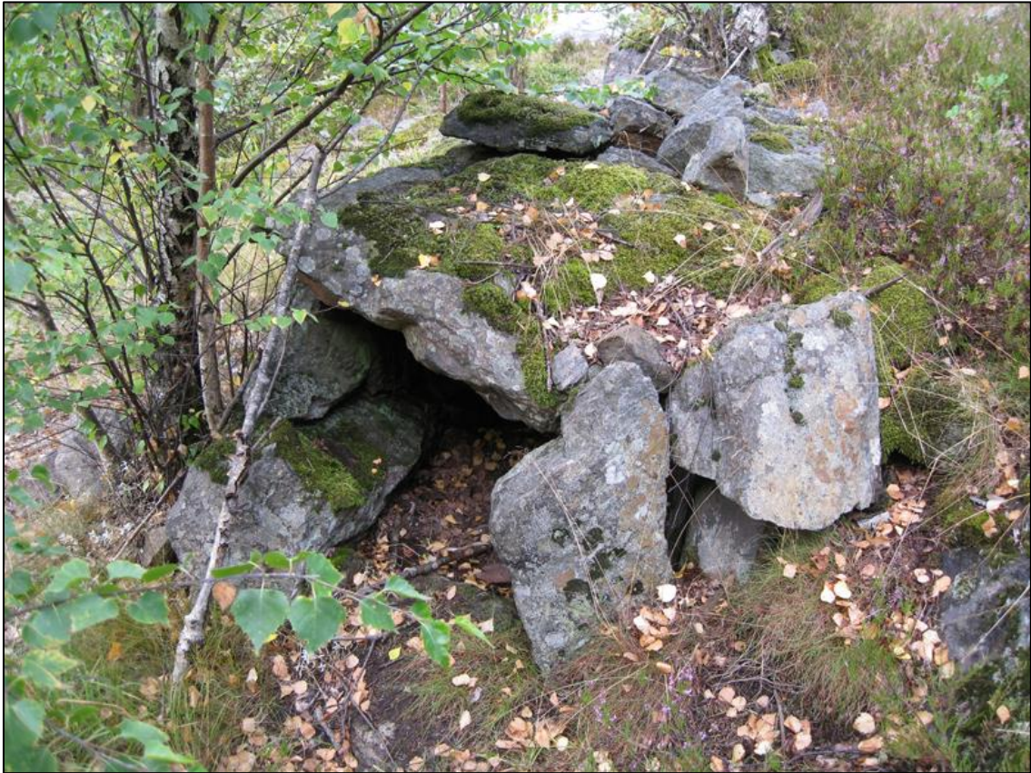
Stenugnen Boo 121