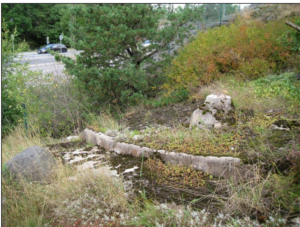
Trappa i f.d. trädgård.