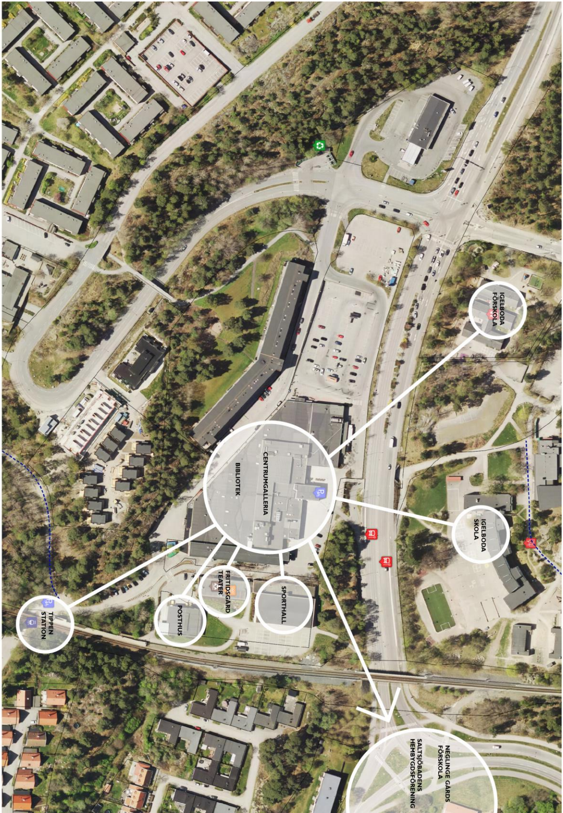
Översiktlig bild som visar Saltjöbadens centrum och omkringliggande målpunkter.