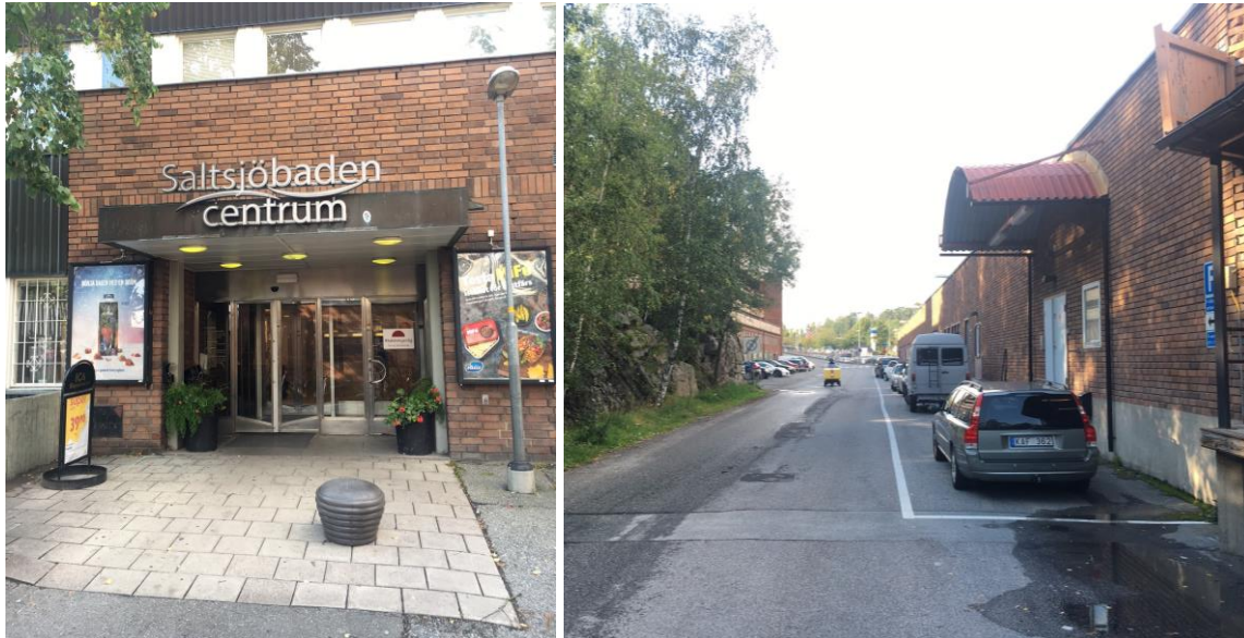
Bilderna visar hur Saltsjöbadens centrum ser ut i dagsläget. Bilden t.v. visar centrumentré från nordöst och bilden t.h. visar centrumets baksida längs Torggatan.