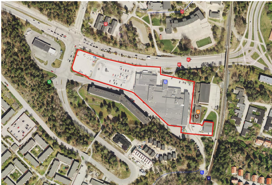
Ortofoto över Saltsjöbadens centrum. Projektets preliminära avgränsning i rött.