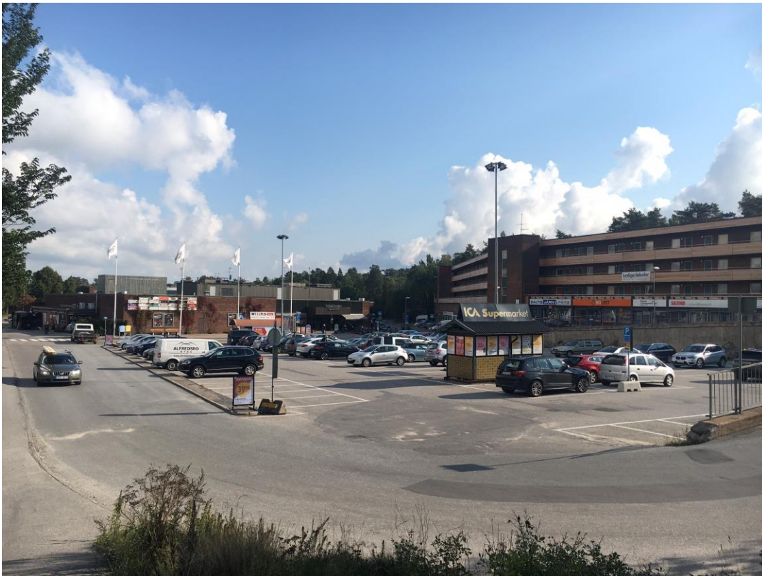
Bilden ovan illustrerar de stora, asfalterade parkerings- och infartsytorna.

Saltsjöbadens centrumbyggnad består idag av 9 275 kvadratmeter uthyrningsbar yta med handel och service. I centrum finns förutom livsmedelsbutik och systembolag ett gym, bibliotek, frisör, optiker, skomakeri, kemptvätt, vårdcentral, tandläkare, apotek, bank, veterinär, kläd- och skobutik, elbutik, blomsterbutik, bokhandel, tre restauranger och en postterminal. Hela centrumfastigheten ägs och förvaltas av NREP.