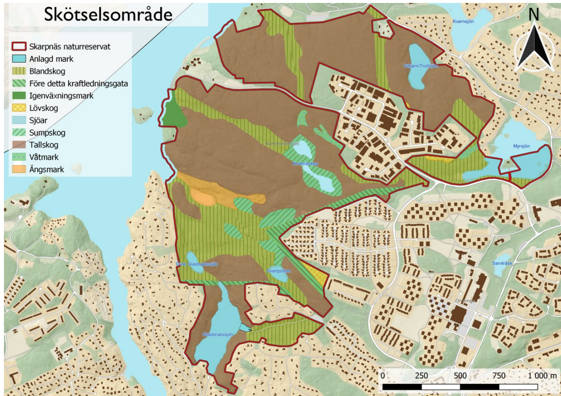
Naturmark inom Skarpnäs naturreservat (från skötselplan för Skarpnäs naturreservat)