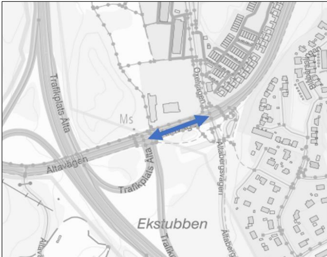
Figur 2. Aktuell vägsträcka på väg 260 Ältavägen i Åtgärdsvalsstudien för väg 260 (Sträcka 1) [3].

Föreslagen bebyggelse innebär avsteg från Åtgärdsvalsstudiens utformningsprinciper. Avstegen består i att avståndet mellan bebyggelse och körbanekant reduceras från 12 till 9,5 meter. Därtill ska busshållplatsens väntyta/resnärsyta ses över ifall eventuella breddningar kan göras.