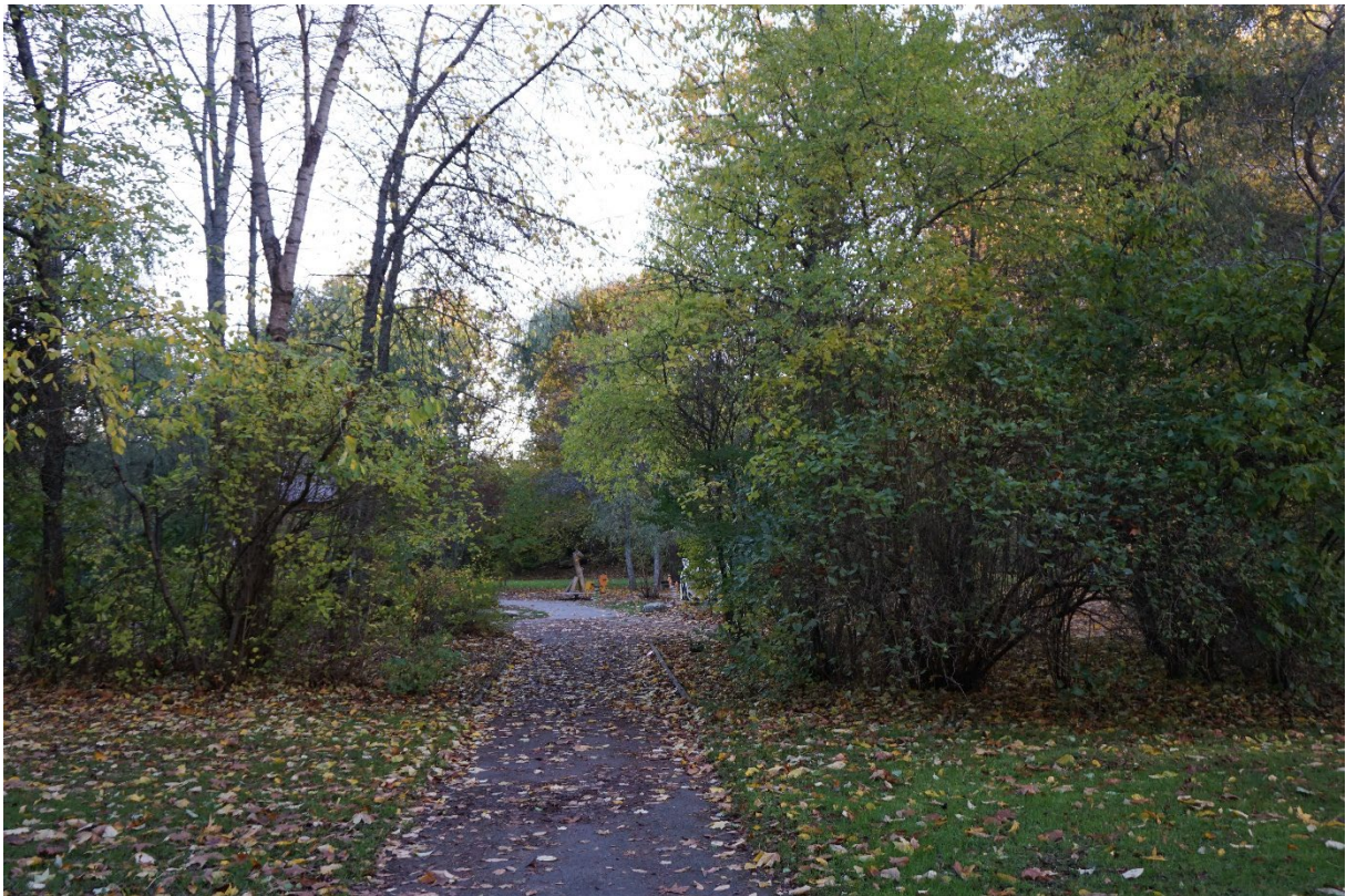
Vegetationen skapar rumslighet i parken.