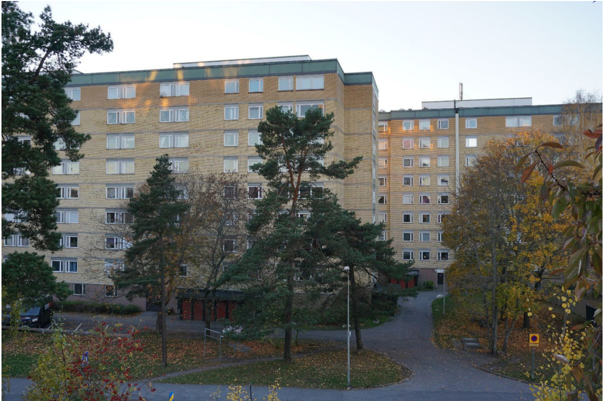
Skivhusen sedda från de nybyggda punkthusen öster om Oxelvägen.