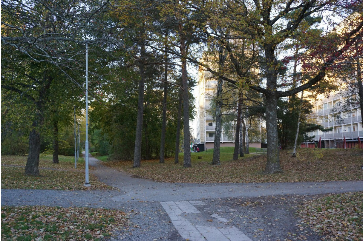
Gångvägar och stigar gör parken mycket tillgänglig.