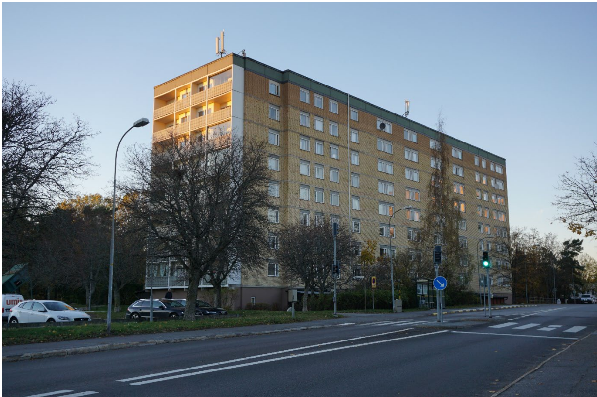
Oxelvägen med det sydligaste skivhuset.