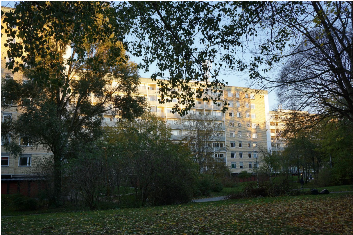
Skivhusen sedda från parken väster om bebyggelsen.