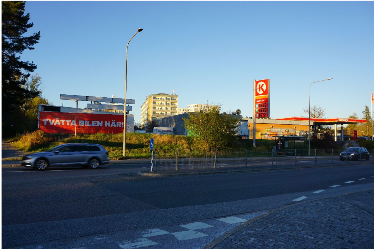
Områdets sydligaste del präglas av trafiklösningar och service för bilismens behov. Skivhusen som kan skimras i fonden bidrar till orienteringen.