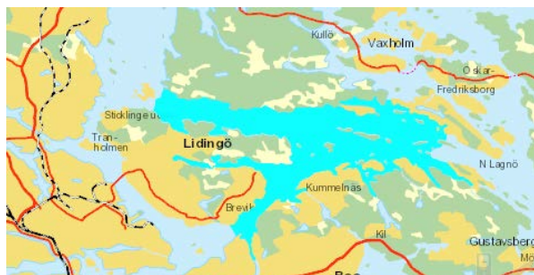
Figur 1 Askrikefjärdens utbredning.

Recipient för avrinningen är Askrikefjärdens vattenförekomst. Huvuddelen av tillrinningen till Askrikefjärden kommer från Mälaren, via Saltsjön och Lilla Värtan. De