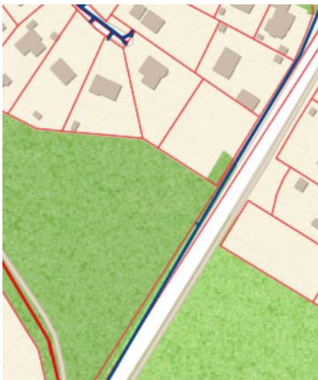
Kommunala vatten- och avloppssystemet