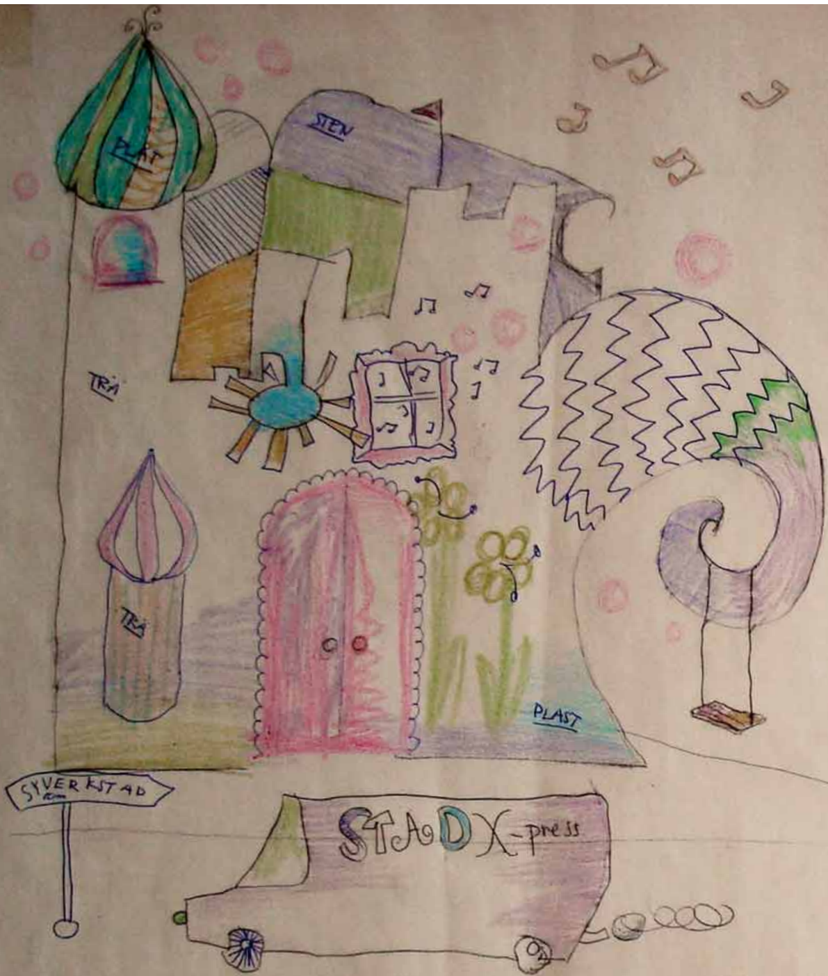
Ungdomar om konsten i Nacka kommun