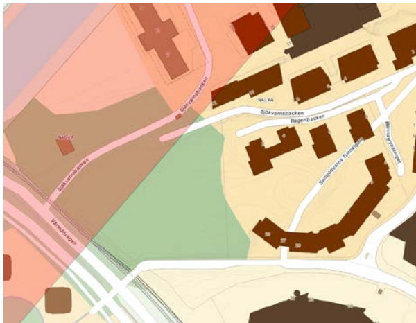
Rosa yta visualiserar område där strandskyddet återinträder vid planläggning

Del av aktuellt område ligger inom 100 meter från strandlinjen, inom vilket strandskydd återinträder vid planläggning.