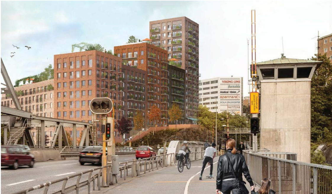
Sökandes förslag, vy från väster