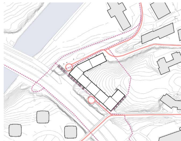
Sökandes förslag, uterum och trafik