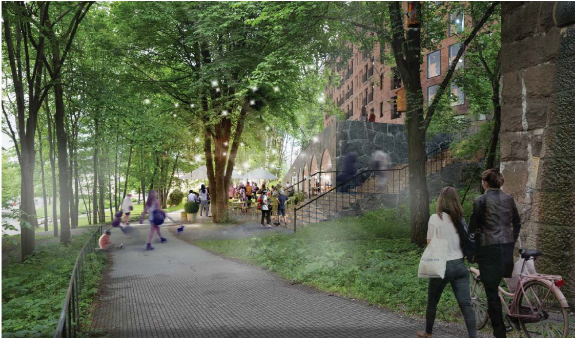
Sökandes förslag, vy från Sjökvärnsbacken under bron