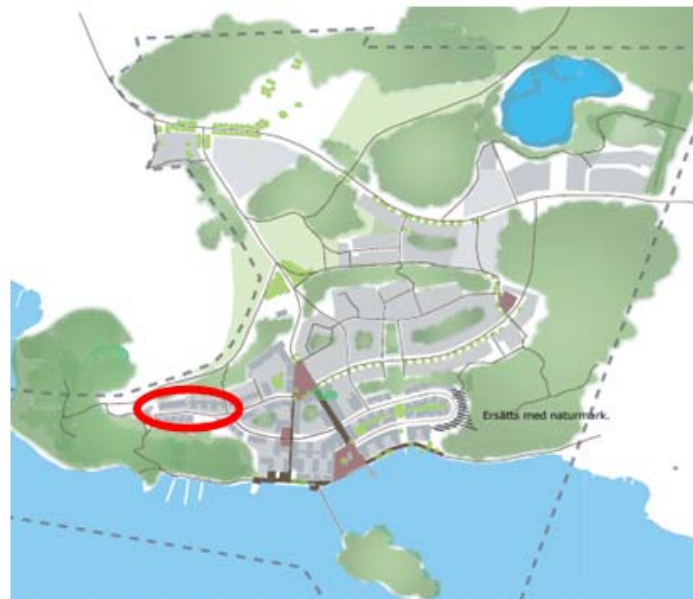
Västra Hällmarken - "Barkerigatan" vars höjd avses ändras