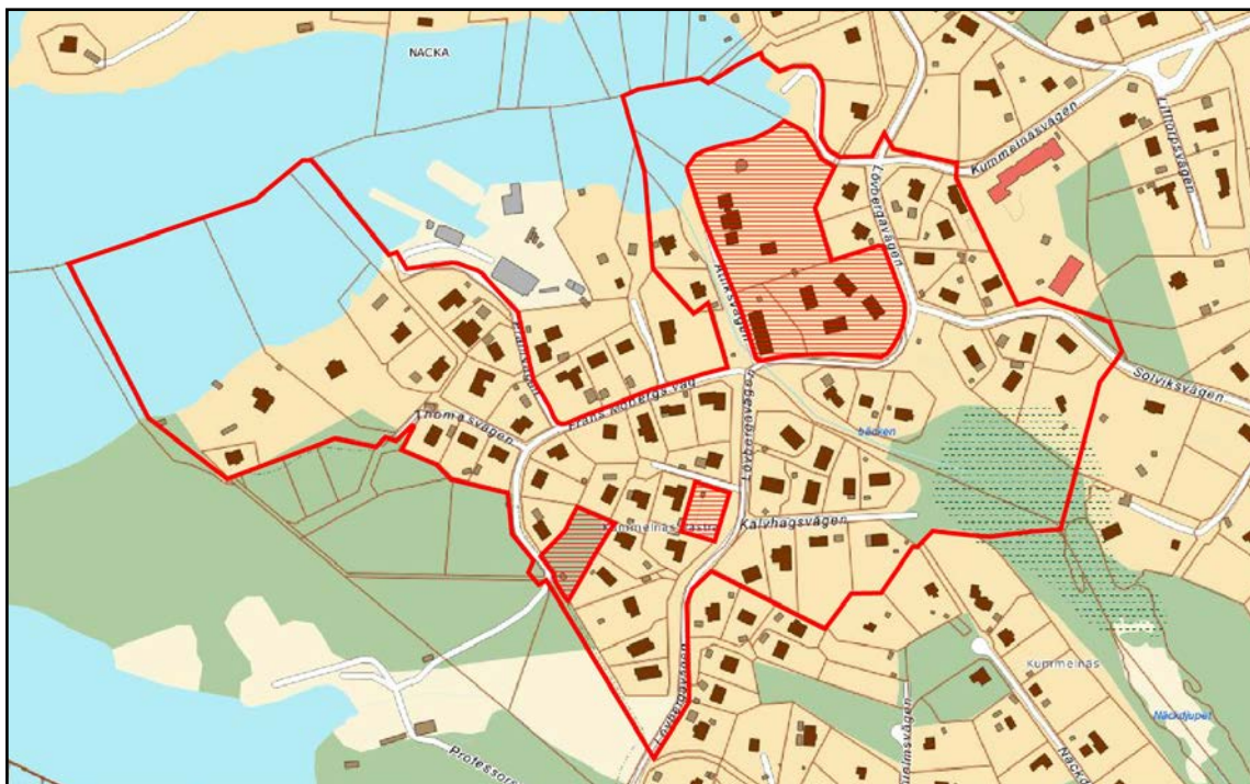
Röd markering visar planområdet. Röd streckat område ingår inte i planområdet.

Planområdet är beläget i Kummelnäs, norra Boo, och begränsas av Pråmvägen, Frans Mobergs väg, Kummelnäsvägen och Kummelnäsviken i norr, Gärdesudden i sydväst, Lövbergavägen i söder och Kummelnäs förskola i öster. Planområdet omfattar 58 privatägda bostadsfastigheter. Planområdet omfattar även allmän platsmark som ägs av Nacka kommun och Sågsjöns fastighetsägareförening. Det är enbart för kvarterersmark för bostadsändamål som planändringen innebär någon förändring. Planområdet omfattar samtliga fastigheter som regleras av detaljplan 19 förutom fastigheterna Kummelnäs 13:1, Kummelnäs 11:132, Kummelnäs 11:107, Kummelnäs 1:345, Kummelnäs 11:106, Kummelnäs 11:105 och Kummelnäs 11:104. Planområdet utgör en areal om cirka 153000 kvadratmeter.