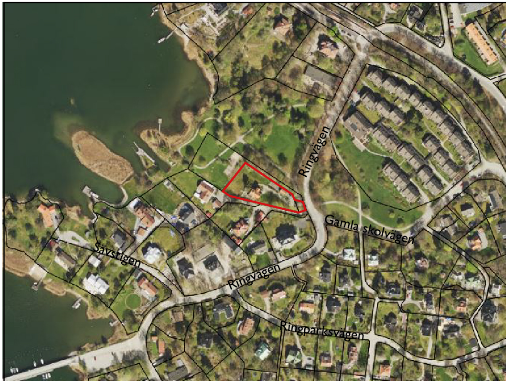
Kartan visar ett flygfoto över planområdet markerat med röd linje och omkringliggande bebyggelse.

Fastigheten Rösunda 9:14 omfattar cirka 2344 kvadratmeter och är bebyggd med en huvudbyggnad om cirka 125 kvadratmeter byggnadsarea och ett garage om cirka 40 kvadratmeter byggnadsarea. Garaget är planstridigt i byggnadsareaavseende och står delvis på prickmark. Huvudbyggnaden är byggd i två plan, med en nockhöjd om cirka 10,5 meter. Huvudbyggnaden är planstridig i nockhöjdsavseende. Tomten karaktäriseras av en friliggande villa i ett centralt läge, omgiven av grönska. Fastigheten Rösunda 9:15 är kommunalt ägd, cirka 2790 kvadratmeter och har markanvändning park. Det är enbart cirka 125 kvadratmeter av fastigheten Rösunda 9:15 som ingår i detaljplaneförslaget.