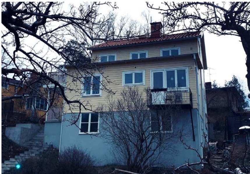
Befintlig huvudbyggnad, vy från Skogalundsvägen

Befintlig huvudbyggnad har idag ett planstridigt utgångsläge gällande placering och antal våningar. Byggnaden är delvis placerad på så kallad prickmark, mark som inte får bebyggas, enligt gällande byggnadsplan. Cirka 17 kvadratmeter av byggnaden ligger inom prickmark. Byggnaden är även planstridig avseende minsta avstånd till fastighetsgräns mot Klyvarevägen. Vidare är byggnaden planstridig gällande våningsantalet. Gällande byggnadsplan tillåter två våningar och befintlig byggnad är utförd i tre våningar, enligt dagens juridiska tolkning av begreppet våning.