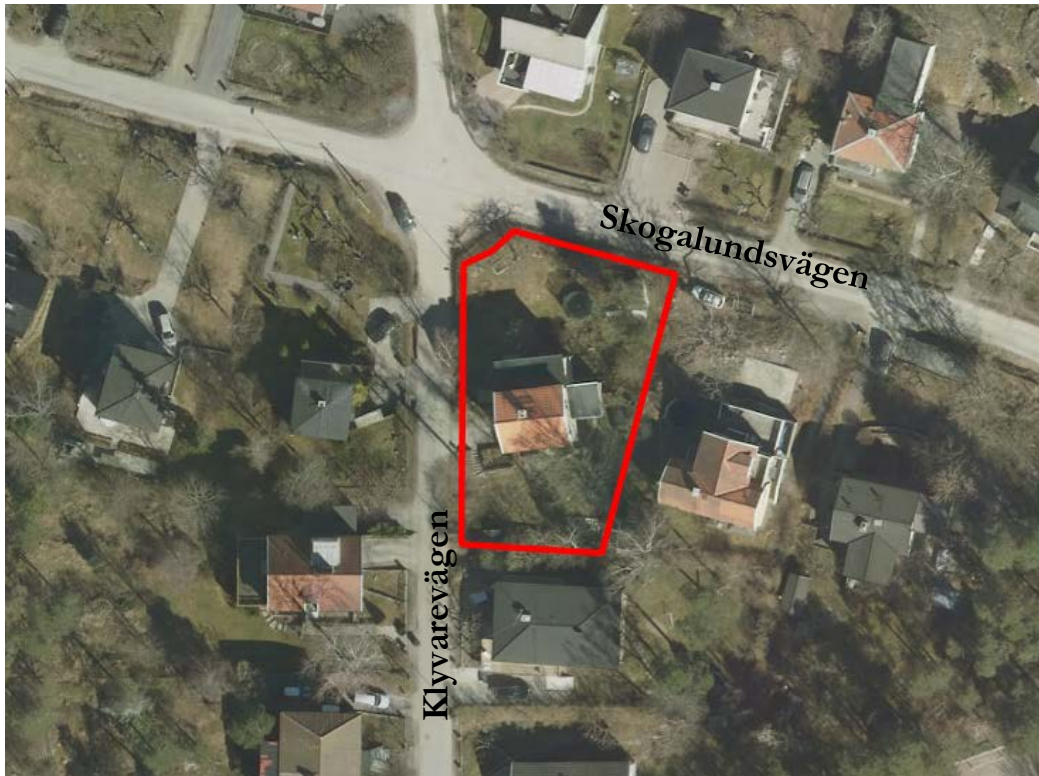
Kartan visar ett flygfoto över planområdet. Röd linje anger planområdets gräns och fastighetsgräns för Sicklaön 184:1.