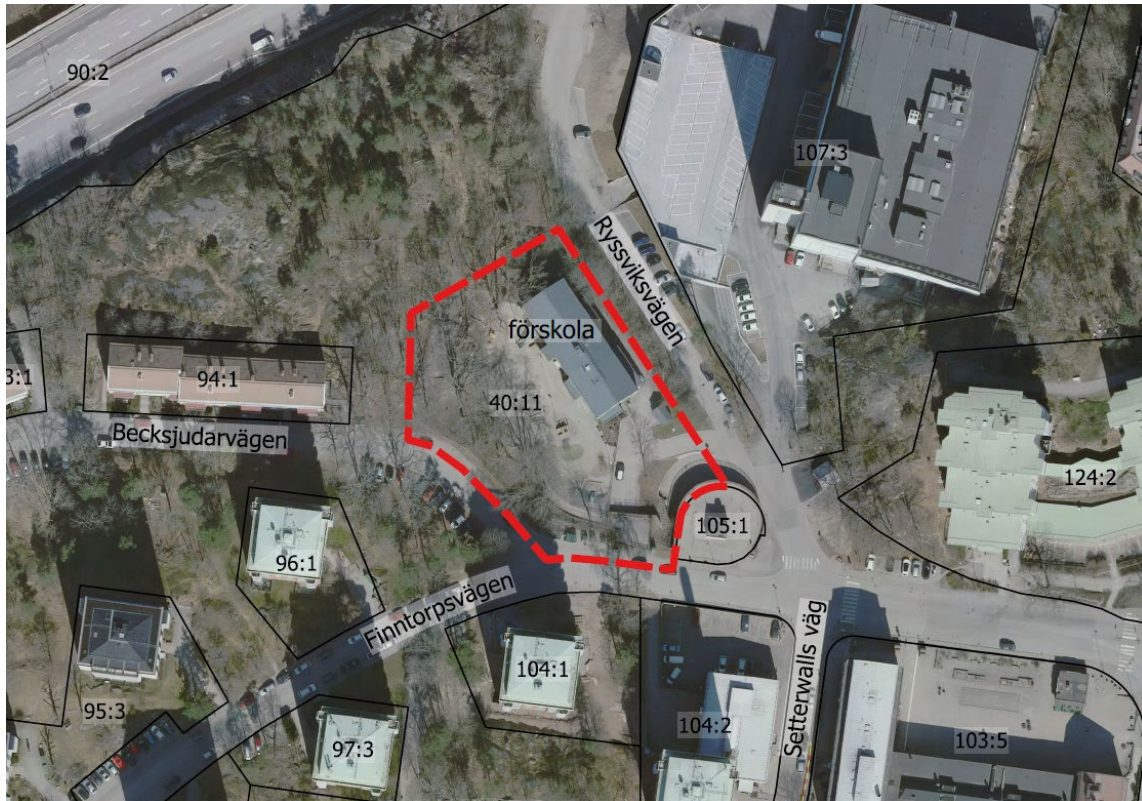
Kartan visar ett flygfoto över planområdet. Röd linje anger gräns för upphävande av del av stadsplanen S1.