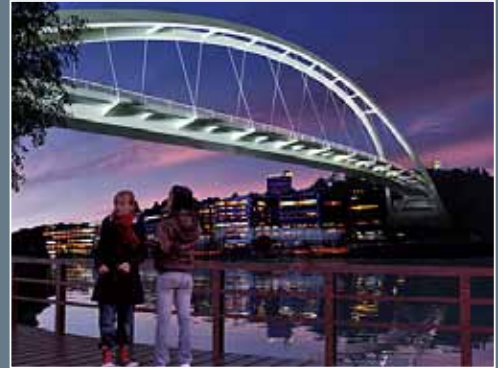
Bron från strandpromenaden vid Svindersviken.