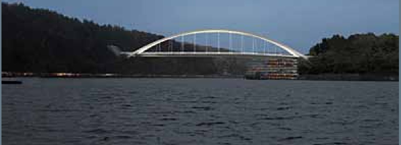
Bron sedd från Stockholms inlopp.