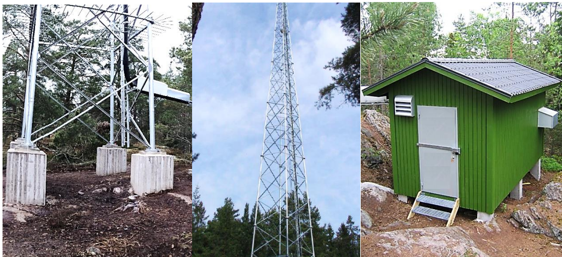
Bild till vänster visar exempel på mastfundament. Bild i mitten visar mobilmast i den masttyp som avses att uppföras. Bild till höger visar utformning av teknikbodarna som verksamhetsutövaren avser att uppföra.

Mobilmasten ska hindermarkeras enligt Transportstyrelsens föreskrifter och allmänna råd TSFS 2010:155 (ändrad genom TSFS 2013:9).