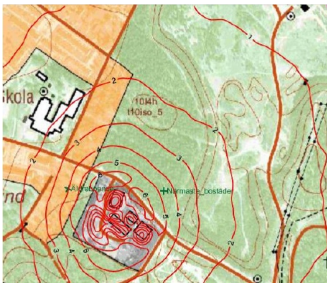
Figur 1. Här redovisas det beräknade haltbidraget av väteklorid som 98-percentil för timmedelvärden under ett år vid maximalt tillståndsgiven produktion. Enhet: \mu\text{g}/\text{m}^3 .

Slutsats: Gällande miljö kvalitetsnormer för luft kommer att klaras inom detaljplanområdet.